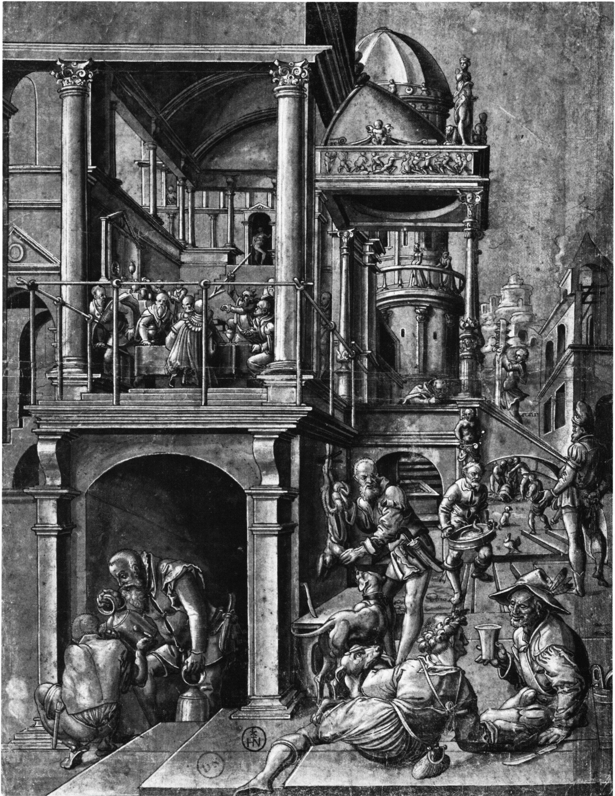
Abb. 1 Tobias Stimmer: Alexander der Grosse wirft den Speer nach Kleitos. Helldunkelzeichnung auf grauer Grundierung. Staatliche Kunsthalle Karlsruhe, Kupferstichkabinett.