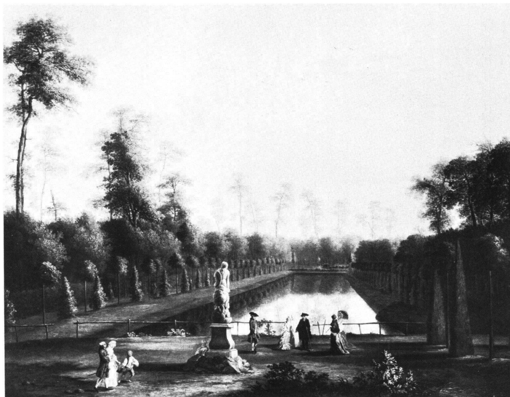
Abb. 2 Philipp Hackert, Venus-Teich im Berliner Tiergarten II. 1761. 59×74 cm. Prinz Louis Ferdinand von Preussen, Burg Hohenzollern.