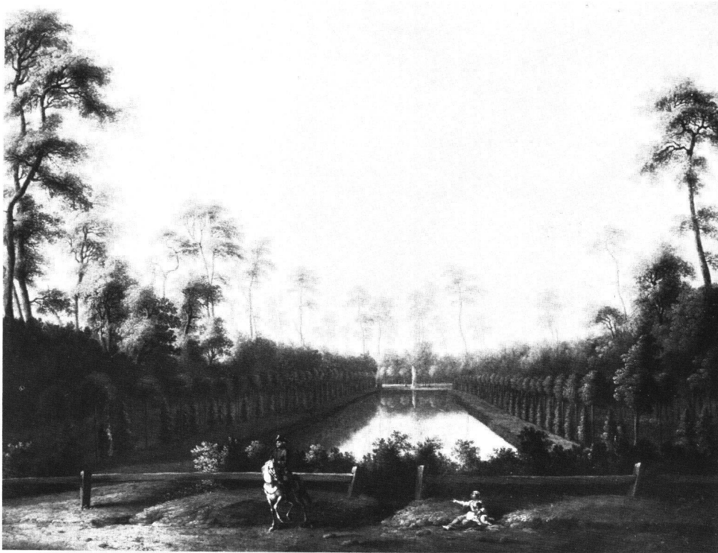
Abb.1 Philipp Hackert, Venus-Teich im Berliner Tiergarten I. 1761. 59×74 cm. Prinz Louis Ferdinand von Preussen, Burg Hohenzollern.