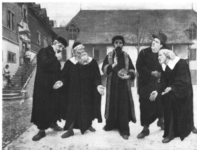
Fig. 4 FERDINAND HODLER: Calvin et les professeurs dans la cour du Collège de Genève, 1883-1884. Huile sur toile. 100×130 cm. Signé en bas à gauche: «Calvin comme recteur/Hodler». Musée d'art et d'histoire, Genève.

Pour illustrer la persistance de l'acquis compositionnel issu du Bataillon bernois de 1881, on s'en tiendra à un seul exemple qui en prolonge les effets et les porte à leur paroxysme: Dans L'unanimité de 1911-13 (Hôtel-de-Ville de Hanovre), Hodler pousse le parallé-