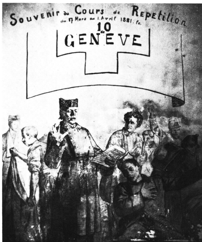
Fig. 1 FERDINAND HODLER: L'appel en chambre 1881. Fusain et huile sur plâtre. 300×250 cm. Signé en bas à gauche: «Hodler». Caserne de Bière (Vaud).

L'intérêt majeur de la participation de Ferdinand Hodler (Berne 1853 – Genève 1918) à l'exécution du Panorama d'Edouard Castres (Genève 1838 – Etrambières 1902) réside dans le fait qu'elle marque la première application dans l'œuvre du jeune Bernois d'un principe de composition qui caractérisera jusqu'à son style tardif et qu'il appellera le parallélisme. 1 Or, nous allons voir qu'il en doit l'inspiration à l'auteur du Panorama , Edouard Castres. Nous allons par conséquent considérer sous l'angle stylistique la scène du Panorama dont Hodler fut chargé, en l'inscrivant dans l'évolution générale de son style pictural.