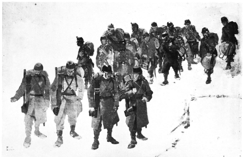
Fig. 2 EDOUARD CASTRES: Etude pour le Panorama des Bourbakis: L'arrivée du bataillon bernois 1876/1881. Huile sur toile. 43×61 cm. Monogrammé en bas à gauche: «E.C.» Fondation Gottfried-Keller, Berne, déposé au Musée militaire de Colombier (Neuchâtel).

Mais la question qui se pose aussitôt est de savoir si Hodler était l'inventeur ou seulement l'exécutant de cette scène? La réponse nous est donnée par l'une des études peintes de Castres pour le