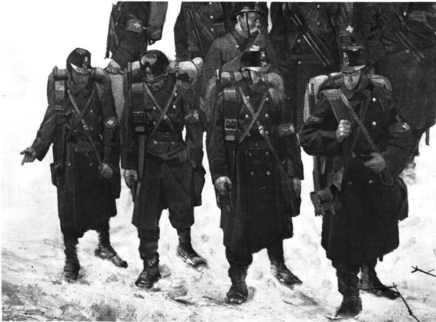
Fig. 3 FERDINAND HODLER: L'arrivée du bataillon bernois (Détail du Panorama des Bourbakis) 1881. Huile sur toile. Propriété de l'Association pour la protection des monuments historiques du Canton de Lucerne.

Panorama , celle qui représente précisément cette Arrivée des Bernois (fig. 2): c'est elle qui a servi de modèle pour le morceau peint par Hodler (fig. 3). C'est elle aussi qui nous permet de procéder aux constatations les plus intéressantes quant à la part créatrice qu'ont eu respectivement le maître d'œuvre et son aide dans cette partie de l'ouvrage. A cet égard, nous n'aurons pas à insister outre mesure sur certaines différences de conception, car il paraît parfaitement normal que les modifications ostensibles apportées au programme pictural entre l'étude et l'exécution monumentale – comme par exemple l'allongement de la colonne des militaires, l'introduction de cavaliers en son sein, etc. – soient le fait du maître d'œuvre plutôt que de son exécutant.