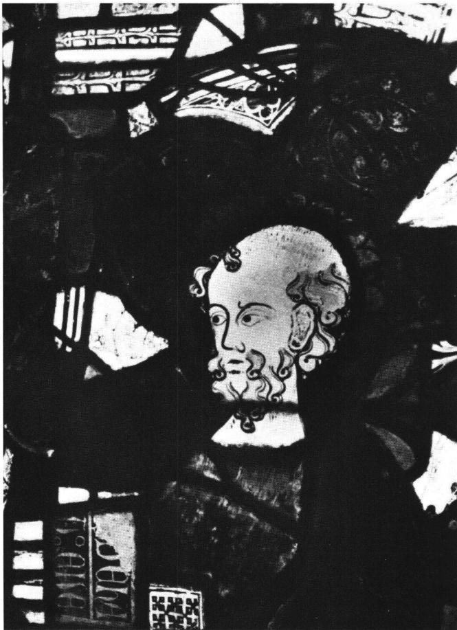
Fig. 6 Dives, détail d'un des grands châssis montrant la tête de saint Paul.

registre de trilobes, puis deux roses à cinq lobes et, dans l'amortissement, une grande rose à six lobes.