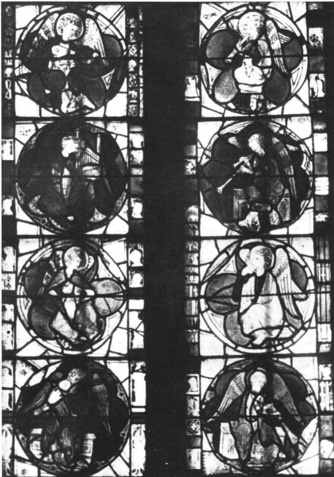
Fig.1 Dives, châssis contenant les anges musiciens dans leur présentation ancienne.

En 1982, une antiquaire parisienne proposait huit panneaux de vitrail du XIV ème siècle avec des anges musiciens, dont la provenance put être établie grâce aux notes de Jean Lafond.