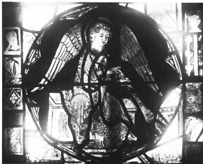
Fig. 2 Dives, ange jouant de la cornemuse.

Dans le troisième registre, à gauche, l'ange joue de l'orgue positif. Tourné vers la droite, il est assis sur un tertre pourpre. Ses ailes sont blanches, mais rendues opaques par la corrosion. Un manteau vert dissimule largement la robe blanche à motifs de carrés quadrilobés peints à la grisaille. Des redents ornés de motifs architecturaux, comme dans le