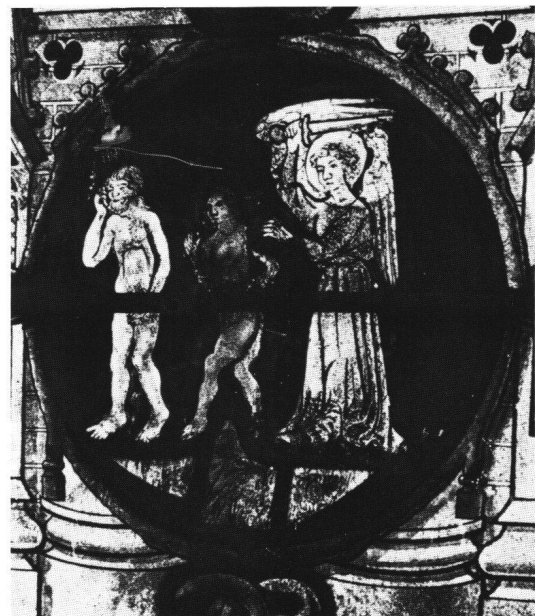
Fig. 8 Dives, église paroissiale, Adam et Eve chassés du Paradis . Détail de la grande verrière orientale.

Cette description nous permet de restituer la composition générale de la verrière, qui occupait une baie à six lancettes surmontées d'un tympan comprenant de bas en haut un