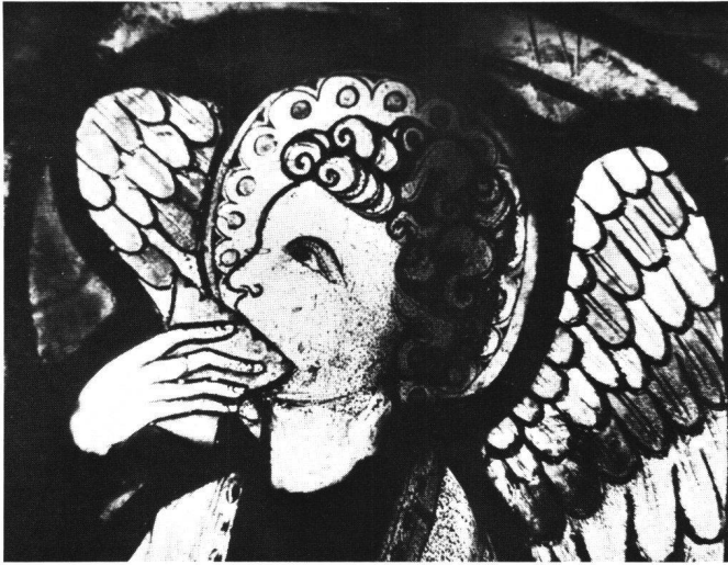
Fig. 4 Dives, ange jouant du syrinx: détail.