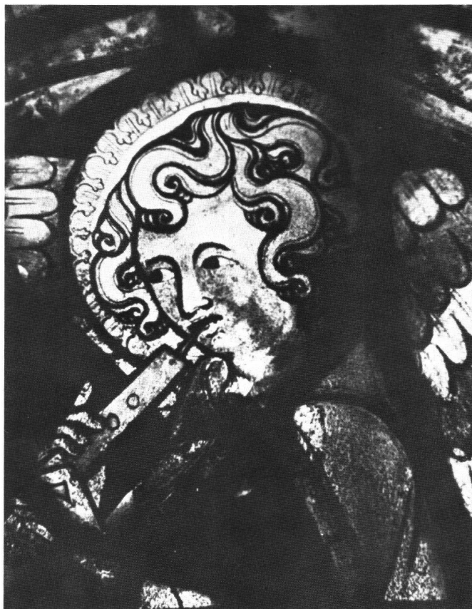
Fig. 3 Dives, ange jouant du hautbois: détail.

Malgré quelques disparités, ces huit médaillons forment un ensemble homogène. D'abord, les dimensions et les proportions sont identiques d'un panneau à l'autre. Une même recherche du détail se manifeste dans le décor: de petits éléments d'architecture apparaissent dans des redents ou sur des banquettes; le bord de tous les manteaux – sauf celui de l'ange aux cymbales – est orné de galon orfèvrés. Les nimbes portent également un décor peint de festons plus ou moins ouvragés, de points, etc. Le jaune d'argent joue un rôle important dans le traitement de ces détails.