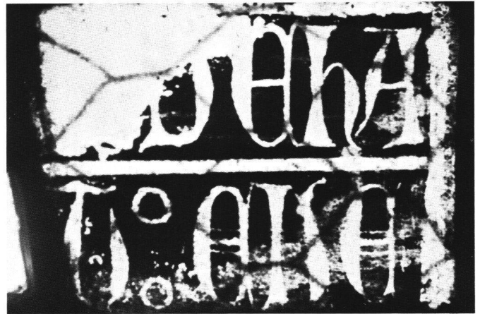
Fig. 7 Dives, détail montrant l'inscription relative à Guy d'Harcourt.

Parmi les «scènes de la chute de l'homme» qu'A. de Caumont signalait au tympan, trois ont été réutilisées à la base de la verrière moderne (due au peintre verrier de Lisieux, Duhamel-Marette): la Création d'Eve , la Tentation et l' Expulsion du Paradis (fig. 8). Ce sont de petits médaillons circulaires, mesurant actuellement 0,24 m de diamètre, très restaurés. Comme pour les anges musiciens, il est virtuelle-