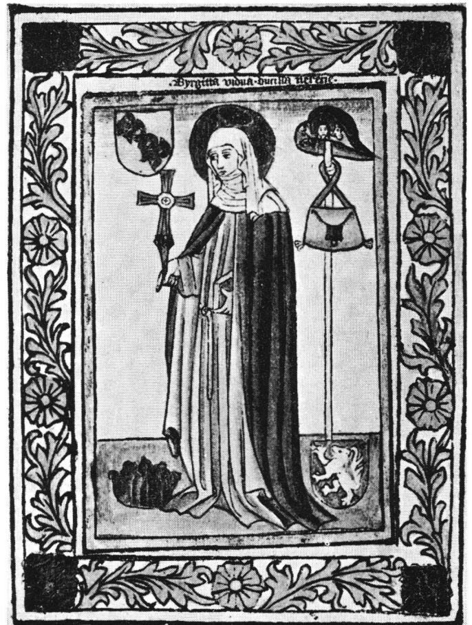
Abb. 10 «Byrgitta vidua...». Kolorierter Einblattholzchnitt, 20,9×15,7 cm. Deutschland, Oberrhein oder Augsburg, kurz nach 1450. – Paris, Louvre, Cabinet des estampes, Edmond de Rothschild (Inv.No. 26 Rés.). (Schreiber 1287).

Ein dreiteiliger, grosser, kolorierter Holzschnitt (Abb. 8, Schreiber Nr. 1283) schildert die «Sancta Birgita witi» als Äbtissin, wie sie von ihrer Sitzbank neben dem Schrägpult ihre Ordensregel zu sieben Nonnen und sieben Mönchen hinreicht. Unter dem Heiligen Geist, zwischen Gnadenstuhl und Gottesmutter mit Kind steht das Monogramm Jesu über ihrem Haupt. Im Spruchband über den knienden Nonnen wird sie als «sponsa Jesu» betitelt. Die Mönche des Doppelklosters, mit dem Zeichen des Jerusalemkreuzes an der Kutte, beten: «o pater de celis miserere nostri». Auch hier fehlt der Stab mit Tasche und Hut nicht. Das Löwenwappen und das SPQR-Schild flankieren links die Schwedenkrone, rechts die Wappen Wittelsbach und Oettingen. Engelberg Baumeister vermutet als Entstehungsort Augsburg und glaubt, dass dieser Holzschnitt vielleicht zur Einweihung des unter dem Schutze des Hauses Oettingen stehenden Birgittenklosters Maihingen im Jahre 1481 angefertigt worden sei (Heitz 40, 1913, p. 14). Mehrere Exemplare dieses Holzschnitttriptychons blieben erhalten, das vorliegende ebenfalls in Maihingen, einem Zentrum der Birgittenverehrung.