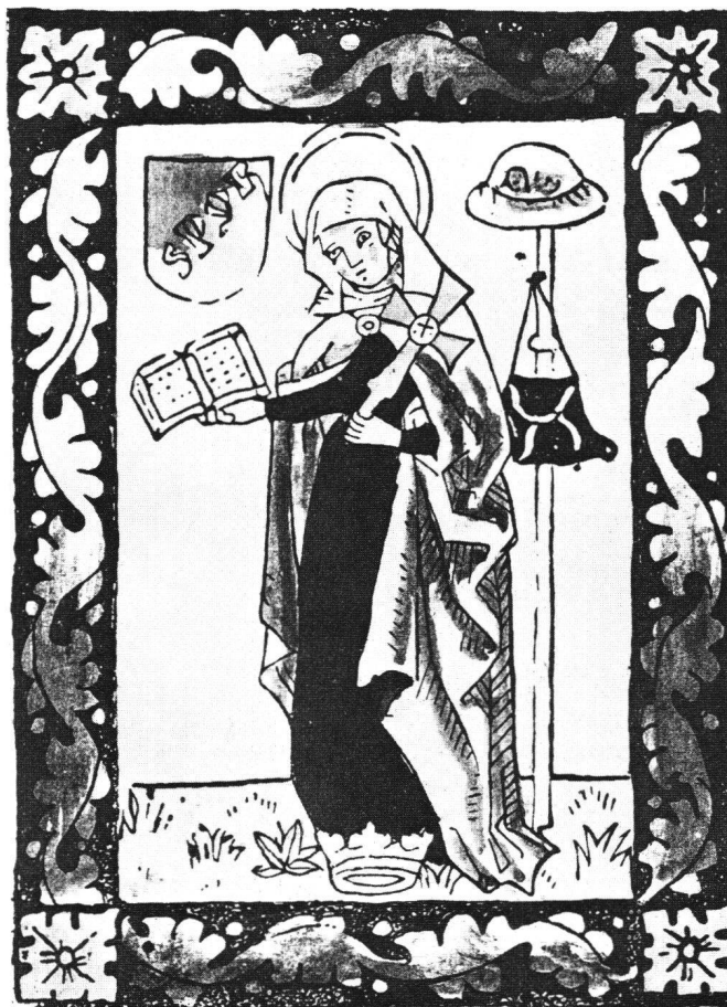
Abb. 11 Hl. Birgitta von Schweden. Kolorierter Einblattholzschnitt, 16,1×11,4 cm. Deutschland, 2. Hälfte 15. Jh. – Maihingen, Fürstl. Sammlung Oettingen – Wallerstein. Eingeklebt auf der Innenseite des Vorderdeckels einer Professionale-Handschrift von 1499 (II. Lat. I 4°42). Isak Collijn in: Birgitta Utställningen, Vadstena 1918, Nr. 18 [um 1481–1485]).

Selbstverständlich fehlt die hl. Birgitta nicht in den seit 1500 sich häufenden Editionen des «Hortulus animae» verschiedener Autoren, wie etwa des Hans Baldung Grien,