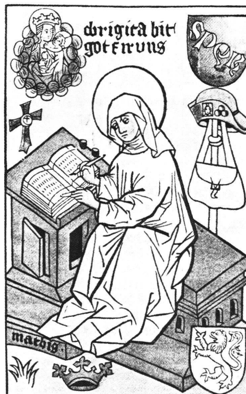
Abb. 6 «o brigita bit / got fir uns». Kolorierter Holzschnitt in einer mittelalterlichen Handschrift. Deutschland, 2. Hälfte 15. Jh. – Prag, Nationalbibliothek.