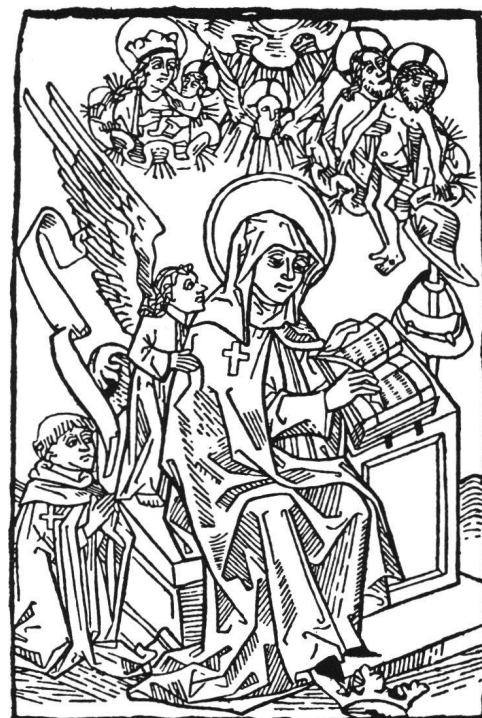
Abb. 7 St. Birgitta. Holzschnitt in «Die purde der welt», Augsburg, bei Anton Sorg, 1482.