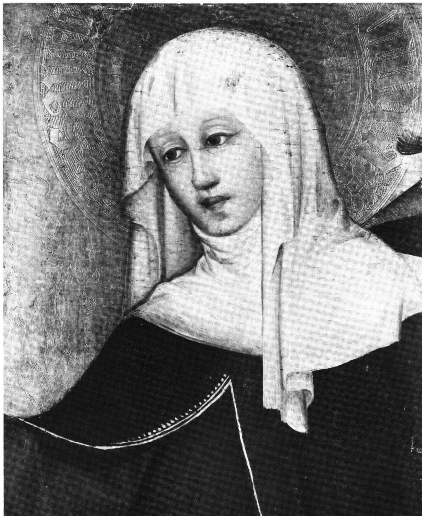
Abb. 1 Lukas Moser (geb. um 1380 in Weil der Stadt, tätig in Ulm und 1431 in Tiefenbronn): Bruststück einer hl. Witwe . Fragment eines Altarflügels (Innenseite), um 1430. Tempera auf mit Leinwand überzogenem Tannenholz, 38×29,5 cm. – Basel, Öffentliche Kunstsammlung (Inv.Nr. 1555).