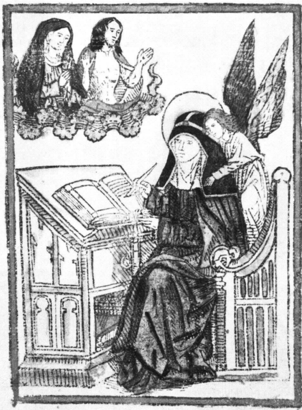
Abb. 5 Hl. Birgitta von Schweden. Kolorierter Einblattholzschnitt, 10,7×7,8 cm. Deutschland, 2. Hälfte 15. Jh. – Exemplar in Rotterdam, Museum Boymans-van Beuningen, Kupferstichkabinett.

Die gleiche Komposition klingt vereinfacht zu Ende des Jahrhunderts noch im Holzschnitt im Buch der Offenbarungen der hl. Birgitta bei Konrad Zeninger (Nürnberg 1481, Schreiber Nr. 1290) nach (Abb. 3). Verändert kehrt sie wieder auf der Gedächtnistafel für Brigitte Topler, geb.