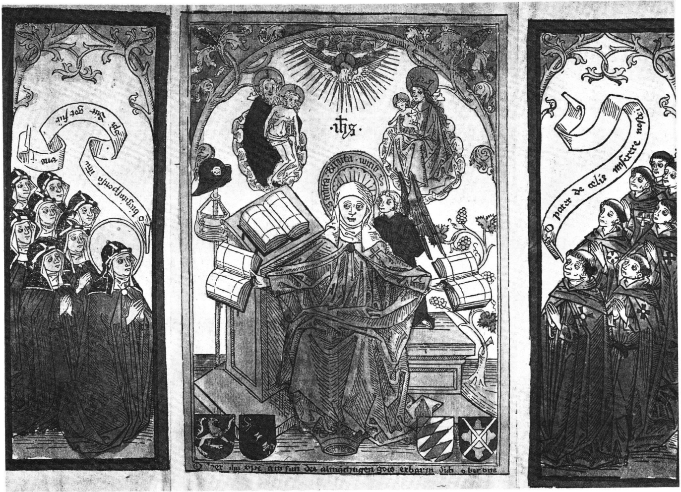
Abb. 8 Die hl. Birgitta zwischen Ordensschwwestern und -brüdern, «Sancta Birgitta witib». Dreiteiliger kolorierter Einblattholzchnitt mit den Wappen Wittelsbach und Oettingen. Linker Flügel 26,5×9,7 cm; rechter Flügel 26,5×9,3 cm; Mittelteil 25,5×18,7 cm. Deutschland, 4. Viertel 15. Jh. – Maihingen, Fürstl. Sammlung Oettingen-Wallerstein. (Weitere Exemplare in Berlin, Kupferstichkabinett; München, Nationalmuseum und Staatl. Graphische Sammlung. Schreiber Nr. 1283).

Marstaller (†1483), einem Gemälde auf Fichtenholz, das ihr Gatte Konrad Topler (†1485) in die St. Katharinakirche zu Nürnberg gestiftet hatte, – heute im Germanischen Nationalmuseum, Inv.Nr. Gm 151 (Abb. 4). Anstelle des Gnadenstuhls erscheint Gottvater allein neben der Heiligeistaube und Maria mit dem Kind. Links unten knien Kaiser und Papst vor dem vierfachen Attribut und in der Mitte, kleinfigurig, das Ehepaar Topler-Marstaller zwischen seinen Wappen. Angelehnt an den Fuss der Bank das gevierte Wappen Birgittens.