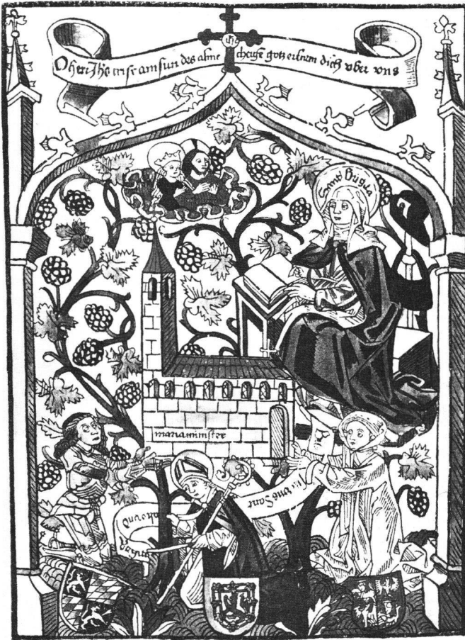
Abb. 9 Die Heiligen Alto und Birgitta, «Bit fur vns Sant alto vnd Birgita.» Kolorierter Einblattholzchnitt, 24,4×24,4 cm. Deutschland, Augsburg, Ende 15. Jh. – München, Staatl. Graphische Sammlung. (Schreiber Nr. 2923 [1185a]: Zum Andenken an die 1496/97 erfolgte Gründung des Klosters Mariamünster; vom sog. Pflanzenmeister, Augsburg).

Einblattholzschnitte (so Schreiber Nr. 1288), die als schwäbisch um 1450/1470 taxiert werden.