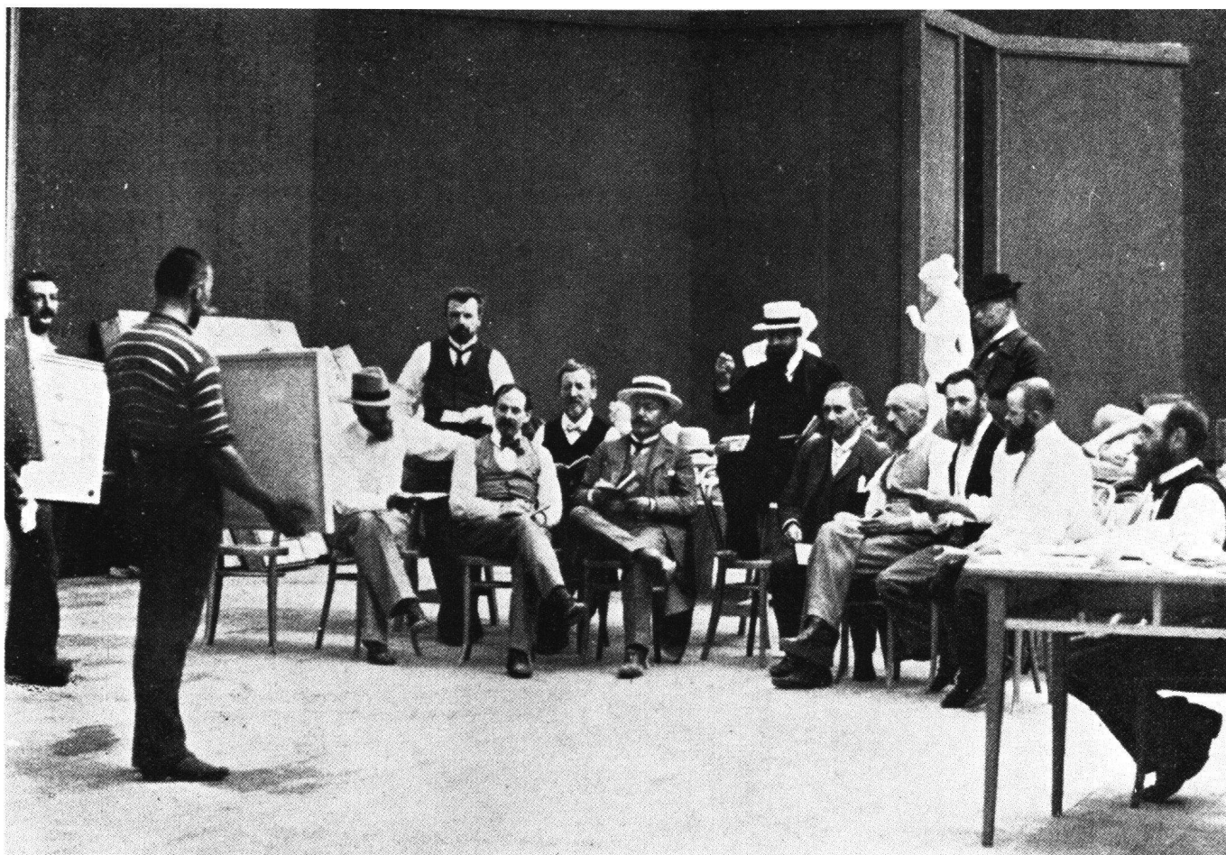
Fig. 3 «Le Jury pendant ses opérations. – Die Jury an der Arbeit». Photographie publiée en tête du catalogue de la VII e Exposition nationale des beaux-arts, Vevey 1901.