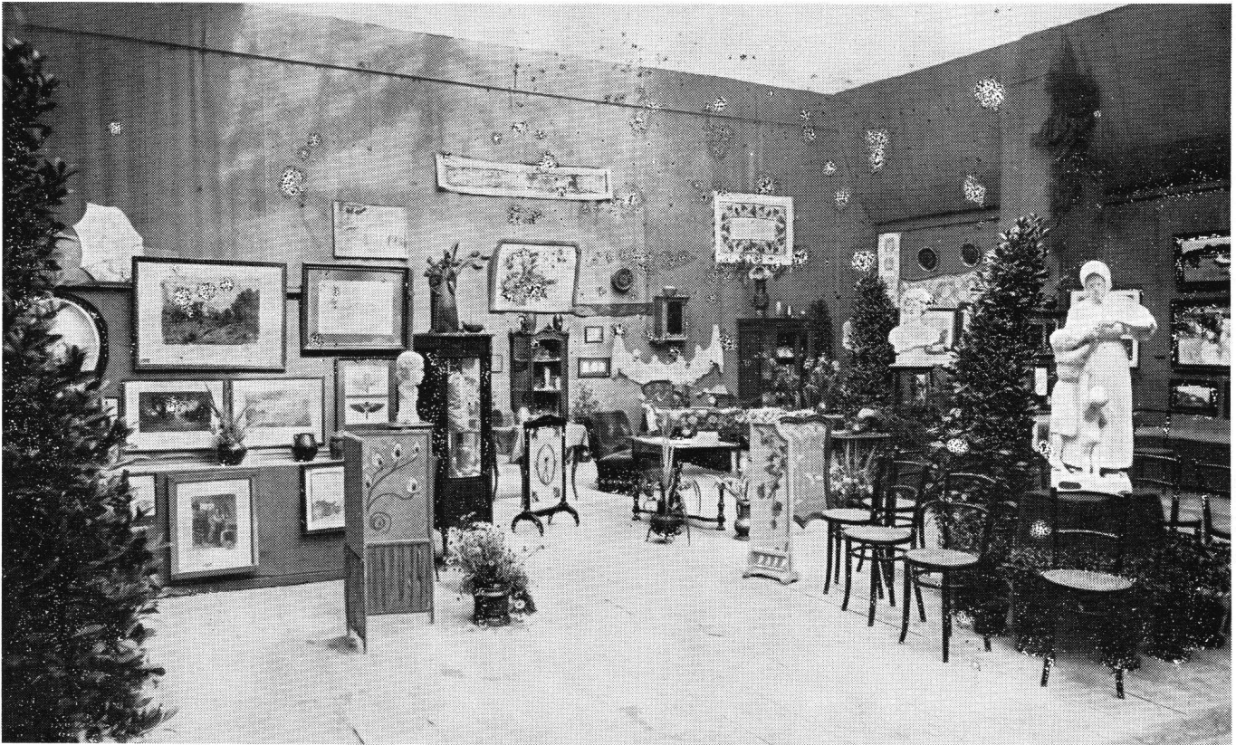
Fig. 6 Photographie anonyme d'une salle de la 1 ère Exposition de la Société romande des femmes peintres (future SSFSPD/GSMBK) tenue à la Grenette, Lausanne 1903.

arts appliqués; en 1923, Adèle Lilljeqvist entre à la Commission fédérale des beaux-arts. En 1928 année de la SAFFA, la section bernoise propose l'admission des décoratrices; le sigle est définitif: SSFSPD/GSMBK. Dès 1944, les membres de la SSFSPD peuvent s'inscrire à la caisse-maladie de la SPSAS (mais, jusqu'en 1963, à des conditions encore inégales). A partir de 1977, le Comité central est composé par les présidentes des sections. En 1978, la Section NE fusionne avec la Section BE. Actuellement, la Société comprend environ 450 membres, réunies en 5 sections: VD, GE, BE, BS, ZH. Elles ont organisé, et organisent encore, des expositions de section; il n'en est pas tenu compte dans la présente liste.