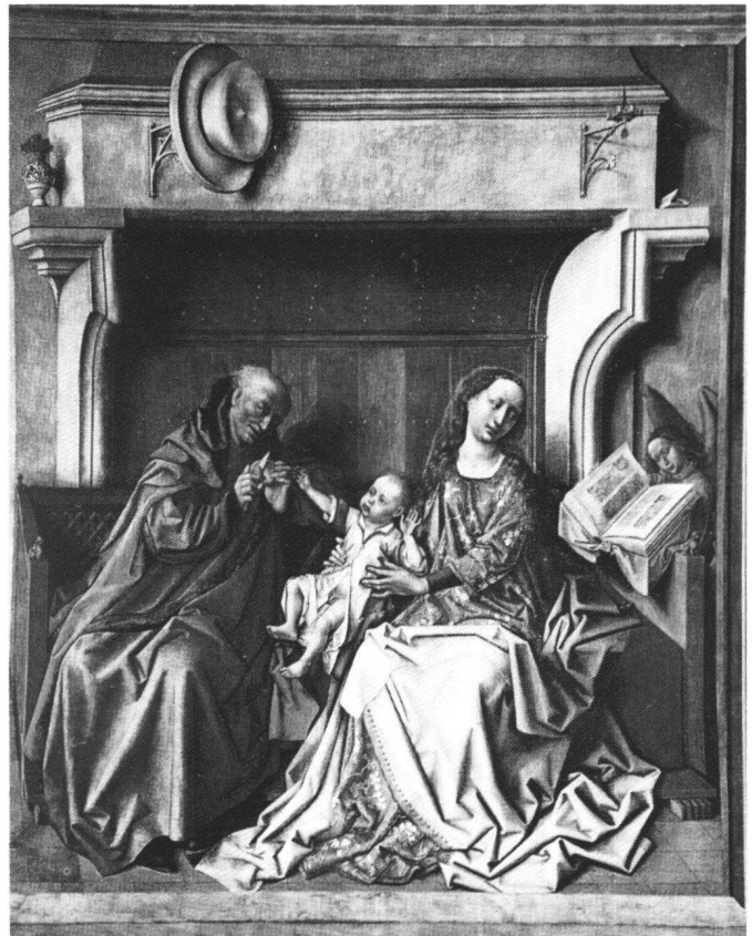
Fig. 6 Sainte Famille devant une cheminée, atelier de Robert Campin (?), Cathédrale du Puy.

On peut objecter à cette reconstitution que les grandes arcades gauches sont visibles dans deux panneaux à la fois. Le problème est dû au double point de fuite du panneau de Strasbourg, mais il n'a rien d'exceptionnel. On songe à la multiplication des points de fuite par Rogier van der Weyden dans le Retable de Miraflores (Berlin, Kaiser Friedrich Museum). Surtout, le point de fuite principal du tableau de Strasbourg vient converger avec celui du tableau de Naples, lorsqu'on agrandit ce dernier de telle sorte que la base de l'arc diaphragme corresponde au bord supérieur du tableau de Strasbourg. Il me semble s'agir d'un argument très fort en faveur de la reconstitution.