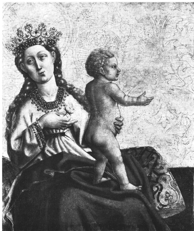
Fig. 5 Vierge à l'Enfant ( Madone d'Olsberg ), d'après Konrad Witz. Öffentliche Kunstsammlung, Bâle.

La nef représentée dans le tableau de Naples s'apparente de toutes manières infiniment plus au bas-côté du panneau de Strasbourg qu'à n'importe quel autre modèle connu. On a dit qu'elle était moins réussie du point de vue de la perspective. 11 C'est vrai pour les détails mais pas du procédé de construction. Dans les deux cas, l'artiste a tracé les lignes de fuite principales avec un point de fuite unique, situé laté-