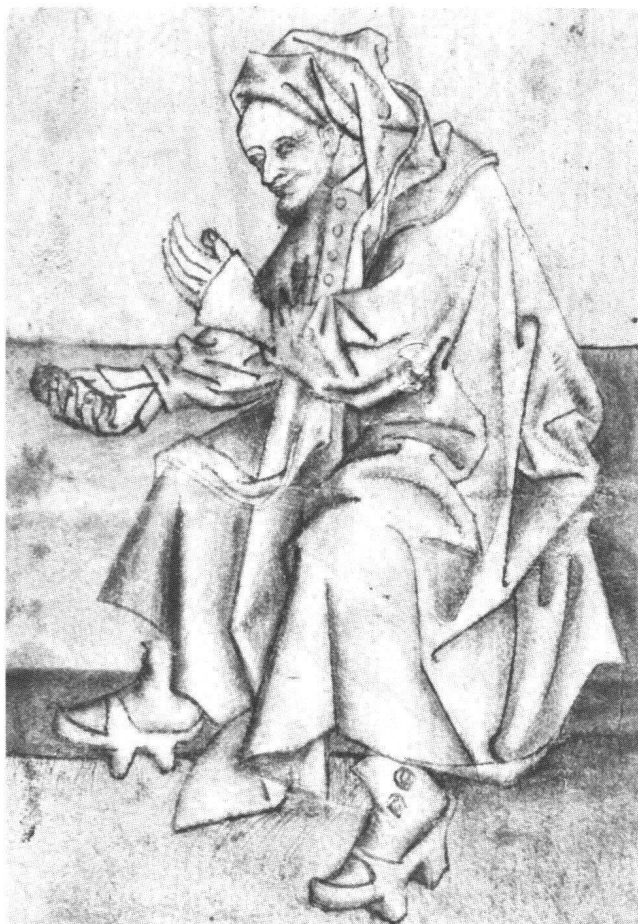
Fig. 4 Saint Joseph tendant une pomme, dessin d'après Konrad Witz. Württembergische Landesbibliothek, Stuttgart.

qu'elles furent rajoutées à un modèle witzien où ne figuraient que la Vierge à l'Enfant et saint Joseph. RÖTTGEN a montré que la Vierge venait d'une composition perdue de Witz que reflète également un dessin conservé à Erlangen (fig. 3). U. FELDGES-HENNING pense que le dessin a servi de modèle pour le tableau de Naples. Pareillement, RÖTTGEN rapprocha un dessin de Stuttgart représentant saint Joseph d'une autre œuvre d'atelier, la Madone d'Olsberg conservée à Bâle, et supposa qu'ils dérivent tous deux d'une Sainte Famille perdue, comprenant sainte Anne et la Vierge (fig. 4 et 5). La dessin de Stuttgart ne serait pas, comme le confirme U. FELDGES-HENNING, une copie du tableau de Naples, mais également un relai entre la Sainte Famille perdue et ce tableau. 9