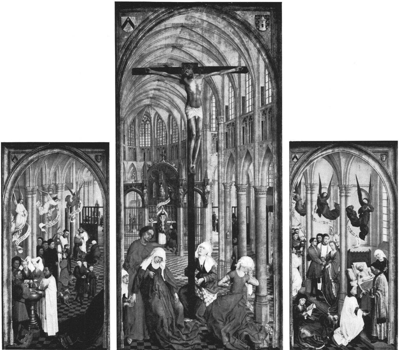
Fig. 9 Les sept sacrements, triptyque, Rogier van der Weyden. Musée royal des Beaux-Arts, Anvers.

indifférente aux valeurs de la société civile et visionnaire exaltée. Dans l'état actuel des connaissances, on se contentera donc d'observer que Witz fait écho à une agitation joséphologique dont Campin dut être le promoteur artistique et qu'une telle agitation valorise l'artisan marié aux dépens de l'Eglise, société de célibataires improductifs. 23