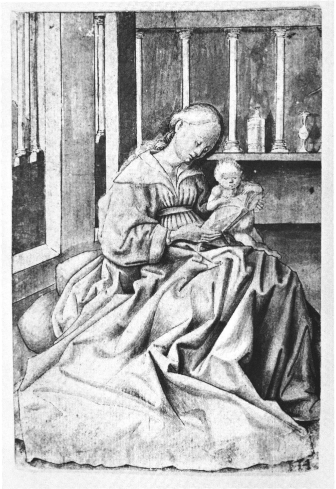
Fig. 3 Vierge lisant, dessin d'après Konrad Witz. Universitätsbibliothek, Erlangen.

Cette solution aurait l'avantage de résoudre un problème délicat qui affleure parfois dans la bibliographie de l'œuvre. Comme le panneau ne présente pas de fond doré et que les fonds architecturés sont plutôt utilisés par Witz pour l'extérieur des retables, on a cru le plus souvent qu'il s'agissait d'un revers, malgré le caractère somptueux du coloris et la méticulosité de la touche. C'est entre autres le cas de M. BARRUCAND, pour qui «ce tableau semble avoir été la face extérieure du volet gauche d'un retable perdu». 4 Mais elle note ensuite, à plus juste titre, que «Konrad Witz réussit ici à trouver une synthèse entre la somptuosité un peu barbare des faces intérieures et l'harmonie assourdie des faces extérieures». 5 Cette remarque prend tout son sens si l'on admet que le retable n'avait ni intérieur, ni extérieur, mais se composait simplement de trois panneaux juxtaposés non mobiles. En l'occurrence, j'ai pu examiner le revers du panneau strasbourgeois avec Roland Recht que je remercie de sa collaboration amicale et précieuse. Nous avons consta-