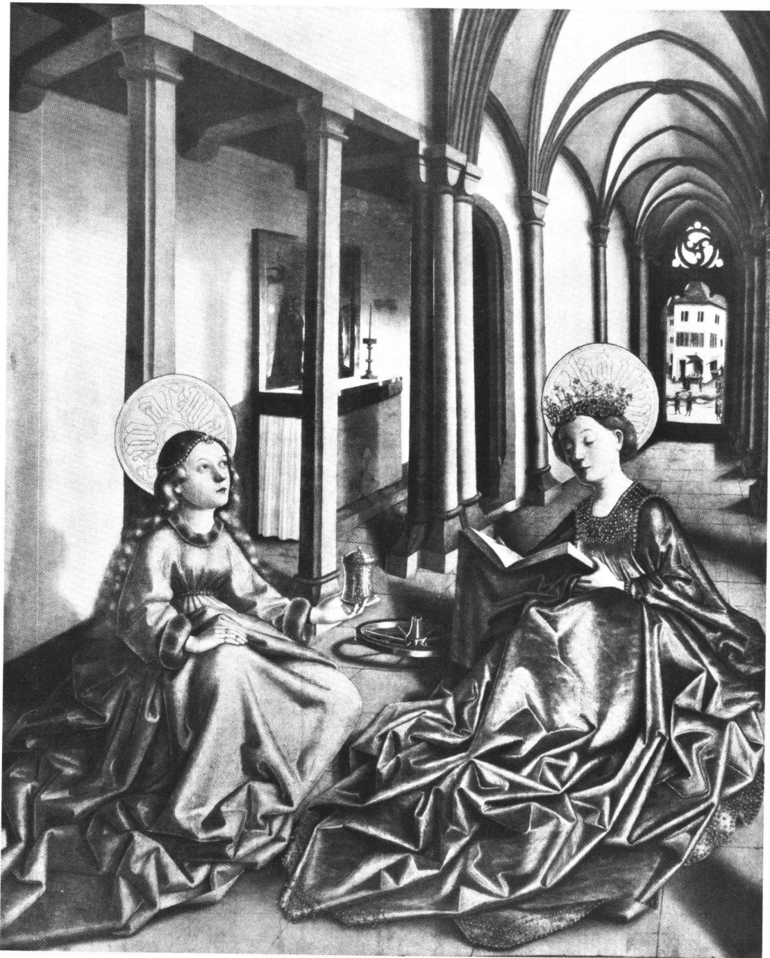
Fig. 1 Les saintes Madeleine et Catherine, Konrad Witz. Musée de l'Œuvre Notre-Dame, Strasbourg.