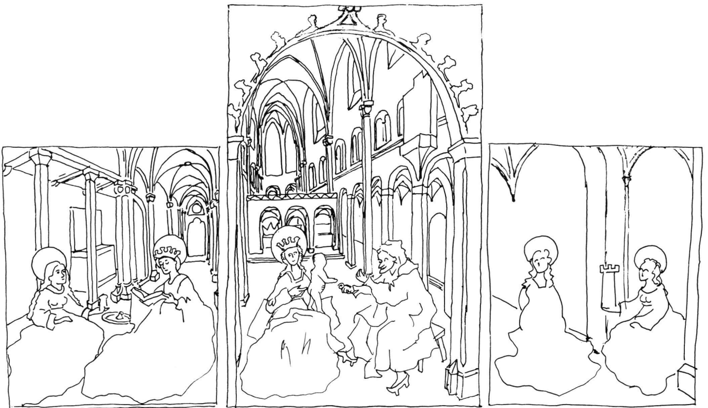
Fig. 7 La Vierge à l'Enfant entourée de saints, triptyque, Konrad Witz (reconstitution).

choisi de reproduire la partie centrale de la composition de Witz. S'il l'avait fait littéralement, il aurait transformé une sacra conversazione en sainte Famille et la position de la Vierge serait devenue un non-sens. Il reprit donc le personnage de sainte Catherine, y ajouta une sainte Barbe qui se trouvait éventuellement dans le panneau droit, et les incorpora au groupe central. En plus, il abandonna le type de la Madone d'Olsberg au profit d'un autre modèle witzien, celui de la Vierge lisant , afin de caler la composition vers le centre et d'éviter que la Vierge ne détourne le regard. Il est enfin possible que la vue de ville du tableau de Naples s'inspire librement de celle du panneau de Strasbourg.