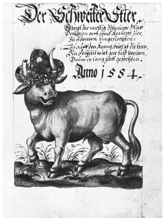
Abb. 3 Der Schweizer Stier. Miniatur, 1584, als Titellillustration zu der Handschrift: Concordia Aller 13 Orthen gemeiner loblichen Eydgenossenschaft. – Universitätsbibliothek Basel.

Was verbindet nun unsere Darstellung mit diesen Ereignissen? Im Vergleich zur Vorlage fällt auf, dass die eine der beiden als Käufer des Stiers auftretenden Gestalten deutlicher in Szene gesetzt ist. Sie schwenkt – durch die Bildmitte wird dies betont – den Geldsack in Richtung der Eidgenossen. Auch scheint sie als Gegenspieler der durch die spanische Hoftracht gekennzeichneten Rückenfigur aufzutreten. An ihrer Physiognomie, der Haartracht und dem äusseren Aufputz ist dieser Protagonist der Szene als Ludwig XIV. von Frankreich zu erkennen. Damit ist «die Verschacherung des Schweizer Stiers» auf die politische Situation der Jahre 1690/1691 hin aktualisiert, als nämlich sowohl von seiten des Hauses Habsburg, mit der Expansionspolitik Ludwigs XIV. aber vor allem Gefahr von seiten Frankreichs drohte. Allgemein wird auf die geographisch ausgesetzte Lage des Territoriums Basels und seine akute Gefährdung angespielt: So hatte Frankreich nach dem Frieden von Nymwegen der