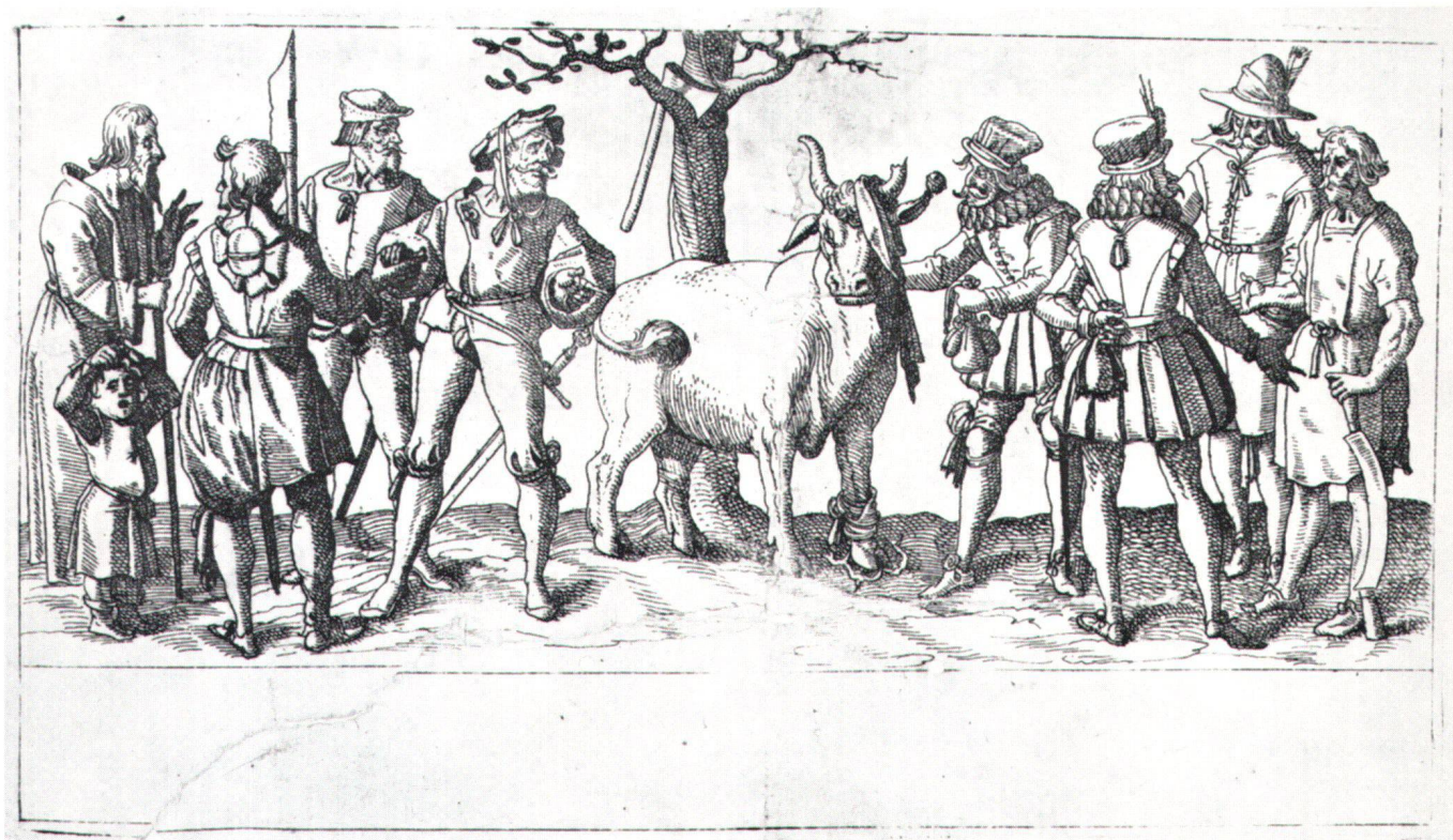
Abb. 2 Die Verschacherung des Schweizer Stiers. Kupferstich, um 1586, als Illustration zu einem Flugblatt gegen das spanische Bündnis. – Zentralbibliothek Zürich.

bereichert: es betrifft seine historische Rolle als Friedensvermittler in krisenhaften Zeiten eidgenössischer Geschichte und steht in rein profanem Zusammenhang. Nicht der eher bescheidenen künstlerischen Qualität wegen, sondern als polemischer Bildkommentar zu einschneidenden Ereignissen der Basler Stadtgeschichte des ausgehenden 17. Jahrhunderts hat es seine besondere Bedeutung. Obwohl das Bild zu den bereits 1871 ausgestellten Objekten der Basler Mittelalterlichen Sammlung gehörte, blieb diese Bedeutung bisher unbemerkt. 2