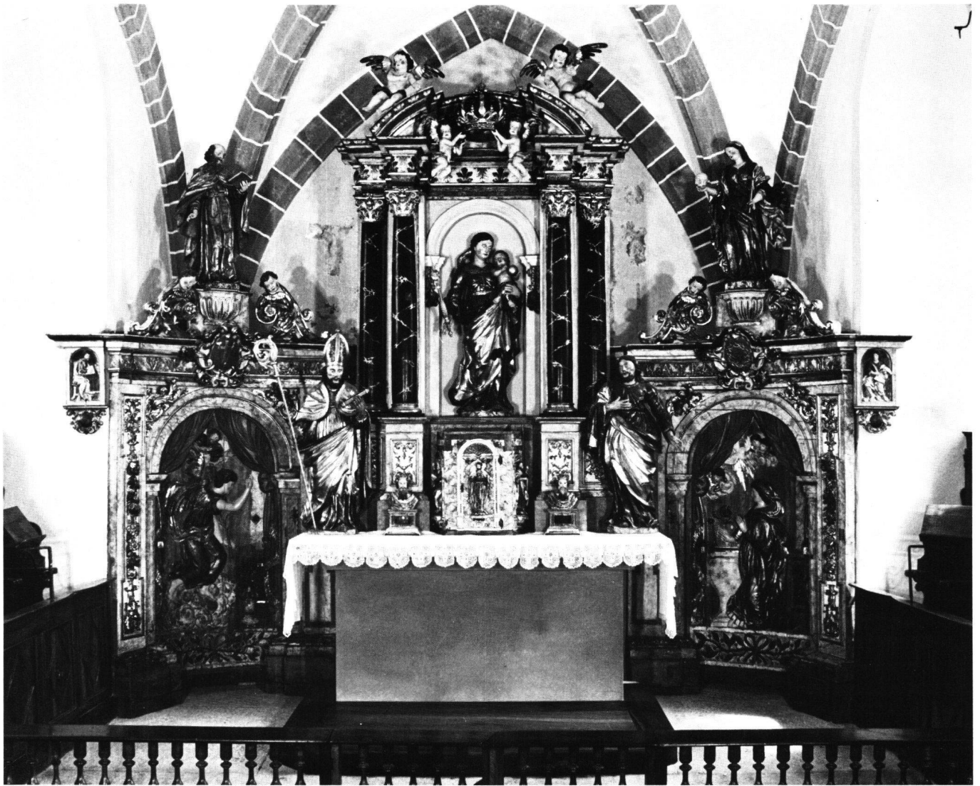
Fig. 3 Assens (VD), église mixte. Retable, fin XVII e ou 1 er quart XVIII e siècle, restauré 1982–1985.

encore laissé en ville de Fribourg, deux ans auparavant, un témoignage semblable de son art, objet d'ailleurs de jugements contradictoires. 43