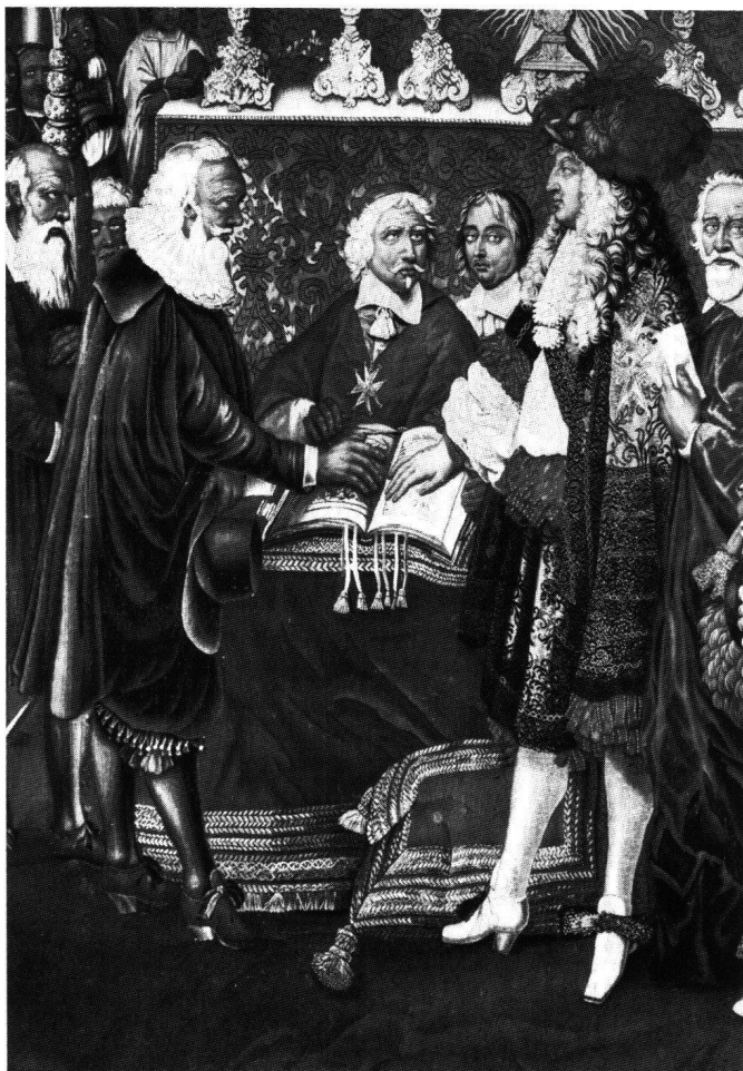
Abb. 2 Ludwig XIV. und Johann Heinrich Waser beim Ablegen des Eides. Detail (wie Abb. 1).

Wenn wir unsere Betrachtung jetzt um die historische Dimension erweitern, merken wir, dass Wasers Haltung mit dem nach vorne gebeugten barhäuptigen, bärtigen Kopf symptomatisch ist für den Verlauf der dem in der Notre-Dame zelebrierten Akt vorangegangenen und noch folgenden Verhandlungen. Die Mission hatte nicht den gewünschten Erfolg gezeitigt. Die Erneuerung des Soldbündnisses, das 1602 unter Heinrich IV. letztmals abgeschlossen worden war, brachte den Eidgenossen mehr Pflichten als Rechte. Der Widerstand und die Zurückhaltung seitens der Schweiz waren anfangs entsprechend gross. Der französische Ambassador in Solothurn, Jean de la Barde, musste deshalb 15 Jahre darauf verwenden, die Eidgenossen von der Notwendigkeit der Erneuerung des Bündnisses zu überzeugen. De la Barde schreckte nicht davor zurück, einige Politiker mit den üblichen Mitteln der Bestechung für sich zu gewinnen. Besonders dramatische