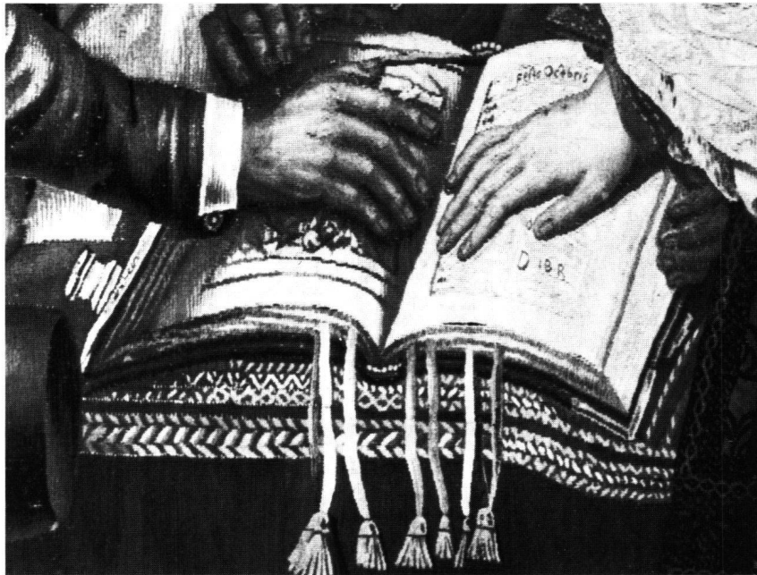
Abb. 1 Die rechte Hand von Ludwig XIV. und von Johann Heinrich Waser, Bürgermeister zu Zürich. Detail aus der Tapiserie mit Darstellung der Erneuerung des Soldbündnisses zwischen Ludwig XIV. und den Gesandten der Eidgenossenschaft in der Kathedrale Notre-Dame von Paris am 18. November 1663. Zürich, Schweizerisches Landesmuseum, Depositum der Gottfried Keller-Stiftung.

auf königliches Geblüt hin. Der Hand eigen ist ein durchaus femininer Zug. Mit Grazie und Eleganz hat der Monarch seine Hand plaziert. Unbeholfen und plump wirkt daneben die Hand Wasers. Die breite Handwurzel und die gedrunghenen Finger lassen jegliche Anmut vermissen; die Hand verfügt dafür aber über eine gewisse Expressivität. Die Braunfärbung könnte als ein Hinweis auf Wasers Alter gedeutet werden, 63 Jahre nämlich. Ludwig XIV. war im Jahre 1663 ein Jüngling von 25 Jahren. 9