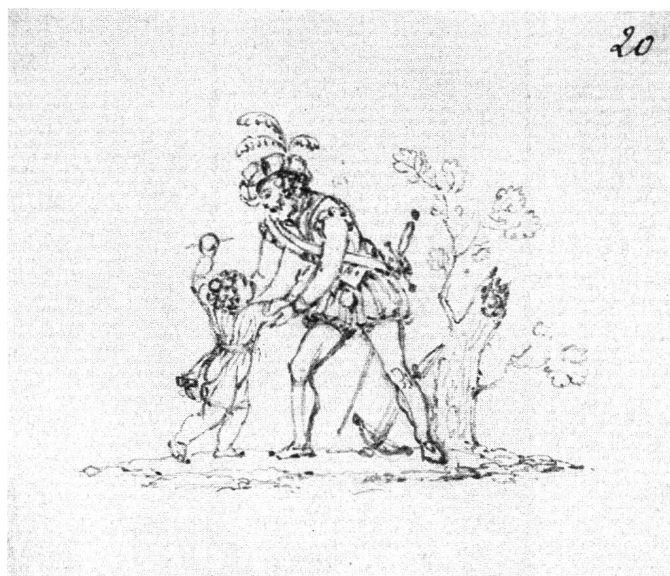
Abb.2 Tell und Knabe, von Marquard Wocher, 1798. Bleistiftzeichnung, 5,5 × 5 cm. Basel, Kupferstichkabinett.

Die Kantone und einzelnen Verwaltungsstellen liessen sich von anderen Künstlern Siegel und Briefköpfe gestalten, die sich in ihren Motiven nicht wesentlich von Wochers Entwürfen unterschieden. – Die staatlichen Organe hatten kein Geld für grosse Aufträge mit helvetischen Themen wie Denkmäler, Gemälde oder ähnliches, und private Sammler waren daran offensichtlich nicht interessiert. So konnte sich abgesehen von einer wahren Tellenflut eine helvetische Ikonographie nur bescheiden und kaum über den Bereich der