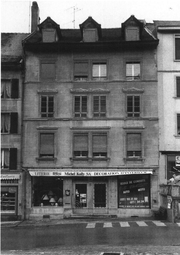
Fig. 4 Romont, Grand-Rue 34, probablement sur les plans de Joseph-Emmanuel Hochstättler, dès 1856.