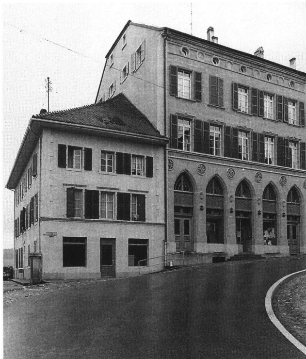
Fig. 3 Romont, rue de l'Eglise 74, le nouvel hôpital de Romont, façade réalisée d'après les plans de Johann Jakob Weibel, 1844.

L'entreprise de modernisation de la ville continuait d'ailleurs à accaparer les autorités communales. En 1852, estimant que «les reverbères, au nombre de trois, qui éclairent actuellement la ville», étaient insuffisants, 21 on s'inquiéta d'améliorer l'éclairage public. Après l'écroulement d'une voûte dans la tour de Mézières, fin 1854, on décida d'abattre cette dernière tour-porte médiévale. Il ne s'agissait que d'une étape dans l'amélioration de l'accès à la ville haute. En aval, on avait déjà entrepris la correction de la route de Mézières tandis qu'en amont, on envisageait de remplacer les pavés de la rue du Château par du macadamage. Hochstättler n'hésita pas à proposer alors la démolition de la muraille du château parallèle à la rue, au lieu de la réparer. Le Conseil communal répondit «qu'il verrait avec plaisir la démolition de ce rempart, s'il devait être remplacé par quelques travaux de nature à contribuer à l'embellissement de notre ville». 22 Le projet ne fut pas réalisé pour des raisons de sécurité, le château abritant un dépôt de pièces d'artillerie.