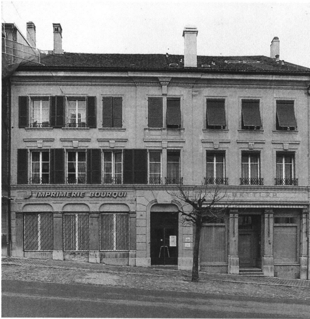
Fig. 6 Romont, rue de l'Eglise 73, plans de Joseph-Emmanuel Hochstättler, peu après 1863.