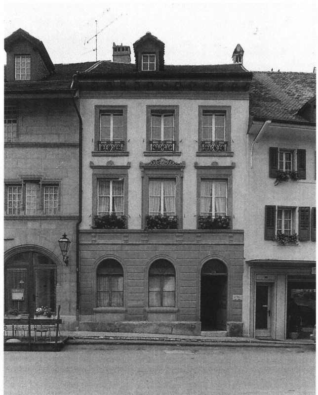
Fig. 7 Romont, rue du château 103, ancienne maison Blondel, façade dressée en 1863, attribuable à Joseph-Emmanuel Hochstättler.

sans coup férir. Comme le disait le pharmacien Ruffieux: «à la suite de l'effroyable désastre qui a désolé naguère la Ville de Romont, le Conseil communal crut devoir utiliser l'occasion de la reconstruction des maisons incendiées, au profit de l'utilité publique et de l'embellissement de la localité». 30