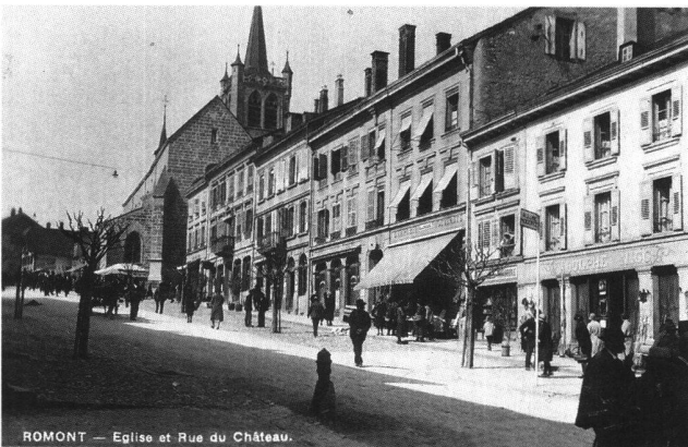
Fig. 5 Romont, rue de l'Eglise 67 à 79, plans de Joseph-Emmanuel Hochstättler, peu après 1863. D'après une carte postale du début du siècle.