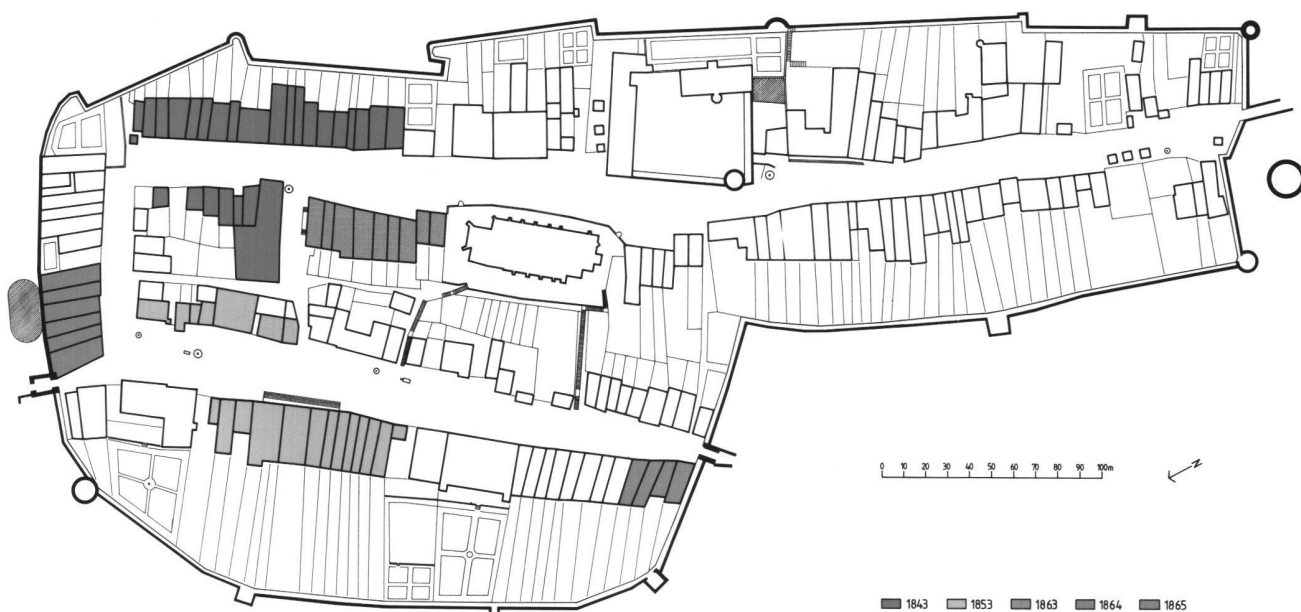
Fig. 1 Les incendies de Romont au XIX e siècle.

Entre 1843 et 1865, cinq incendies anéantissent le tiers de la cité, détruisant presque entièrement sa partie nord-est (fig. 1). De la rue de la Boucherie, il ne restera rien, pas même l'hôpital bourgeois, déjà signalé en 1275. La Grand-Rue et la rue des Moines verront disparaître la moitié de leurs maisons. Seule la rue de la Préfecture, du château à la porte de Mézières, sera épargnée. La ville comptait cent