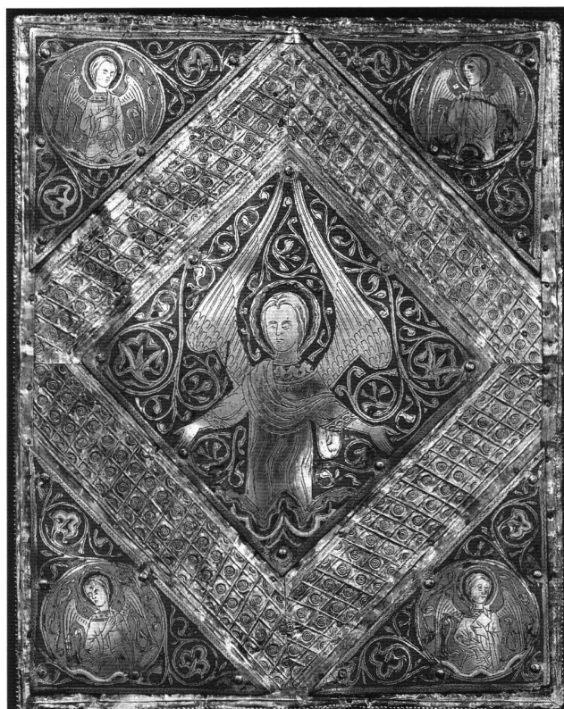
Fig. 3 Plaque exécutée vraisemblablement lors de la restauration du retable de Chartres, fin du 19 e siècle. New York, The Metropolitan Museum of Art, Inv. 17.150.809.

Il s'agit d'une armoire à gables ouvrant sur le pignon de façade par deux volets. Tandis que les parements à applique sont taillés dans une seule plaque de cuivre, les quatre faces internes des flancs et du toit étaient parées chacune d'un groupe de plaques où un losange est cantonné de quatre triangles. De ces quatre losanges et seize triangles, plusieurs ont été renouvelés au cours du 19 e siècle. Sur la sole se trouvent des anges en buste (fig. 4). Si