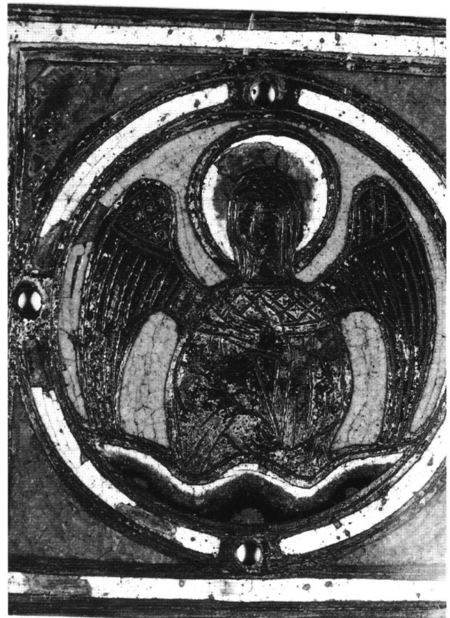
Fig. 5 Pastiche conservé à Urbana, University of Illinois.

En 1896, on mit au jour un ensemble d'objets limousins du 13 e siècle enfouis à Cherves-en-Angoumois. Parmi ceux-ci se trouvait le tabernacle de 1225–1235, acquis par J. Pierpont Morgan (Metropolitan Museum of Art), publié en 1897 et déposé pour restauration. 54 Il a également certainement intéressé les faussaires qui ont pu s'en inspirer. La