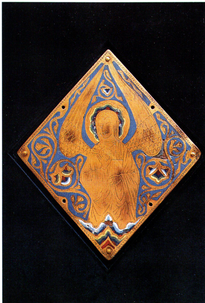
Fig. 1 Plaque d'émail sur cuivre champlévé représentant un ange (215 mm × 190 mm; épaisseur: 3 mm). Dernier tiers du 19 e siècle (?). Collection privée.

Les deux pièces inédites qui font l'objet de cette étude ont été acquises à Rome par le même collectionneur, chez deux marchands différents et à une année d'intervalle. 1 Il s'agit, dans les deux cas, d'émail champlévé sur cuivre.