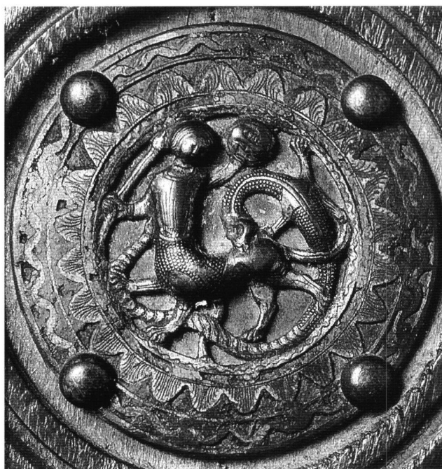
Fig. 6 Un des médaillons de Biella (San Sebastiano), 13 e siècle.

Cette rhétorique est bien dans l'esprit limousin, mais trahit un modernisme incontestable. Les références sont, si l'on ne considère pas les bordure émaillées, les médaillons ornant le coffre du cardinal Guala Bicchieri (†1227), conservé dans une collection privée. 57 Le motif décoratif