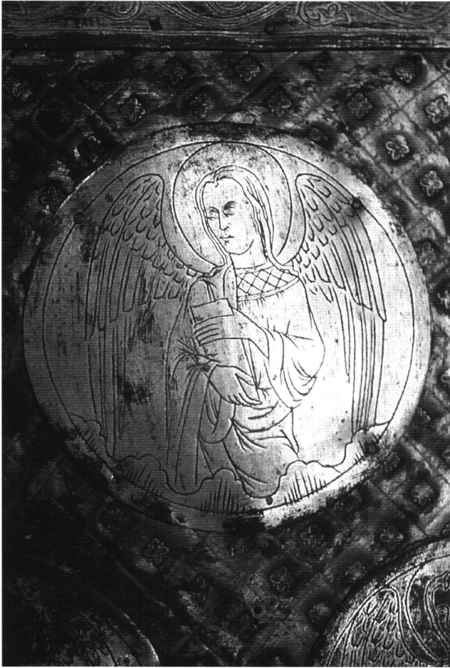
Fig. 4 Anges en médaillon gravés sur la sole du retable de Chartres, 1225–1235.

Sur le tabernacle de Chartres, nous l'avons dit, on observe de nombreuses adjonctions du 19 e siècle. À l'intérieur des rampants du toit se trouvent deux plaques losangées représentant deux anges en position d'orant. Ces pièces sont d'une manufacture indubitablement moderne (fig. 3, provenant du même groupe). La relation avec notre pièce, de meilleure qualité, est plus qu'évidente: on y retrouve la même manière inhabituelle de dessiner les cheveux de l'ange. Les mensurations sont absolument identiques, et une reconstitution à l'aide d'une reproduction à l'échelle 1:1 n'a pu que confirmer une bonne intégration de cette pièce sur le retable. La pièce in situ montre une facture moderne de la gravure: le dessin de l'ange est exécuté au traitillé, et les plis de son vêtement tombent verticalement, avec une légère ondulation. Si l'on considère la couleur, on constate la présence d'un turquoise qui montre une tonalité et une brillance particulière, couleur qui se justifie par la présence d'arsenic dans l'émail, pratique courante au 19 e siècle et non médiévale et que l'on retrouve sur d'autres médaillons conservés dans des collections privées. 51 Les