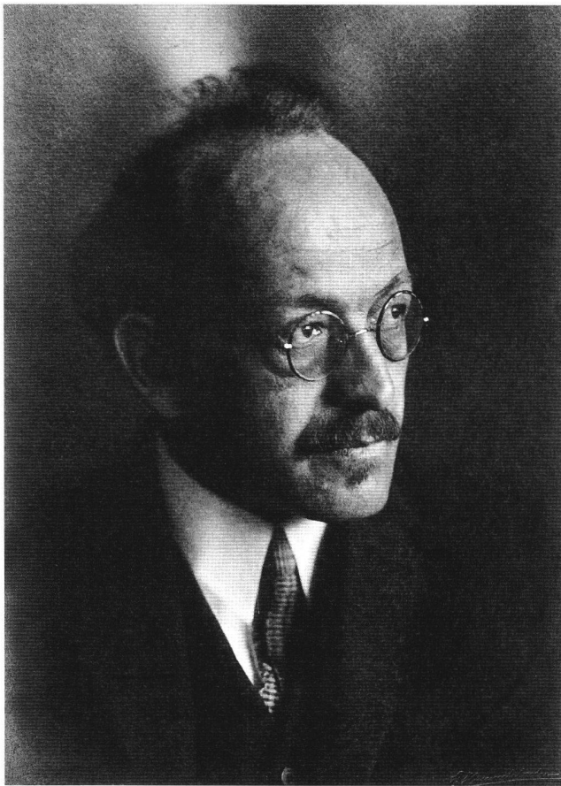
Abb. 1 Jakob Bühler in den 1920er Jahren, als er die Tragikomödie «Die Pfahlbauer» schrieb.

Am 20. März 1929 wurde am Stadttheater in Bern das Schauspiel «Die Pfahlbauer. Eine Tragikomödie in drei Akten» uraufgeführt. Autor des Stückes war der originelle, klassenkämpferische Jakob Bühler (1882–1975), der ein besonderes Gespür für die sich auf der Weltbühne anbahnenden Schrecken gehabt haben muss. 1