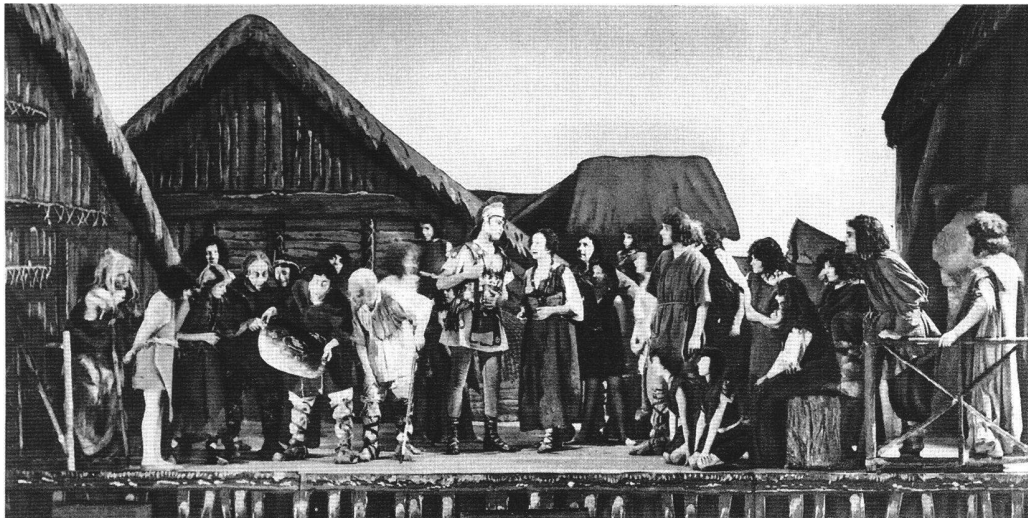
Abb. 3 «Die Pfahlbauer» in der Uraufführung von 1929 am Stadttheater in Bern, mit dem Bühnenbild von Ekkehard Kohlund (1887–1974), Photographie von Ludwig Franz-Xaver Henn (1874–1963). Die Szene zeigt Avanzan , der in voller Bronzerüstung in sein Dorf zurückkehrt. Daneben wirkt Majola wie eine behäbige Berner Bäuerin.

gegenüber, die einen strukturierten Handlungsablauf nicht aufkommen lässt. Diese Neuerung kontrastiert gerade eben mit der existentiellen Beschränktheit, der Bequemlichkeit und der geistigen Enge des Pfahlbürgers (des Spiessbürgers), der nicht über seine eigene Siedlung hinausieht und sich allem Ungewohnten und Fremden widersetzt. Nur die Angst vor dem Feind, vor materiellem Verlust bringt etwas Bewegung in den von Feigheit,