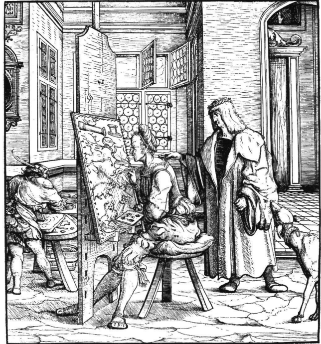
Abb. 9 Der Weisskunig besucht den Maler in der Werkstatt, von Hans Burgkmair, 1516–1518. Holzschnitt aus dem Weisskunig.

im Imperfekt. Es ist nicht mehr zu klären, wer ihm den Text vorschrieb: «H.BVRGKMAIR BINGEBAT 1505». 48 Die Signaturformel des Apelles, so wie sie Plinius überliefert, 49 ist ein wichtiges Indiz für das Interesse des Malers an dem antiken Kollegen. In jedem Fall wird ihm dies von einem Augsburger Humanisten, vielleicht Peutinger, nahegelegt