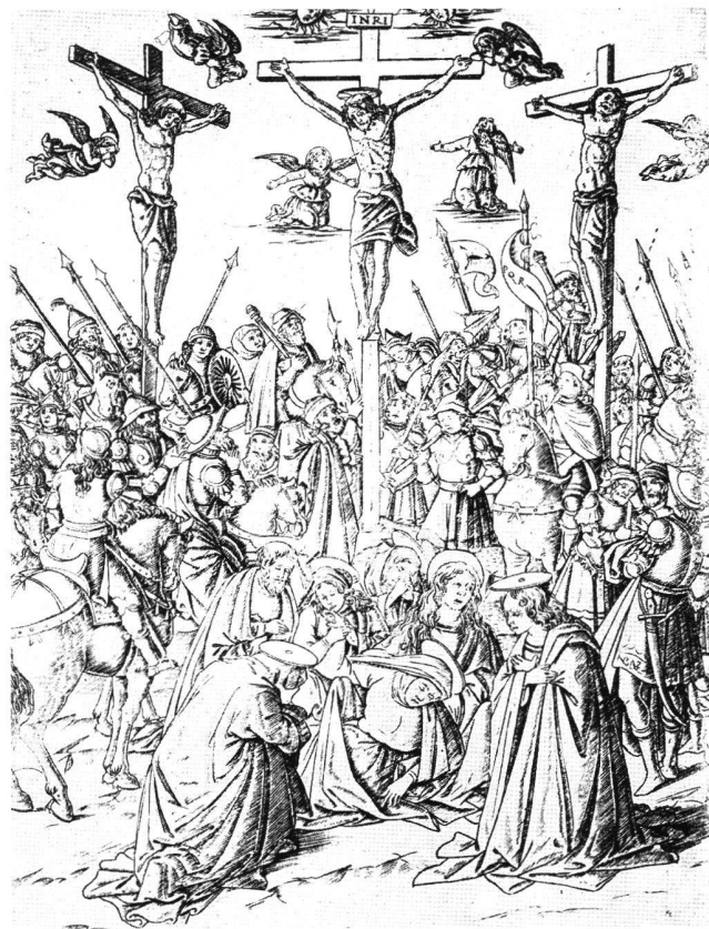
Abb. 4 Kalvarienberg, anonymer Kupferstich, Florenz, 2. Hälfte des 15. Jahrhunderts.

Nach Falks überzeugender Rekonstruktion waren Holbeins «Marienbasilika» und Burgkmairs «Hl. Kreuzbasilika» (Abb. 3) nebeneinander auf der Südwand des Kapitelsaals zu sehen. Es ist anzunehmen, dass Burgkmair daher die Aufteilung der Tafel insgesamt dem älteren Bild anglich. In der Mittelzone bietet Burgkmair unten die Aus-