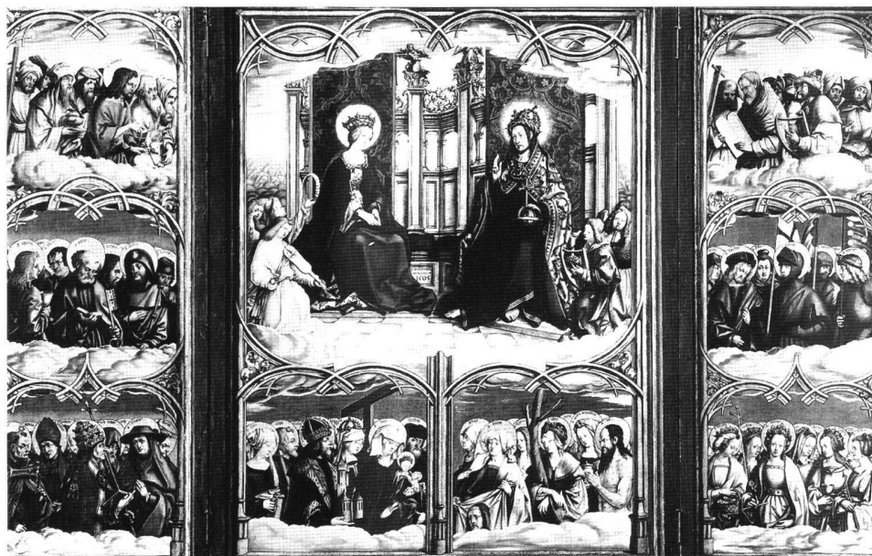
Abb. 6 Allerheiligenaltar, von Hans Burgkmair, 1507. Augsburg, Staatsgalerie.

weist in der Farbigeit auf Italien. Vielmehr werden in der reichen Verwendung von Goldauflagen, die die kostbaren Kleiderstoffe der Heiligen im Material imitieren, entweder Holbeins Experimente in derselben Richtung oder aber die frische Erfahrung der Kölner Malerei, etwa des Bartholomäusmeisters, wirksam. Für die Isokephalie der Versammlung unter dem Kreuz Christi aber und für die vier Klageengel hat sich Burgkmair die Anregungen aus Italien geholt. Beides wird ihm durch Stiche bekannt gewesen sein; die Engel sind nach dem «Kalvarienberg» eines Florentiner Stechers kopiert (Abb. 4). 27 Sie bringen in die Kreuzigung, deren Figuren insgesamt verhalten agieren,