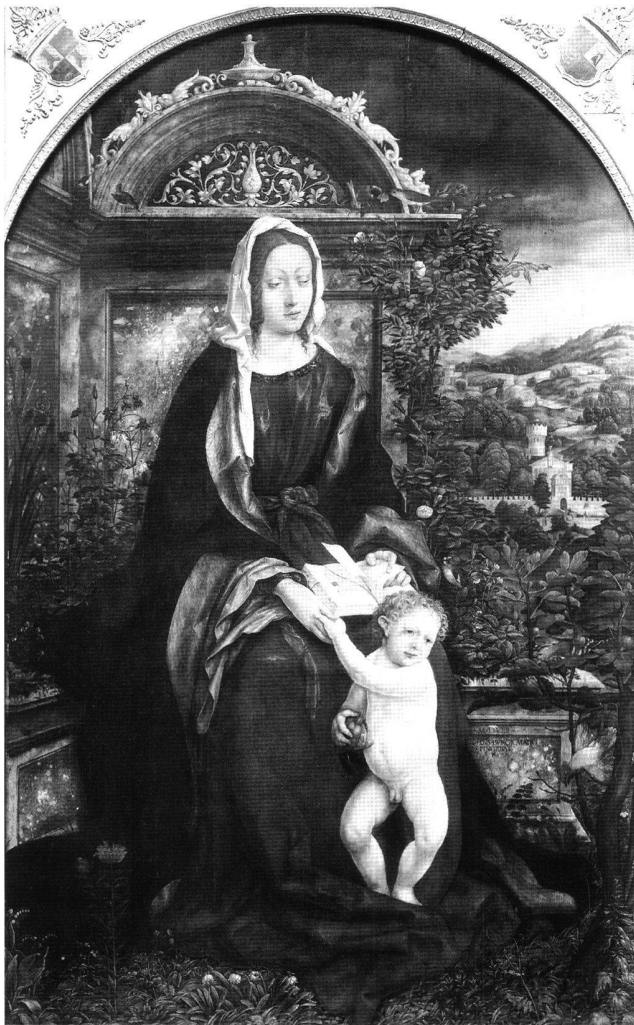
Abb. 8 Madonna im Freien, von Hans Burgkmair, 1509. Nürnberg, Germanisches Nationalmuseum.

Peutinger, dem Stadtschreiber, in Verbindung 36 , der 1508 in Wettbewerb mit dem sächsischen Hof Burgkmair mit Golddrucken zum Thema des «Hl. Georg» und dem Reiterbildnis Kaiser Maximilians experimentieren liess. 37 Burgkmair behielt Kontakte, die vor seiner Italienreise bestanden, bei, bzw. baute sie aus. Gewiss haben die Augsburger Humanisten um Peutinger das Potential erkannt,