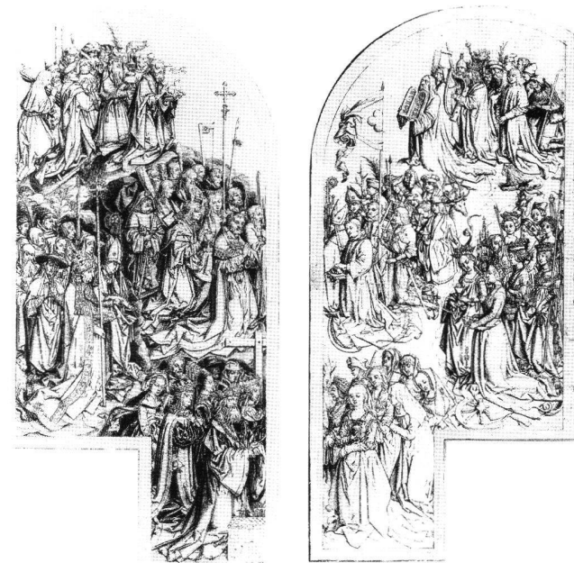
Abb. 5 Allerheiligenaltar, Vorzeichnungen, von Hans Holbein d. Ä., 1507. Linker Flügel, Frankfurt am Main, Städelsches Kunstinstitut; rechter Flügel, Leipzig, Museum der Bildenden Künste.