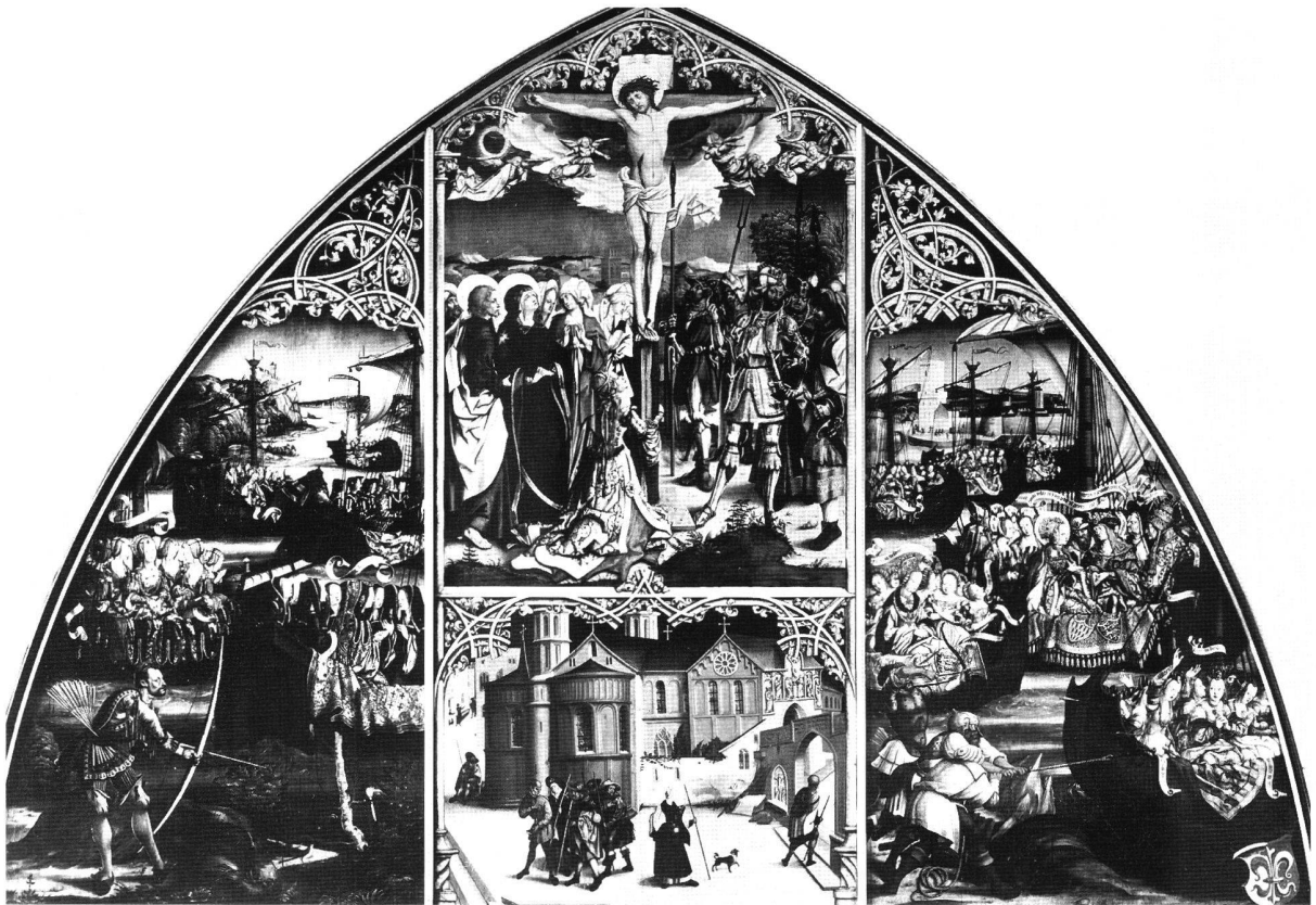
Abb. 3 Hl. Kreuzbasilika, von Hans Burgkmair, 1504. Augsburg, Staatsgalerie.

Spitze der Tafel als dornengekrönter König erscheint, also Zeugnis und so Bezeugter, anschaulich aufeinander bezogen. Dazwischen wird Platz freigehalten für das Lehr- und Predigtamt des Heiligen. In gezieltem Anachronismus predigt Paulus in seiner inschriftlich so bezeichneten Basilika, unter seinem eigenen Standbild, vor einem durch rundbogige Doppeltafeln als jüdisch gegebenen Altar. Holbeins Tafel ist die einzige aus der Serie, auf der die römische Basilika nicht als Ziel zeitgenössischer Pilger wiedergegeben ist. Das Bild der Kirche bindet Holbein in den Lebensweg des Apostels ein. Die vierzehn Stationen dieses Lebens werden in der Verteilung auf die drei Bildfelder zu einer Vergegenwärtigung aller, insbesondere aber der römischen Gnadenstätten, die der stationären, auf das Augsburger Kloster beschränkten Pilgerfahrt in der Anschauung zugänglich gemacht werden.