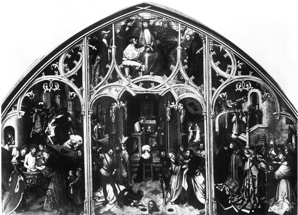
Abb. 1 Paulsbasilika, von Hans Holbein d. Ä., 1504. Augsburg, Staatsgalerie.

wesentlich dazu beitrug, das Ornament und das Kolorit der oberitalienischen, vornehmlich der venezianischen Malerei in Augsburg populär zu machen. Holbein dagegen steht als ein Kolorist eigener Art da, der zeitlebens den alten Niederländern verpflichtet blieb. Ich möchte hier die Differenzen zwischen den Malern in der Bandbreite ihrer Arbeiten und in der Wahl der Vorbilder, damit einer verschiedenen stilistischen Ausprägung, nicht nur auf den Zufall der Biographie und der Generationszugehörigkeit zurückführen. Vielmehr bemühten sich die Maler ganz bewusst um Verschiedenheit, nicht nur in den stilistischen Eigenschaften ihrer Malerei, sondern auch im Verständnis ihrer Rolle 4 als Maler.