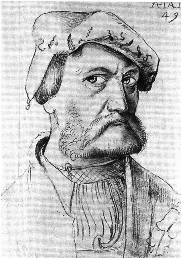
Abb. 3 Selbstbildnis, von Hans Baldung Grien, 1534. Kohle auf Papier, 24,8 × 18,3 cm. Paris, Musée du Louvre.

Was nun die schriftlichen Quellen von bzw. zu Holbein betrifft, so ist bekannt, dass diese äusserst spärlich überliefert sind. Zu den wichtigsten Beiträgen zählt zweifellos eine Äusserung des Humanisten Beatus Rhenanus, der in seinen 1524 verfassten «Emendationen» die bedeutendsten Bildnismaler seiner Zeit aufzählt. Neben Dürer und Cranach führt Rhenanus hier auch «Johannes Baldung in Strassburg» an sowie «Johannes Holbein, in Augsburg geboren, aber schon lange Bürger von Basel, der unseren Erasmus im vergangenen Jahre zweimal aufs treffendste malte, Bilder, die später nach England geschickt wurden.» 18 Adressat dieser Bilder war vermutlich Thomas Morus, der einen engen Austausch mit Erasmus von Rotterdam