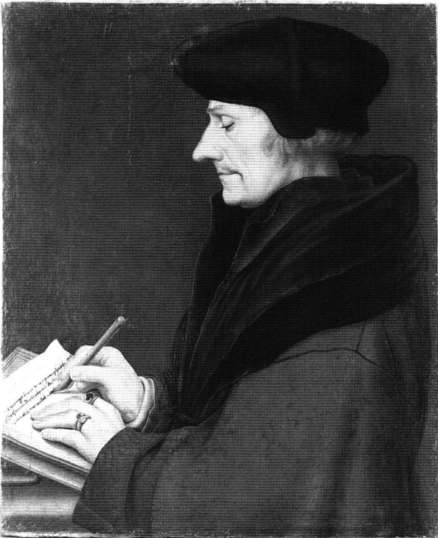
Abb. 5 Bildnis des Erasmus von Rotterdam, von Hans Holbein d. J., 1523. Tempera auf Papier auf Holz, 37,2 × 30,8 cm. Basel, Öffentliche Kunstsammlung, Kunstmuseum.

Das Morus-Porträt zeichnet sich nun durch eine extrem detailgenaue malerische Darstellung aus. Abgesehen von der Feinheit der Pelzhaare und des Bartes, deren unglaublich präzise malerische Darstellung im «Rundbildnis des Erasmus» auf die Spitze getrieben wird, fällt hier vor allem die farbige Gestaltung auf, die bei Holbeins Bildnissen