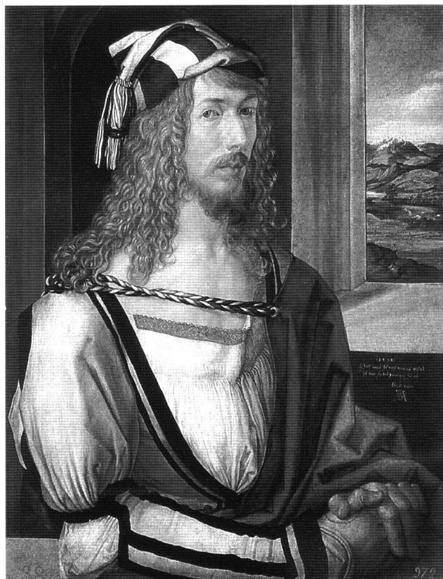
Abb. 1 Selbstbildnis, von Albrecht Dürer, 1498. Öl/Leinwand, 52 × 41 cm. Madrid, Museo del Prado.

Als ein Darstellungsmodus von zentraler Bedeutung begegnet der Rückblick in der Bildnismalerei von Hans Baldung Grien. «Grünhanssen» – wie Dürer den um 1484/85 geborenen Sohn eines Gelehrten nannte, der vermutlich zwischen 1503 und 1507 in seiner Werkstatt arbeitete – offenbart bereits in seinem auf um 1502 datierten Selbstbildnis (Abb. 2) die grundsätzliche Bedeutung des Blickes für seine Malerei. Dieses Frühwerk sei etwas eingehender betrachtet, da sich bereits bei diesem Bildnis eine