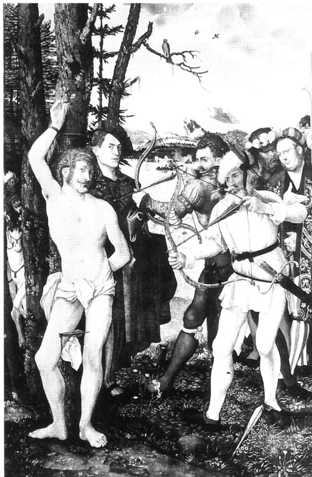
Abb. 4 Das Martyrium des heiligen Sebastian (Mitteltafel des Sebastiansaltars), von Hans Baldung Grien, 1507. Öl auf Holz, 121,5 × 79,2 cm. Nürnberg, Germanisches Nationalmuseum.

Betrachtet man die beiden sehr ähnlichen Bildnisse, die auf einem identischen groben Darstellungsschema der