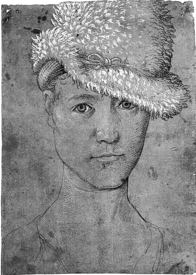
Abb. 2 Selbstbildnis, von Hans Baldung Grien, 1502. Feder und Pinsel auf blaugrün grundiertem Papier, 22 × 16 cm. Basel, Öffentliche Kunstsammlung, Kupferstichkabinett.

Nicht allein mit Rücksicht auf die asymmetrische Platzierung der Schultern scheint der Kopf nach rechts gewendet. Aufgrund dieser Drehung gewinnt das Gesicht eine körperliche Plastizität. Hierzu trägt ebenfalls die ausgeprägte Konturlinie der verschatteten rechten Gesichtshälfte bei,