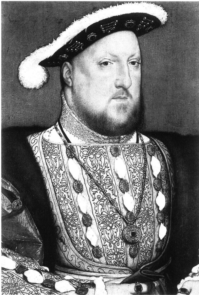
Abb. 2 Bildnis Heinrichs VIII., von Hans Holbein d. J., um 1537. Öl auf Eichenholz, 28×20 cm. Madrid, Fundación Colección Thyssen-Bornemisza.

Hofstaat und ist deshalb in drei durchgehend zu lesenden Zeilen links und rechts vom Thron zu finden: «BEATI VIRI TVI ET BEATI SERVI HI TVI QUI ASSISTVNT CORAM TE OMNITPE ET AVDIVNT SAPIENTIAM TVAM». Bis hierhin wird der Paralipomenon-Text der Vulgata-Fassung zitiert. Die Schlussworte, die unmittelbar über dem thronenden Salomo stehen, weichen jedoch leicht von dieser Bibelstelle ab. Bei Holbein exklamiert die