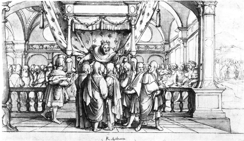
Abb. 6 Rehabeams Übermut, von Hans Holbein d.J., um 1530. Feder (braun), grau und blau laviert und aquarelliert, über Kreidevorzeichnung auf Papier, 225 × 383 mm. Basel, Öffentliche Kunstsammlung, Kupferstichkabinett, Inv.-Nr. 1662. 141.

Akzeptiert man die Möglichkeit, dass dem Text eine klare Bildaussage überlassen, die bildnerische Gestaltung