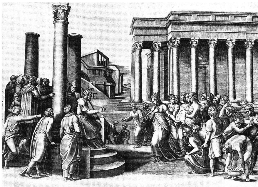
Abb. 5 Salomo und die Königin von Saba, von Marcantonio Raimondi, um 1520. Kupferstich, 401 × 565 mm. London, British Museum, B. 13.

Eine exakte Analyse der Figuresprache ist schwierig, da es keine illustrierte zeitgenössische Aufschlüsselung von Gesten gibt; doch nimmt John Bulwer den ausgestreckten kleinen Finger in sein 1644 in London publiziertes und mit zahlreichen Holzschnitten illustriertes Werk «Chirologia: Or the Natural Language of the Hand» auf. Dort erläutert er, dass es verächtlich und provozierend sei, bei geschlossener Hand mit dem kleinen Finger zu winken. 33 Das entspricht Salomos Geste natürlich nicht exakt; doch im Zusammenhang mit den weit auseinandergespreizten Beinen, einer Haltung, die Jodocus Willich 1540 als un-