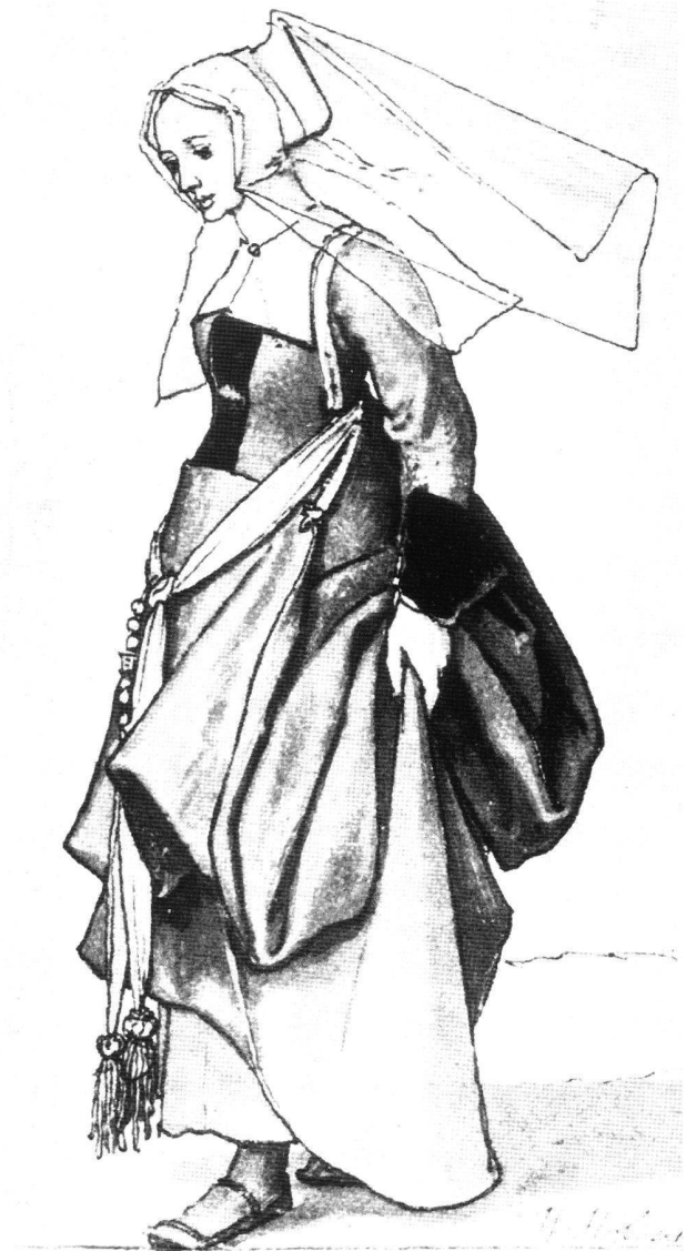
Abb. 3 Junge Engländerin, von Hans Holbein d.J. Feder in Tusche. Oxford, Ashmolean Museum.