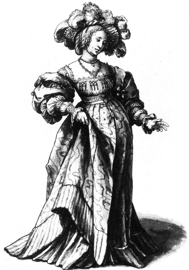
Abb. 5 Baslerin mit Straussenfederbarett, von Hans Holbein d. J. Feder in Tusche, 28,7×19,4 cm. Basel, Öffentliche Kunstsammlung, Kupferstichkabinett.