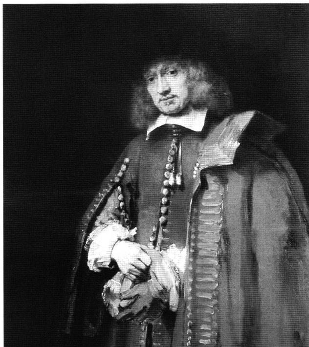
Abb. 1 Porträt des Jan Six, von Rembrandt Harmensz. van Rijn, 1654. Öl auf Leinwand, 112×102 cm. Amsterdam, Collectie Six.

fand. Als Katalognummer 18 ist dort verzeichnet «'t Vrouwtje met een Spreeuw, zynde de Minnemoer van Konink Eduard, van Holbeen» («Frau mit Star, die Amme König Edwards darstellend, von Holbein») 5 Das Gemälde wurde für den enormen Betrag von 680 Gulden von Pieter Six (1655–1703), einem Neffen des Verstorbenen erworben.