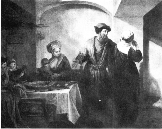
Abb. 6 Hannah, Pennina und Elkanah, von Barent Fabritius, 1655. Öl auf Leinwand, 58 × 61. Turin, Galleria Sabauda.