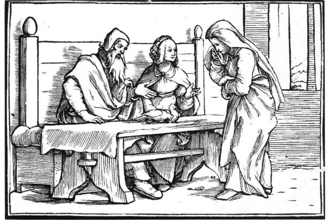
Abb. 7 Hannah, Pennina und Elkanah, nach Hans Holbein d.J., 1538. Holzschnitt aus «Historiarum Veteris Testamenti Icones». Basel, Öffentliche Kunstsammlung, Kupferstichkabinett.