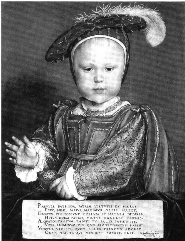
Abb. 8 Bildnis von Edward, Prince of Wales, von Hans Holbein d. J., 1538/39. Tempera auf Eichenholz, 57 × 44 cm. Washington, National Gallery of Art, Andrew W. Mellon Collection.