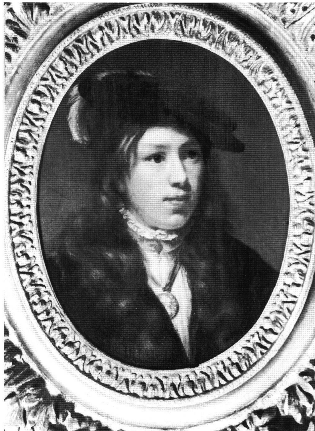
Abb. 9 Jüngling mit Barett und Kette, von Frans van Mieris d. Ä. (?). Öl auf Holz, 13×11 cm. Standort unbekannt.

Abschliessend mag man sich in diesem Zusammenhang dann auch die Frage stellen, ob Rembrandts berühmtes Selbstbildnis von 1640 in der National Gallery in London mit den üblichen Hinweisen auf Raphael und Tizian wirklich hinreichend erklärt ist, oder ob wir es hier nicht wenigstens zum Teil mit einer Hommage des Amsterdammers an seine beiden berühmten und von ihm verehrten nordalpinen Malerkollegen des 16. Jahrhunderts zu tun haben: Dürer und Holbein. 70