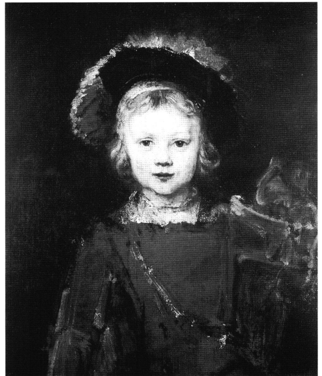
Abb. 9 Junge in Phantasiekostüm, von Rembrandt Harmensz. van Rijn. Öl auf Leinwand, 64,8 × 55,9 cm. Pasadena, Norton Simon Foundation.