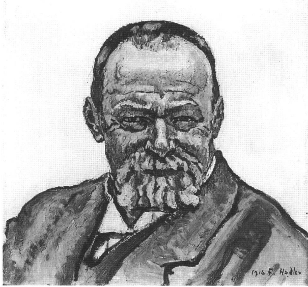
Ferdinand Hodler (Bern 1853–1918 Genf) Selbstbildnis . 1916 Öl auf Leinwand. 39 × 40,5 cm. Aargauer Kunsthaus Aarau

Hodler ist aktuell. Zahlreiche Ausstellungen im In- und Ausland sowie Höchstpreise auf Auktionen haben in jüngster Zeit den Blick der Fachwelt und des kunstinteressierten Publikums auf diesen wichtigen Pionier der Schweizer Moderne gelenkt. So wird die Realisierung eines bislang fehlenden wissenschaftlichen Werkkatalogs der Gemälde Hodlers umso dringender und sinnvoller. Das Schweizerische Institut für Kunstwissenschaft, ein von staatlicher und privater Seite unterstütztes Forschungsinstitut, erarbeitet gegenwärtig gemeinsam mit namhaften Spezialisten den Œuvrekatalog der Gemälde Hodlers und bittet deshalb alle Besitzerinnen und Besitzer von Werken dieses Künstlers um Kontaktaufnahme: Schweizerisches Institut für Kunstwissenschaft, Paul Müller, Zollikerstrasse 32, 8032 Zürich, Tel. (01) 388 51 51, Fax (01) 381 52 50 oder Institut suisse pour l'étude de l'art, Antenne Romande, Université de Lausanne, BFSH 2, 1015 Lausanne, Tel. (021) 692 30 96, Fax (021) 692 30 95, e-mail hodler@sikart.ch . Ebenso von grossem Interesse sind in diesem Zusammenhang Fotografien, Briefe und Dokumente aller Art. Diskretion ist für uns selbstverständlich.