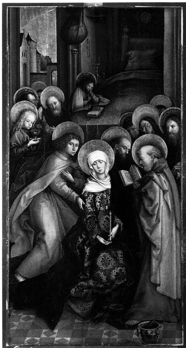
Abb. 1 Der Tod Mariae, von Hans Holbein dem Älteren, datiert 1490. Gefirnisste Tempera auf Tannenholz, 137×71 cm. Basel, Kunstmuseum.

Die Innenseiten gehörten, mit dem heute verlorenen oder unbekanntem Mittelschrein, zur Festtags-Ansicht des Altars; die Marienszenen waren also gegenüber der Grablegung Afras die vornehmeren Gemälde. Somit handelt es sich wohl nicht um die Flügel eines Afra-, sondern eher eines Marienaltars; wegen des Fehlens der Altarmitte