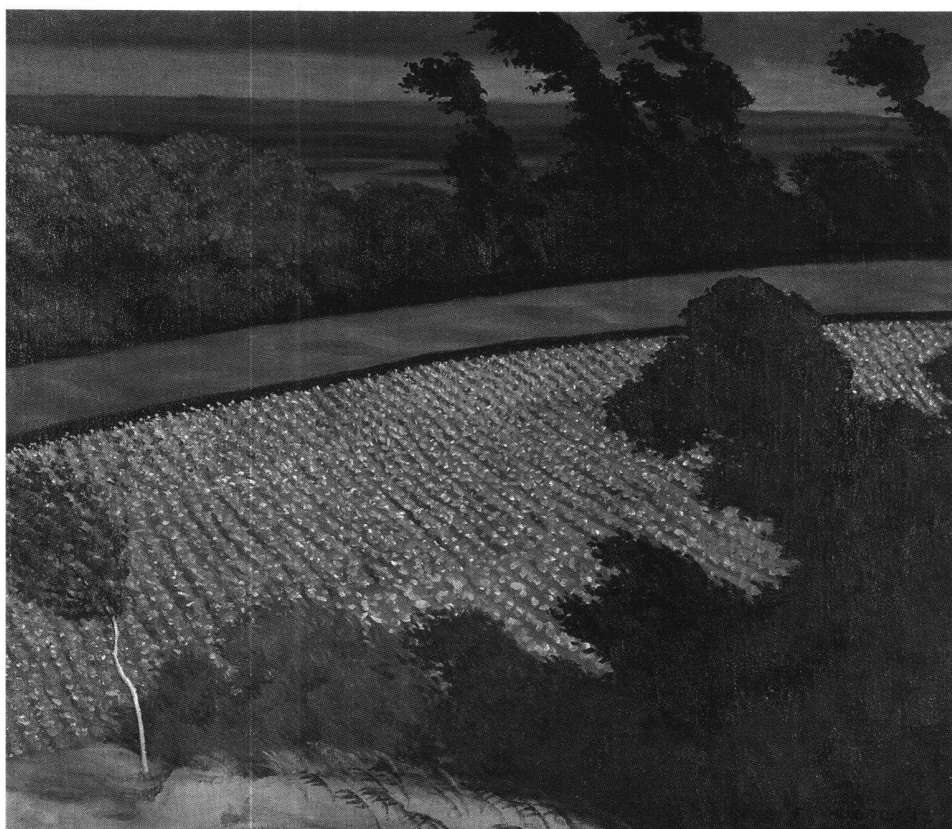
Fig. 5 Paysage breton, par Félix Vallotton, 1917. Huile sur toile, 70,4x82 cm. Suisse, collection privée, CR 1196.