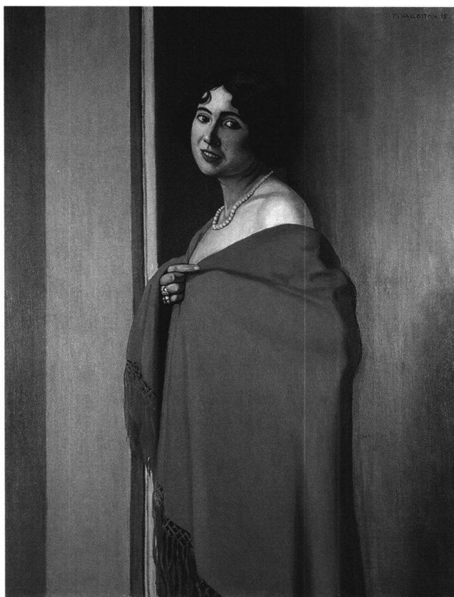
Fig. 2 Le châle rouge, par Félix Vallotton, 1915. Huile sur toile, 115 x 89 cm. Suisse, collection privée, CR 1124.

Les principales difficultés rencontrées concernent les domaines suivants: le repérage des tableaux manquants, la datation de certaines peintures, l'éclaircissement de confusions intervenues au cours des ans, l'établissement d'une liste d'expositions auxquelles Vallotton a participé de son vivant et l'identification des tableaux dans les catalogues des dites expositions.