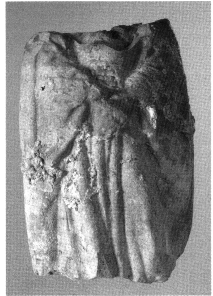
Abb. 29 Frauenstatuette. Fundort: Zug, Ägeristrasse 26, verloren oder deponiert nach 1532.