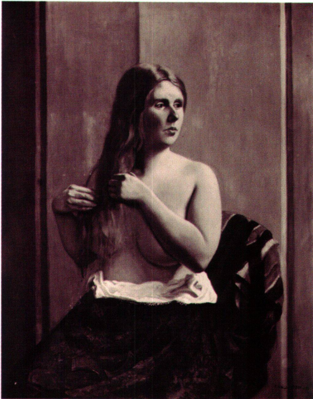
Abb. 13 La Coiffure, von Félix Vallotton, 1911, Öl auf Leinwand, 99 × 81 cm. Verbleib unbekannt.

«La Route» (Abb. 12) war nur in New York ausgestellt (Nr. 369) und wurde bereits am 12. April 1913 auf der «SS Chicago» von New York nach Paris verschifft. Das Bild, das Druet 1909 vom Künstler erworben hatte, befindet sich heute in Privatbesitz.