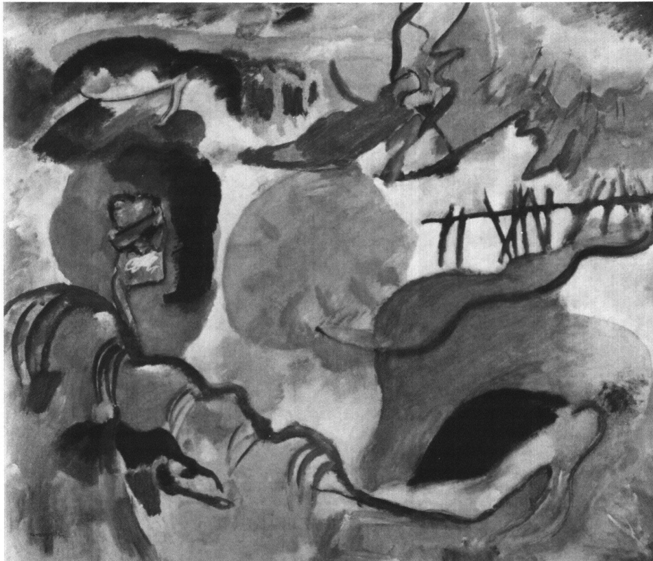
Abb. 3 Improvisation Nr. 27, von Wassily Kandinsky, 1912, Öl auf Leinwand, 120,3 × 140,3 cm. New York, Metropolitan Museum of Art.

sich in Dresden die Künstlergemeinschaft «Brücke» gebildet. Im selben Jahr formierte sich unter der Führung von Matisse eine Malergruppe, die von der Kritik «Fauves», die Wilden, genannt wurde. Henry Kahnweiler hatte 1908 erstmals in seiner Pariser Galerie Bilder in einer neuen Malweise ausgestellt, die den Namen «Kubismus» erhielt und 1912 von Albert Gleizes und Jean Metzinger in der grundlegenden Abhandlung «Du Cubisme» beschrieben wurde.