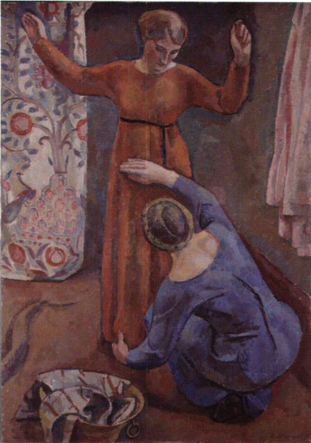
Abb. 5 Deux Amies, von Alexandre Blanchet, Öl auf Leinwand, 160 × 113 cm, 1912. Genf, Musée d'art et d'histoire, Depositum der Gottfried Keller-Stiftung.

Kuhn aus dem Jahre 1913 mit zahlreichen Fotografien von Kunstwerken verwarhte er interessanterweise eine Abbildung von Hodlers «Lied aus der Ferne», 1906 (Kunstmuseum St. Gallen), das allerdings nicht in der Armory Show ausgestellt war. Von Blanchet befand sich eine Fotografie der ausgestellten «Deux Amies» im Album, wie die Bildunterschrift aussagt, doch fehlt das Foto heute. Goltz schickte seine Anmeldung zur Ausstellung am 4. Dezember an die Organisatoren.