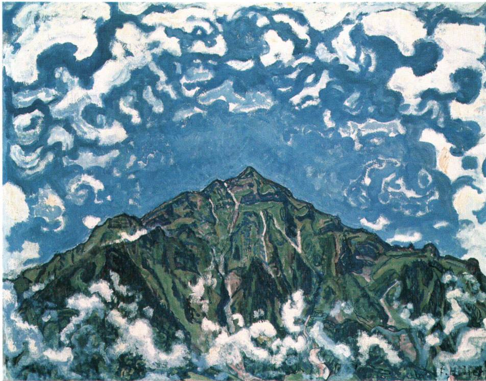
Abb. 10 Der Niesen, von Ferdinand Hodler, undatiert, Öl auf Leinwand, 83 × 103,5 cm. Basel, Kunstmuseum. Entgegen der bisherigen Meinung kann dieses Bild des Niesen, von dem Hodler zahlreiche Ansichten malte, nicht in der «Armory Show» ausgestellt gewesen sein.

Das auf dem Bilderzettel als Ölgemälde ausgewiesene Bild (Abb. 7d) wurde hier irrtümlich vom Münchner Galeristen Heinrich Thannhauser als «Der Niessen» (statt: Niesen) bezeichnet. Diese Schreibweise des Titels wurde in die Ausstellungskataloge übernommen. Thannhauser verzeichnete auf dem Zettel zudem die interne Registriernummer 1776,