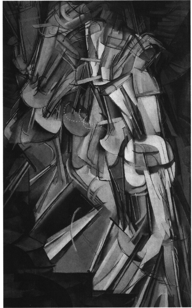
Abb. 1 Akt eine Treppe herabsteigend, von Marcel Duchamp, 1912. Öl auf Leinwand, 147,5 × 89 cm. Philadelphia, Philadelphia Museum of Art.

Von den über 300 beteiligten Künstlern war ein gutes Drittel europäischer Provenienz, darunter Vertreter der