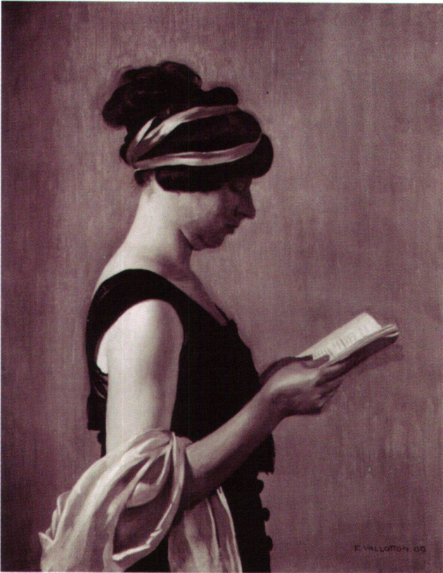
Abb. 15 Liseuse, ruban bleu, von Félix Vallotton, 1909, Öl auf Leinwand, 81 × 65 cm. Privatbesitz. Für die Teilnahme dieses Gemäldes an der «Armory Show» gibt es keinen Beweis (vgl. Abb. 14). Allerdings gehörte auch dieses Bild einer Lesenden dem Pariser Galeristen Druet.

«Wirtsgarten». Das mit «Nausikaa» vergleichbare Bild «Primavera» (Badende Mädchen) von Bechtejeff wurde 2007 in einer Auktion bei Ketterer in München für 454300 Pfund (inklusive Käuferaufgeld) versteigert. Ein von Hodler 1910 gemaltes Bild des «Niesen» erzielte Ende 2006 bei Christie's in New York gar $ 3936000, und gerade erst Anfang Juni 2007 geriet in der Zürcher Sotheby's-Auktion «Schweizer Kunst» eine Genfersee-Ansicht Hodlers von 1901 mit einem Verkaufspreis von 10912000 sfr. zum bisher teuersten Gemälde des Künstlers.