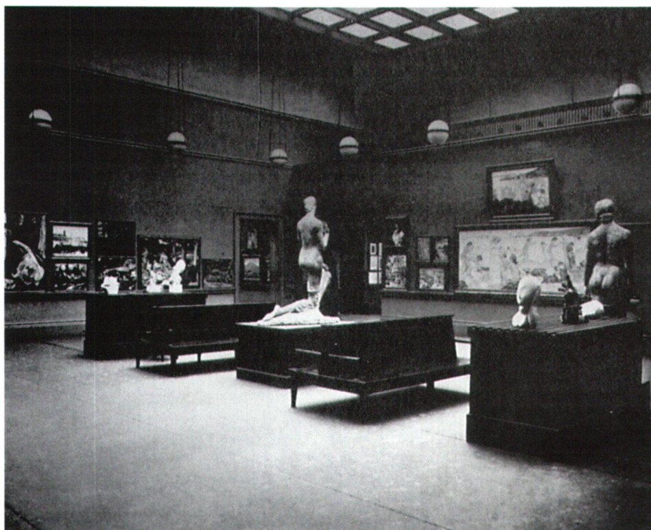
Abb. 9 Ansicht der Ausstellung im Art Institute in Chicago: die East Gallery mit Skulpturen und französischen Gemälden. Am linken Bildrand ist Alexandre Blanchets Gemälde «Deux Amies» zu erkennen.

Werkverzeichnis der Gemälde erwähnt zwar die auf der Leinwand befindliche Zahl 192 sowie die «Etiquette brune: Sculptors inc. New York», weiss aber beides nicht zu deuten und der Ausstellung von 1913 zuzuordnen. 32 Deshalb ist auch weder im Textteil noch im Ausstellungsverzeichnis Gimmis Teilnahme an der Armory Show erwähnt. 33