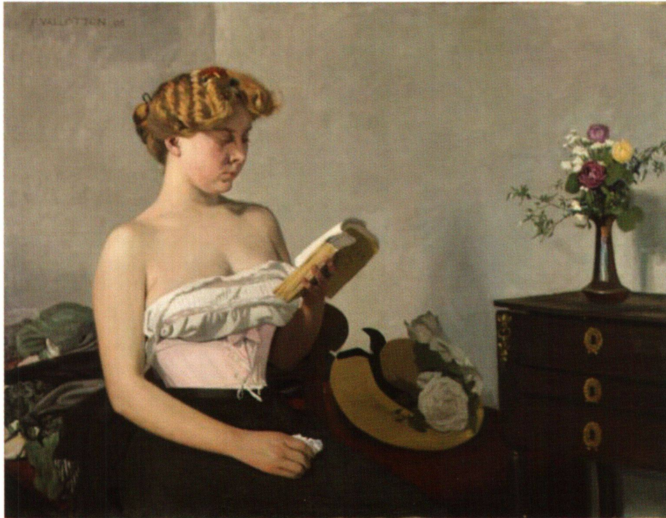
Abb. 14 La Lecture, von Félix Vallotton, 1906, Öl auf Leinwand, 90 × 116 cm. Bern, Kunstmuseum. Die Teilnahme dieses Gemäldes an der Armory Show ist nicht gesichert, jedoch wahrscheinlicher als «Liseuse, ruban bleu» (vgl. Abb. 15). Es gehörte nachweislich dem Pariser Galeristen Druet, der ein Gemälde mit dem Titel «La Lecture» in die Ausstellung sandte.

Gimmis «Musikanten» ($ 136.50) und Kirchners «Wirtsgarten» ($ 162.50) zu einem vergleichbaren Preis an und setzte Helbigs «Liegendes Mädchen» mit den geforderten $ 260 sogar noch höher an. Für Bechtejeffs «Nausikaa» ($ 812.50) verlangte er den höchsten Preis seiner eingesandten Bilder.