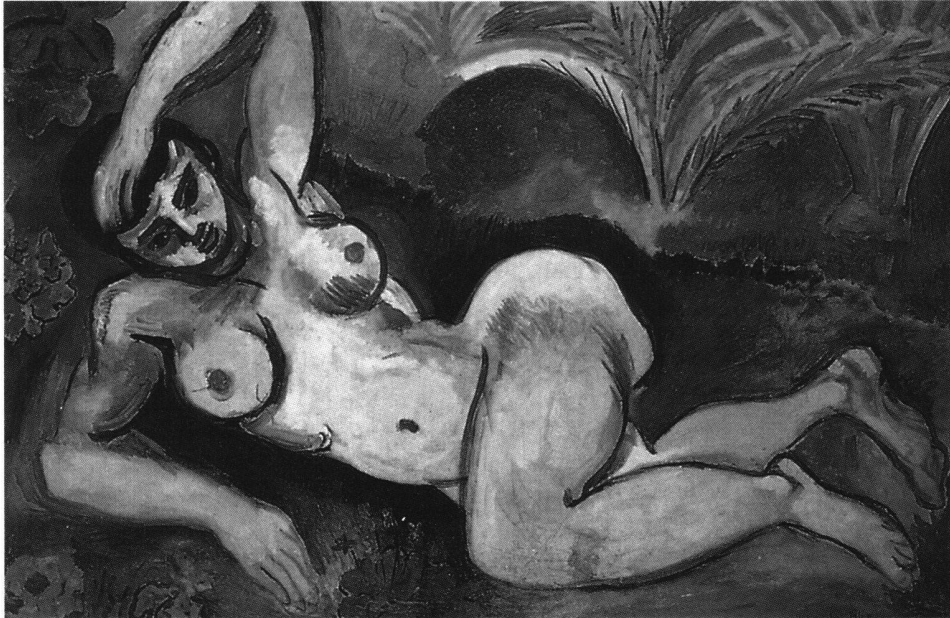
Abb. 2 Blaue Nackte, von Henri Matisse, 1907. Öl auf Leinwand, 92 × 140 cm. Baltimore, Museum of Art.

lenlage zum Nachweis ihrer Beteiligung begründet ist. Nicht einmal Blanchet erwähnte seine Teilnahme, obwohl er der einzige Künstler aus der Schweizer Gruppe war, der sein Bild in Amerika verkaufte. Der Käufer war kein geringerer als der eingangs erwähnte John Quinn, der das