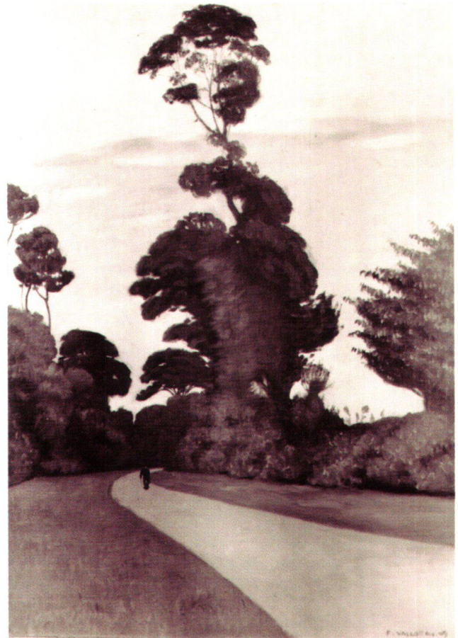
Abb. 12 La Route, von Félix Vallotton, 1909, Öl auf Leinwand, 73 × 54 cm. Privatbesitz.

unregelmässigen und bis zum Schnitt bemalten Kanten sowie an den farbfreien Bildrändern oben und unten erkennbar ist. Das Etikett, der nun bekannte Beleg einer Beteiligung an der Armory Show, ist nicht mehr vorhanden, der jetzige Keilrahmen ist offenkundig jüngeren Datums. 51