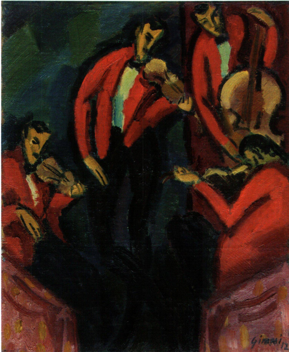
Abb. 4 Musikanten, von Wilhelm Gimmi, 1912. Öl auf Leinwand, 61 × 50 cm. Privatbesitz.

drei Bilder gezeigt wurden, die bald darauf in Amerika zu sehen waren: Gimmi stellte unter der Katalognummer 43, wie schon kurz zuvor bei Hans Goltz in München, wieder ein Werk mit dem Titel «Komposition» aus, doch war es nun die in Öl gemalte und 1912 datierte Version, der Goltz den Titel «Musikanten» gab (Abb. 4; heute in Privatbesitz). Helbig präsentierte unter der Katalognummer 57 das Gemälde «Liegendes Mädchen» (Verbleib unbekannt). Von Kandinsky war unter der Katalognummer 71 seine 1912 datierte «Improvisation Nr. 27» (Abb. 3) zu sehen, die sich heute im Metropolitan Museum of Art in New York befindet.