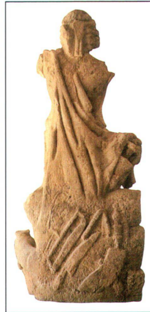
Abb. 3 Rückseite der Kalksteinstatue des Sucellus/Silvanus aus Javols/Anderitum (F). Höhe: 1,76 m.

Handwerkssymbole und Kult sind auch auf und mit bisher vor allem aus Britannien bekannten, mit Schmiedewerkzeugaufgaben versehenen Töpfen aus lokalen Produktionen vereint. 14 Während die Mehrheit dieser Einzelanfertigungen aus unspezifischen Siedlungsschichten von Wohn- und Gewerbebauten stammt, vermag der Fundkontext des Gefäßes aus Colchester/Camulodunum (Abb. 4a) präzisen Aufschluss über deren Verwendung liefern: 15 Als Teil eines