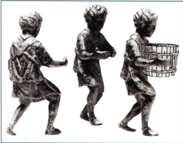
Abb. 2 Bronzestatuette aus Homburg-Schwarzenacker (D). Höhe: 9,3 cm.

die wegen der Armstellung als Fassträger interpretiert wurde (Abb. 2), zu Tage kamen. 12 Ob mit der Herstellung von Fässern oder der Produktion und dem Vertrieb von Fassinhalten zu verbinden, repräsentiert diese Statuette jedenfalls eine Berufsgattung, die – als eine Form von Selbstdarstellung interpretiert – auf einen kleineren Verein hinweist, der hier in einem privaten Hinterzimmer zu Versammlung, Kult und Festmahl zusammen gekommen war.