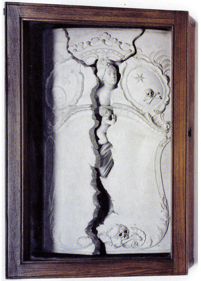
Abb.5 Die Nachbildung der Porzellanmanufaktur Nyon im originalen Schaukasten. Deckel ersetzt.

und Republik Bern von 1794: «Herrn Sonnenschein, aus Stuttgart, der jetzt in Bern wohnt, und Professor an der 1779 errichteten Kunstakademie ist [...]. Bey ihm findet man so treue als treffliche in Thon modellirte Basreliefs von dem berühmten Nahlischen Meisterstück zu Hindelbank, bey 16 Pariserzoll lang, samt dem Kästgen, zu 3 Schildlousd'or». 8 Das «Kästgen» ist ein Hinweis darauf, dass die Tonnachbildungen des Grabmals im für den Gesamteindruck wesentlichen Holzgehäuse verkauft wurden, wie es sich beim Biscuit der Porzellanmanufaktur Nyon erhalten hat. Stellvertretend für die vielen Beispiele in öffentlichem und privatem Besitz sei das Exemplar des Schweizerischen Nationalmuseums vorgestellt (Abb. 6). 9 Im Vergleich zur Vorlage verändert Sonnenschein die Proportionen: die Grabplatte ist breiter, womit der Inschriftenschild nahezu quadratisch wird und bloss noch Platz für den Ruf der Mutter und die Haller-Verse bleiben. Die Veränderung der Proportionen, die einhergeht mit einer plastischeren Gestaltung und besseren Sichtbarmachung der verstorbenen Kindsmutter, ist schon bei Mechel und den Porzellanausformungen von Nyon und Niderviller zu