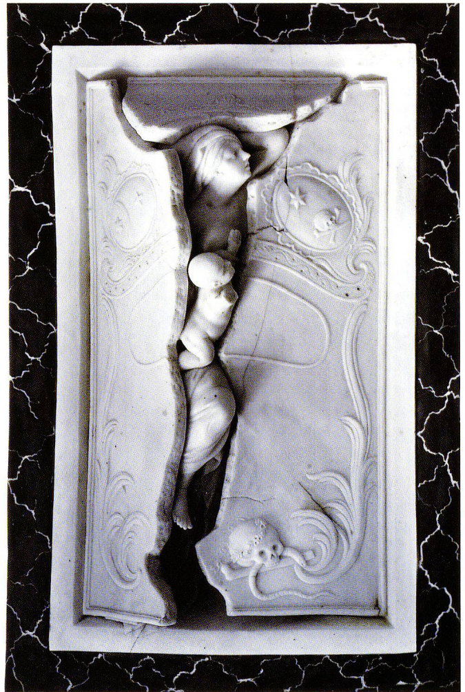
Abb.3 Nachbildung des Grabmals durch die Fayence- und Porzellanmanufaktur Niderviller, um 1800. Biscuit, 31,3 × 21 x 9,7 cm. Schweizerisches Nationalmuseum, LM 2171.

chenboden. Dass die Radierung als Vorbild diene, wird überdies an der Einfassung des schildförmigen Inschriftenfeldes auf der Grabplatte deutlich: die rocaillenartigen Riefelungen des Gesimses erscheinen als Wellenband, ein Missverständnis, das schon bei Mechel zu beobachten ist. Ebenfalls auf die 1780er Jahre, wie die Radierung Mechels, geht auch eine Nachbildung in Biscuit der Porzellanmanufaktur Nyon zurück (Abb. 4). Diese beschränkt sich auf die Grabplatte ohne Inschrift. Das erhaltene originale Holzgehäuse, dessen pultartig abgeschrägter, verglaster Deckel den Blick auf die Grabplatte freigibt, nimmt die Funktion des Rahmens im Kirchenboden wahr (Abb. 5). Die Anfertigung des Modells zu dieser ebenfalls in mehreren Exemplaren existierenden bekannten Ausformung wird dem Bildhauer Johann Valentin Sonnenschein (1749–1828) in Bern zugeschrieben, 7 was sehr wahrscheinlich ist, gehen doch zahlreiche Nachbildungen des Langhans-Grabmals in Terracotta auf Sonnenschein zurück. Johann Georg Heinzmann schreibt dazu in seiner Beschreibung der Stadt