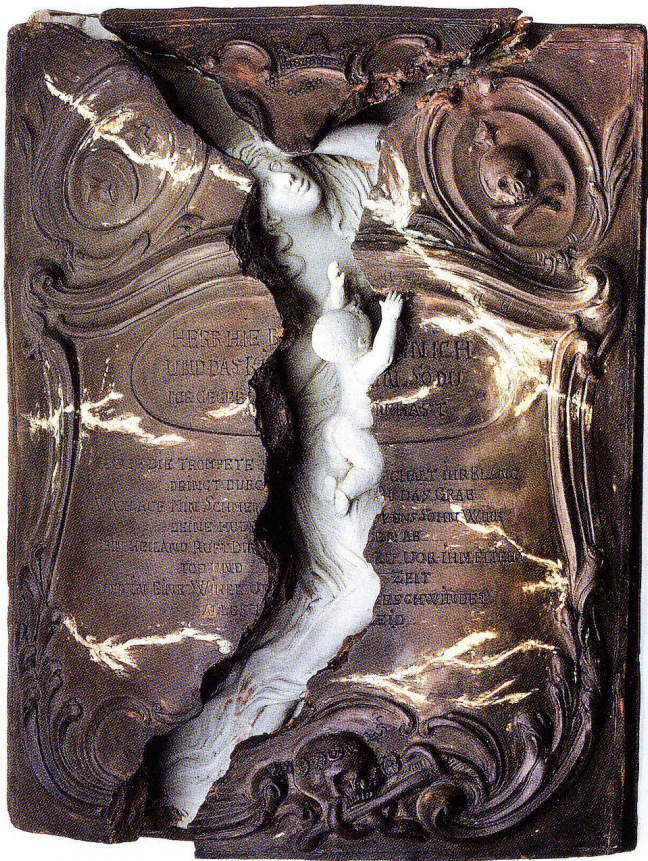
Abb.6 Die Nachbildung des Grabmals durch Johann Valentin Sonnenschein, um 1800. Terracotta bemalt, 34,5 × 25,7 × 7 cm. Schweizerisches Nationalmuseum, AG 1250.

Hintergrund der Auseinandersetzung des Klassizismus mit dem Spätbarock gesehen werden muss. In eine ähnliche Richtung zielt der Kommentar des Schaffhauser Bildhauers Alexander Trippel (1744–1793), dem die «Expression» im Kopf fehlt und die Falten im Gewand zu wenig rein und insgesamt «verwirrt» scheinen. 11