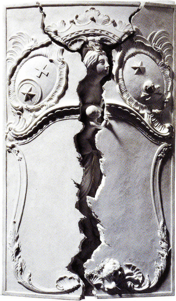
Abb.4 Nachbildung des Grabmals durch die Porzellanmanufaktur Nyon, um 1800. Biscuit, 46 × 27 × 8 cm. Schweizerisches Nationalmuseum, LM 75069.