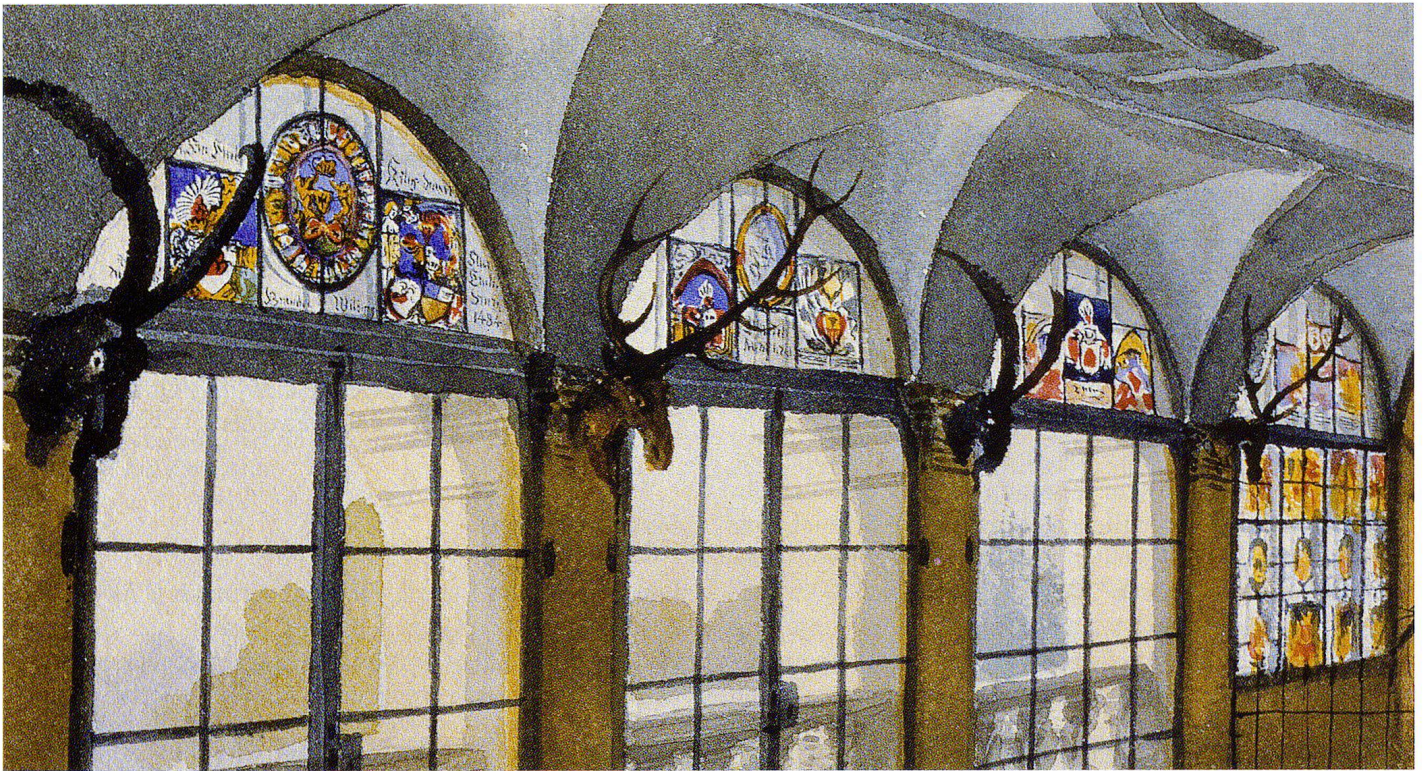
Abb.2 Detail der Eingangshalle mit Jagdtrophäen und Glasgemälden.