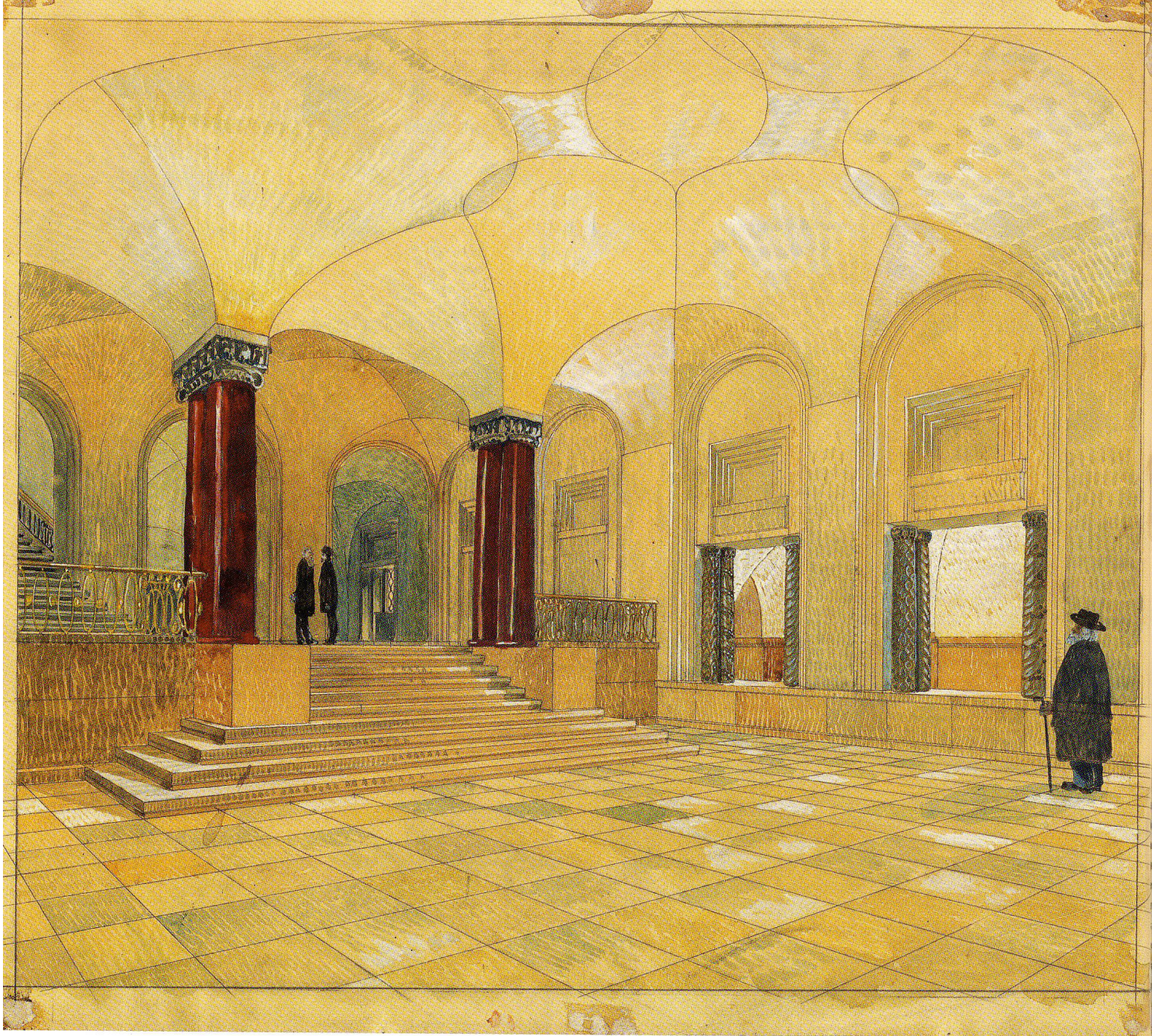
Abb. 3 Entwurfsperspektive vom Vestibül des stadtseitigen Eingangs der Universität Zürich an der Künstlergasse, von Karl Moser, um 1912. Bleistift und Gouache auf Karton.