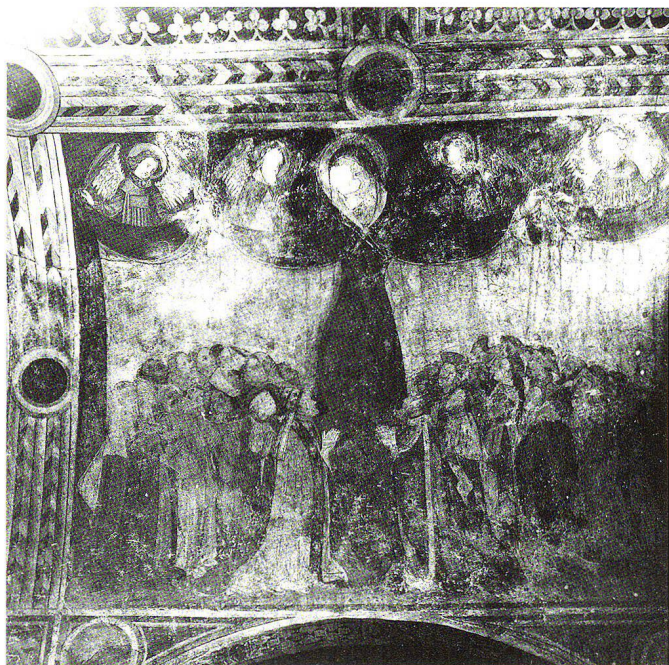
Fig. 7 Temple de Saint-Gervais à Genève, Vierge de miséricorde peinte dans la chapelle Tous-les-Saints, après la restauration de Gustave de Beaumont, photographiée après 1905 (AFMH, neg. A. 89).

Rahn. La restauration des peintures est d'abord confiée à Schmidt & Söhne; mais l'entreprise ne semble s'occuper finalement que de la consolidation des fresques, et c'est à un peintre genevois réputé, Gustave de Beaumont (1851–1922), que l'on fait alors appel pour le traitement de la couche picturale. De Beaumont avait déjà participé entre 1886 et 1888 au chantier de la chapelle des Macchabées de Saint-Pierre de Genève, où, sur la voûte, avaient été découverts plusieurs anges musiciens du XV e siècle. Les fragments médiévaux ayant cependant dû être déposés, l'intervention de Gustave de Beaumont ne constituait pas une restauration à proprement parler, mais une œuvre de création réalisée in situ sur le modèle de l'ancien décor médiéval. 24