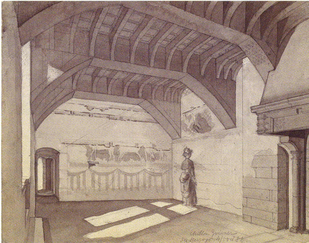
Fig.1 La Camera Domini du château de Chillon, aquarelle de Johann Rudolf Rahn, 1886 (Bibliothèque centrale de Zurich, Graphische Sammlung, Rahn XIV, 47).

avoir aucun doute sur leur tracé. Quant aux teintes, elles ne doivent être complétées que sur des surfaces plates et sans aucun relief. On ne refait que des ornements ou des motifs qui se répètent régulièrement. En dehors de cela on ne retouche que les teintes plates des fonds, des draperies et des objets d'architecture. Des retouches poussées plus loin ne sont pas admissibles. Cependant on peut se permettre des enduits incolores pour conserver et raviver les couleurs anciennes». 9