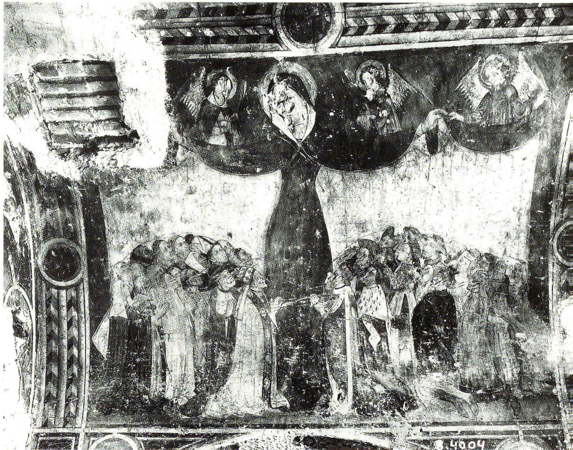
Fig.6 Temple de Saint-Gervais à Genève, Vierge de miséricorde peinte dans la chapelle Tous-les-Saints, avant la restauration de Gustave de Beaumont, photographiée avant 1904–1905 (AFMH, EAD-65006).