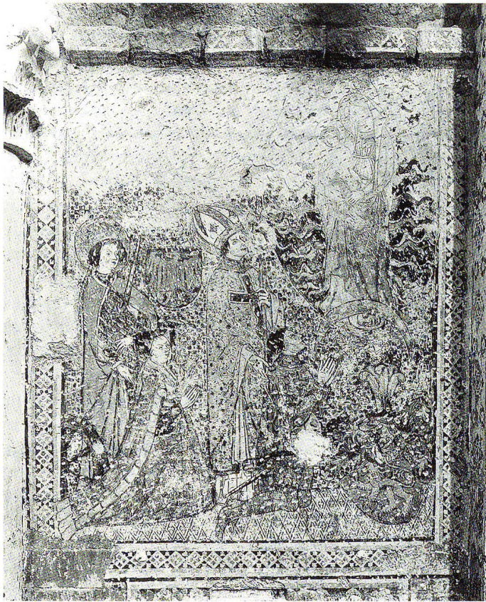
Fig. 2 Basilique de Valère à Sion, peintures de l'abside (panneau des donateurs) avant la restauration de Christian Schmidt, photographiées vers 1898–1899 (AFMH, EAD-1307).