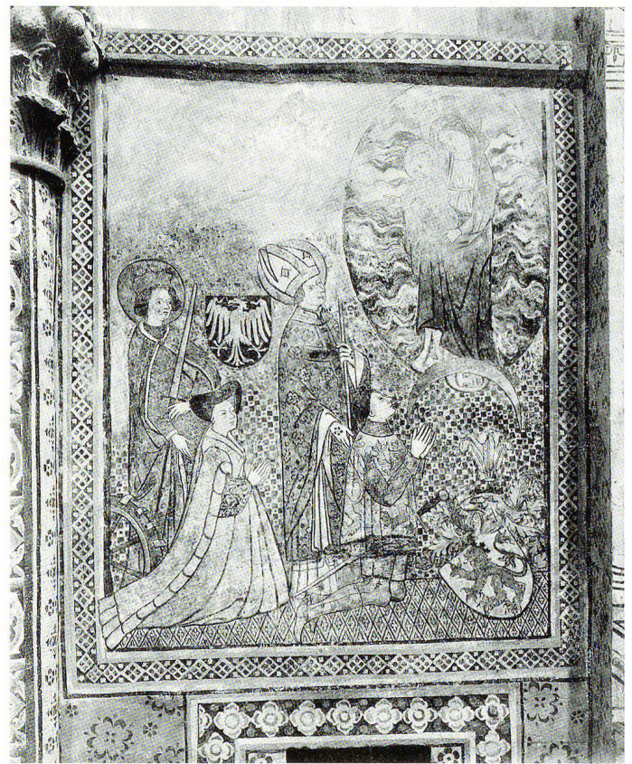
Fig. 3 Basilique de Valère à Sion, peintures de l'abside (panneau des donateurs) après la restauration de Christian Schmidt, photographiées entre 1900 et 1903 (AFMH, EAD-2193).

lutte pour surmonter les contradictions se matérialiseront une fois les premiers coups de pinceaux appliqués sur la paroi, d'autant plus quand les décors comprendront non plus seulement des motifs ornementaux 14 , mais également des figures, comme à Valère.