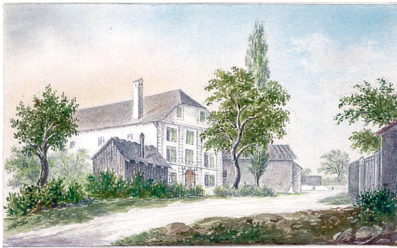
Théâtre de Voltaire à Châtelaine (Genève) maintenant, Ecole évangélique des jeunes filles