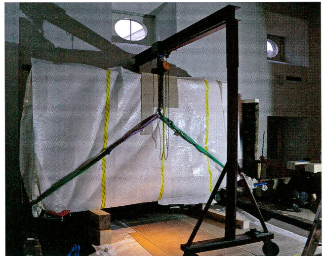
Abb.10 Kranmanöver beim Absenken von Wand D auf den untersten Balken.

Der vorliegende Blockbau ist durch die Ergänzungen und überarbeiteten Verbindungen wieder statisch stabil und selbsttragend, wodurch die Montage gemäss Konzept ausgeführt werden konnte (Abb.10). Das freistehende Wandelement C.1 wurde an eine Lattenkonstruktion montiert, welche die Wand am äusseren Ende mit der Fensterlaibung der Museumshülle verbindet. Dieser Auf-