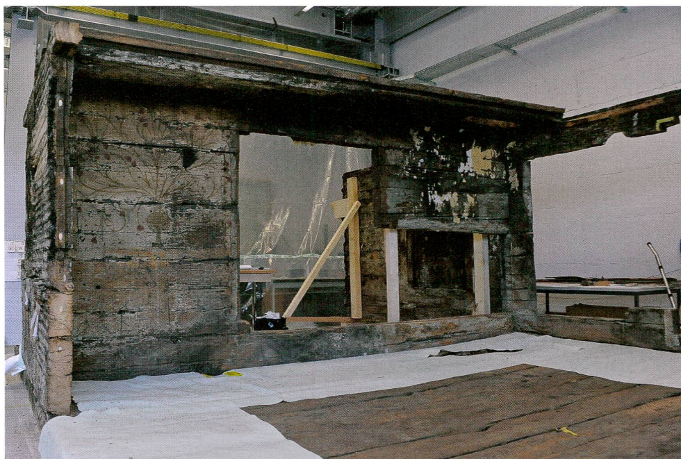
Abb. 5 Wand B mit der ersten Deckenbohle und Deckenbalken.

An der Decke erwies sich die Krümmung der Originalteile bei den vier fehlenden Deckenbalken als Herausforderung. Die ergänzten Balken mussten eine möglichst gleiche Krümmung aufweisen, ansonsten wäre an den originalen Deckenbohlen ein zu grosser Druck entstanden beziehungsweise hätten die Bauteile nicht