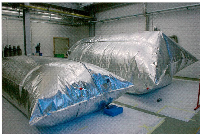
Abb. 3 Stickstoffbehandlung der Elemente in einem gasdichten Ballon. Sammlungszentrum Affoltern am Albis.

Die wohl schwierigste Frage bei all den Diskussionen um die neue Präsentation der Schwarzen Stube im Forum für Schweizer Geschichte in Schwyz war die Entscheidung, welcher bauliche Zustand aus welchem Jahrhundert gezeigt werden sollte. Die Tatsache, dass eine komplette mittelalterliche Stube gerettet werden konnte, die aufgrund der Bezeichnung «Schwarze Stube» auch grosses Interesse geweckt hatte, legte nahe, den Zustand von 1311 zu präsentieren. Doch wie sollte mit den baulichen Veränderungen umgegangen werden? Die Stube hat im Laufe der Jahrhunderte viele Umbauten erlebt, und der originale Zustand wie auch alle später vorgenommenen Veränderungen des Raumes haben durchaus ihre Berechtigung. 11 Sie sind alle als wichtige Zeugnisse vergangener Epochen zu verstehen, dokumentieren bauliche Massnahmen und Veränderungen und sind ein Spiegel der Wohnkultur über die Jahrhunderte hinweg. Um den Eindruck und die Wirkung einer mittelalterlichen Schwarzen Stube zu vermitteln, wurde schnell klar, dass nachträglich eingebrachte Fenster- und Türöffnungen geschlossen werden mussten. Hätte man die späteren Öffnungen, die aus vielen verschiedenen Zeiten stammen, in der vorgefundenen Form bestehen lassen, wäre dies aus didaktischen Gründen wenig verständlich gewesen und hätte keine klare Linie erkennen lassen. Einzig die helle Bemalung von 1530 mit ihren gut erkennbaren floralen und figurativen Motiven ist als spätere Ergänzung in grösserem Umfang noch vorhan-