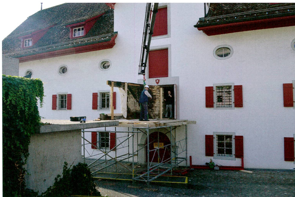
Abb.9 Einbringen des T-Elementes von Wand A/B ins Forum Schweizer Geschichte.

Die erhaltene Malschicht wurde – abgesehen von einer Trockenreinigung und den durchgeführten Festigungsmassnahmen vor dem Transport – nicht weiter bearbeitet. In diesen Bereichen wurden keine Retuschen vorgenommen, während die farbliche Anpassung der ergänzten Oberflächen erst nach Aufstellung der kompletten Stube in den Räumlichkeiten des Forums Schweizer Geschichte erfolgte. Hierbei galt es, die teilweise erheblichen Abmessungen optisch in das Gesamtbild zu integrieren, die