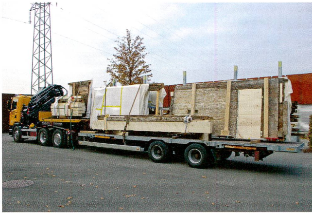
Abb.8 Abtransport der Elemente der Schwarzen Stube vom Sammlungszentrum ins Forum Schweizer Geschichte.

gung. Eine eigens aufgestellte Plattform erlaubte mithilfe eines Krans das Platzieren der vorbereiteten Elemente aussen vor der Wandöffnung. Durch die an den Wandelementen angebrachten Transportwagen konnten die Elemente in den Ausstellungsraum geschoben werden (Abb.9). Daraufhin begann die eigentliche Montage in der Dauerausstellung, die in der bereits beschriebenen Reihenfolge durchgeführt wurde.