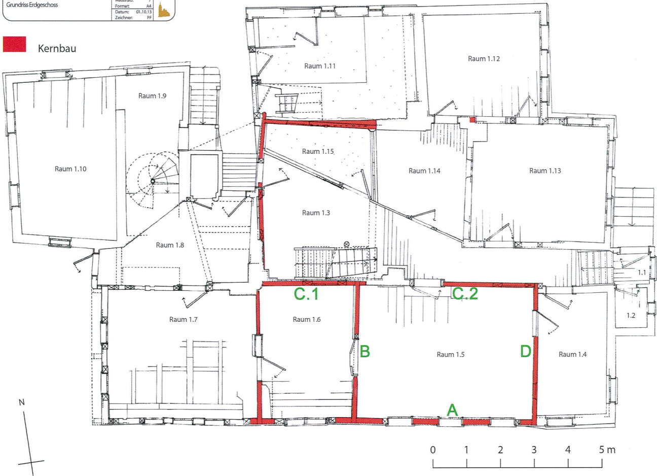
Abb. 1 Grundriss der beiden Stuben vom Haus am Gütschweg 11/13 mit den definierten Wand- und Raumbezeichnungen.