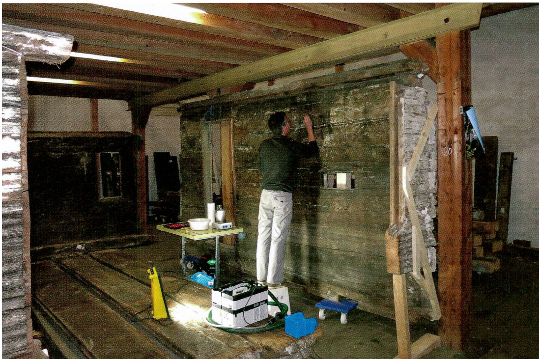
Abb. 2 Festigungsmassnahmen im Depot Arth-Goldau als Vorbereitung für den Transport ins Sammlungszentrum, 2015.