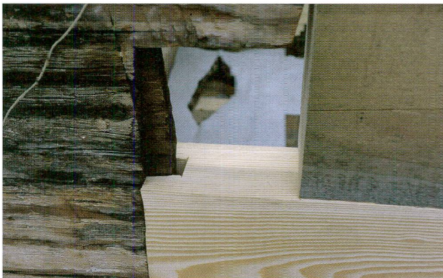
Abb. 7 Detail des Anschlusses einer Ergänzung an das Original an Wand A.

zusammengefügt werden können. Die Ergänzungsbalken wurden daher mit der entsprechenden Biegung ausgehobelt, anschliessend galt es, die Nuten, Fasen und Kopfenden einzusägen. Die Nuten wurden jeweils genau gemäss der Kontur des Bohlenbrettes eingelassen, wodurch die Differenzen zwischen Bohlenbrett und Balken von maximal 10 mm aufgenommen werden konnten. Beim ersten und beim zweiten ergänzten Balken (von Wand B aus) wurde jeweils die gegenüberliegende Nut von oben her als Falz aufgeschnitten. An dieser Stelle entstand somit das «Schloss», bei dem die letzte Deckenbohle eingelegt werden konnte. Bis zum «Schloss» hin wurden von der Wand B aus fünf Bohlen, von der Wand D