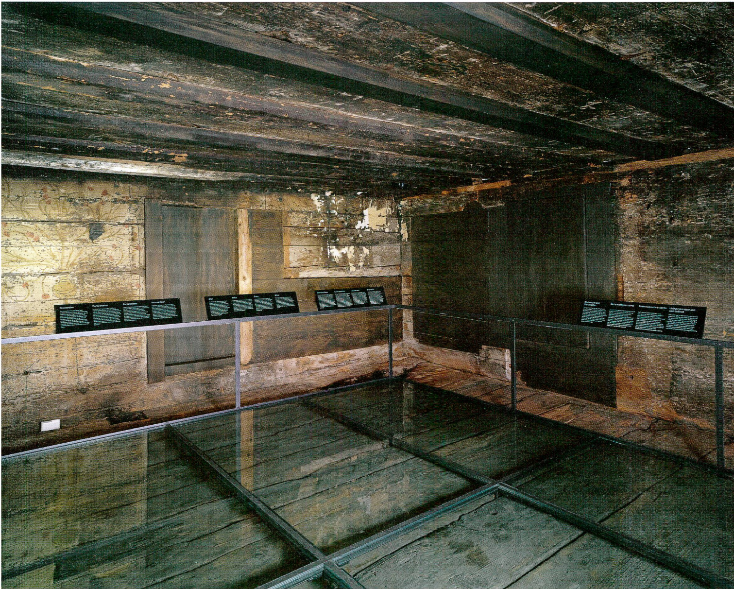
Abb. 12 Innenansicht der Schwarzen Stube im Forum Schweizer Geschichte Schwyz, 2016.

ergänzt. 19 Die Besucherinnen und Besucher können neu ein Stück Schwyzer Wohnkultur aus dem frühen 14. Jahrhundert erleben und erhalten so einen Einblick in die mittelalterliche Wohnkultur. Der Weg führt im 2. Stock der Ausstellung direkt auf die Stube zu und über eine breite Rampe in sie hinein (Abb. 11). Das Spezielle an der Schwarzen Stube ist ihre Begehbarkeit. Das Publikum steht nicht vor dem Ausstellungsobjekt, sondern mitten drin und erlebt dessen Wirkung unmittelbar (Abb. 12).