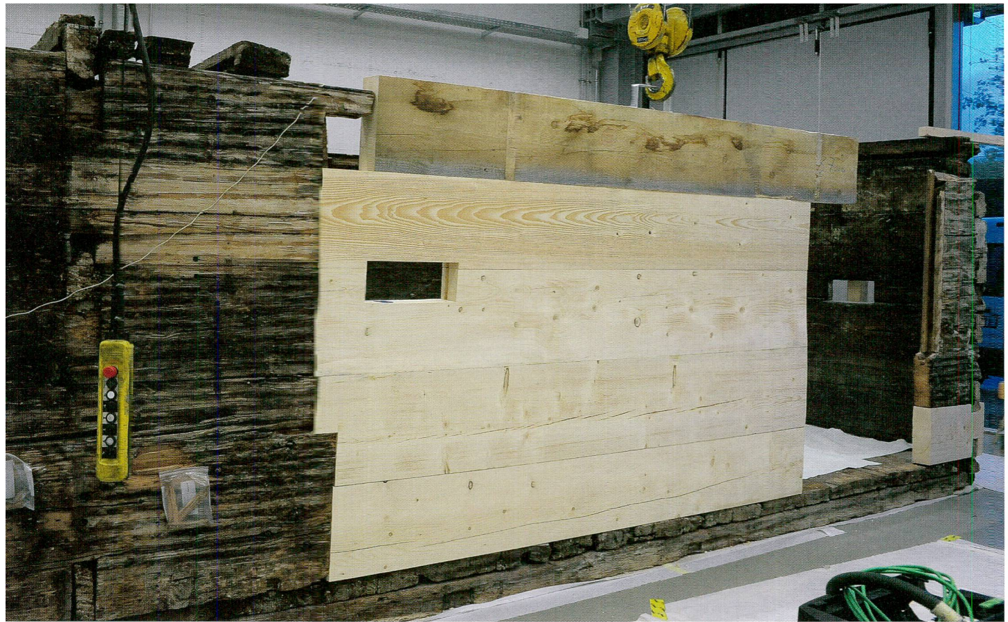
Abb. 6 Teilweise ergänzte Wand A von aussen.