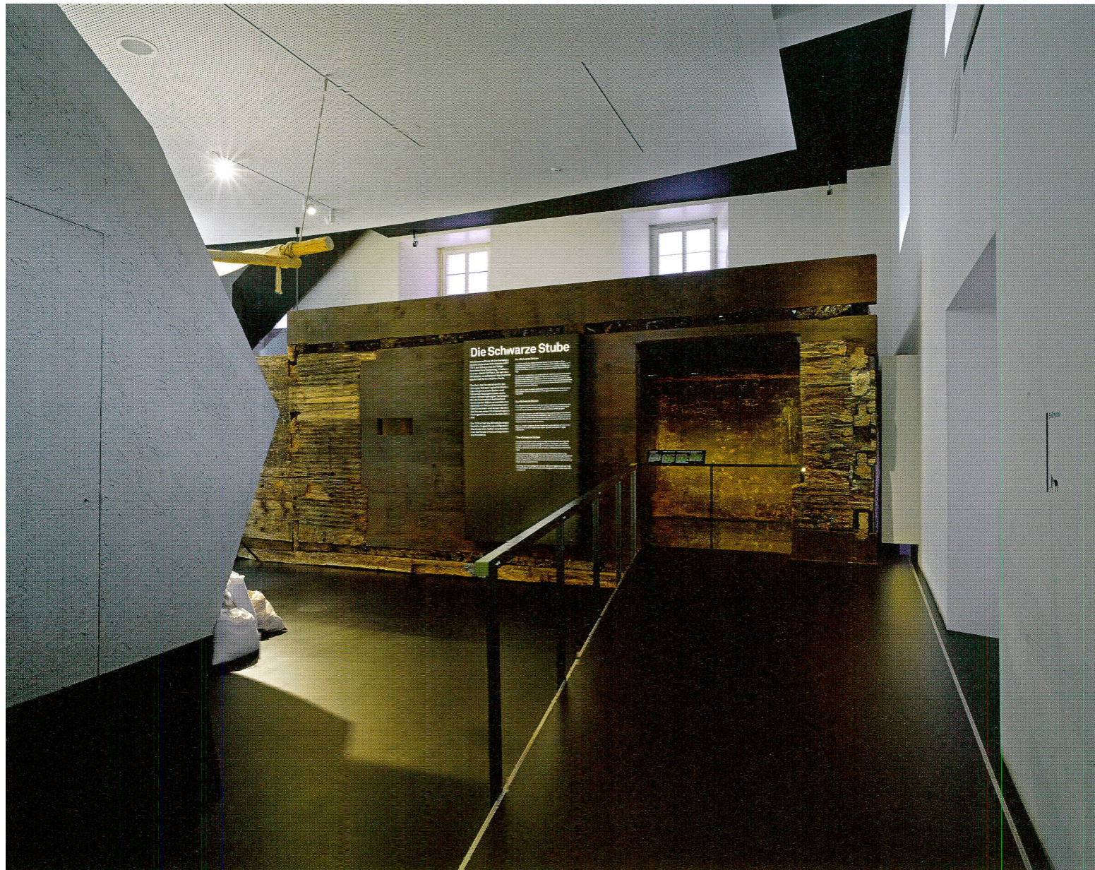
Abb. 11 Ausstellungssituation im Forum Schweizer Geschichte Schwyz, 2016.

Ergänzungen jedoch als solche klar erkennbar zu machen. Um diesen Effekt zu erzielen, wurde für jede Wand ein Farbton angemischt und flächig appliziert, wobei an den Anschlussstellen zum Original keine Anpassungen vorgenommen wurden. Dadurch konnte ein gut sichtbarer Übergang zum Original geschaffen werden. Das Gesamtbild wirkt dennoch stimmig, was durch den nicht homogenen Auftrag der Retusche begünstigt wird. Nach Anfertigung von Musterflächen mit verschiedenen Materialien erwies sich ein sehr stark pigmentierter Schellack mit reinen Erdpigmenten als die optisch und technisch überzeugendste Variante. Das Ergänzungsholz wurde in einem ersten Schritt mit einem unpigmentierten Schellack isoliert, um das Eindringen der Pigmente in das Holz zu