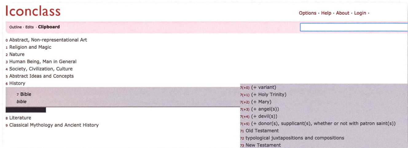
Abb. 1 Screenshot der Kategorien von Iconclass, mit Fokus auf Kategorie 7, Bible. URL: http://www.iconclass.org/rkd/7/ , abgerufen am 2. Juni 2020.

Zum gegenwärtigen Zeitpunkt führt die Frage nach den Modellen dazu, dass eine Vielzahl von Communities damit beschäftigt sind, ihre eigenen Definitionsbereiche zu entwickeln. Aufgrund der hochgradigen Spezialisie-