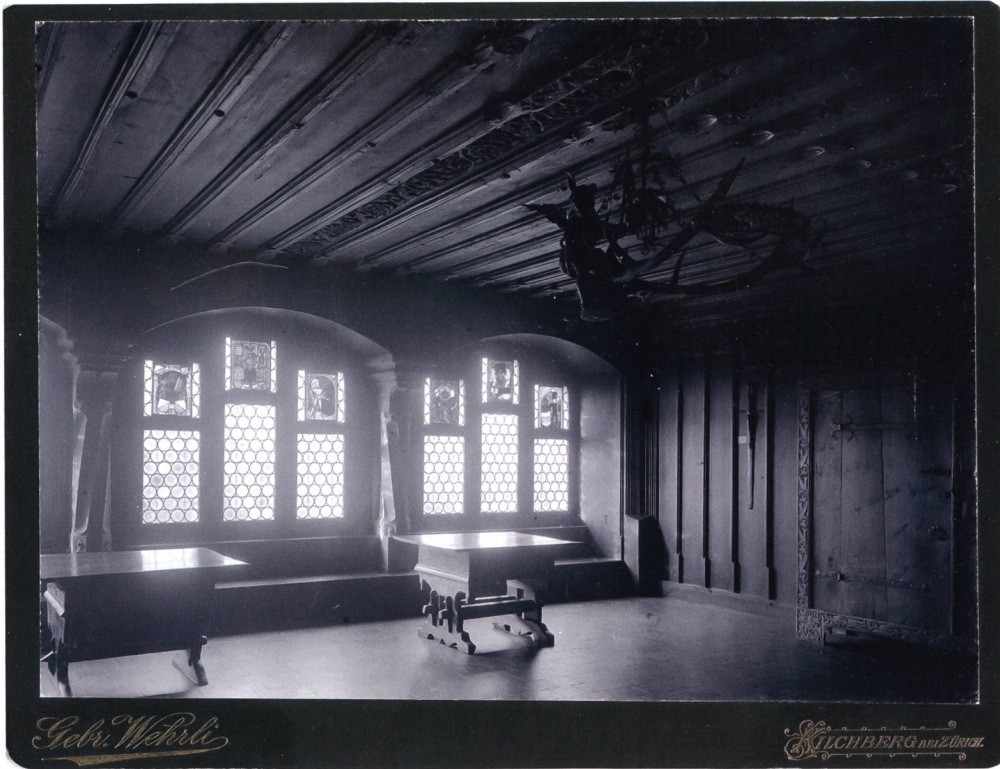
Abb. 8 Die Mellinger-Stube im Landesmuseum mit zwei Fenstern, um 1900.

19. Jahrhundert als bedeutungslos eingestuft, ihrem originalen Kontext entrissen und an Dritte veräussert worden. Im Herbst 1884 wurden die Badener Standesscheiben von Uri und Schwyz bei der Auktion Heberle in Köln aus der ehemaligen Sammlung Parpart in Schloss Hünegg bei Hilterfingen BE versteigert und konnten in der Folge in die Schweiz zurückgeführt werden. Zwei weitere Tagsetzungsscheiben gelangten 1913 aus dem Nachlass von Johann Rudolf Rahn und eine dritte 1947 aus dem Luzerner Kunsthandel an das Museum, weshalb heute fünf originale Stiftungen den Raum zieren. 16