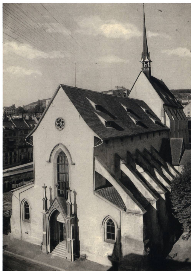
Abb. 1 Blick auf die Predigerkirche und die verbliebenen Erdgeschosssteile des Kreuzgang-Nordflügels (Arkaden mit Wäscheleine) vor dem Abbruch im November 1892.

serklosters in Zürich, konnten für das Museum gesichert und hier einer Zweitverwendung zugeführt werden. Nachdem die um 1833/34 zu einem Theater umgebaute Klosterkirche 1890 einem Brand zum Opfer gefallen war, wurden von den zwölf ausgebauten Masswerkfenstern neun für das Landesmuseum reserviert (cf. Abb. 2 und 3 Beitrag Gutbrod, S. 117), wo sie zusammen mit den Doppelsäulenarkaden aus dem Kreuzgang des Predigerklosters, der 1887 ebenfalls ein Raub der Flammen geworden war (Abb. 1), einen Kreuzgang aus historischen