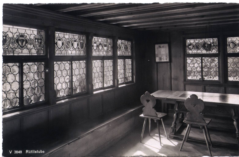
V 3848 Rütlistube