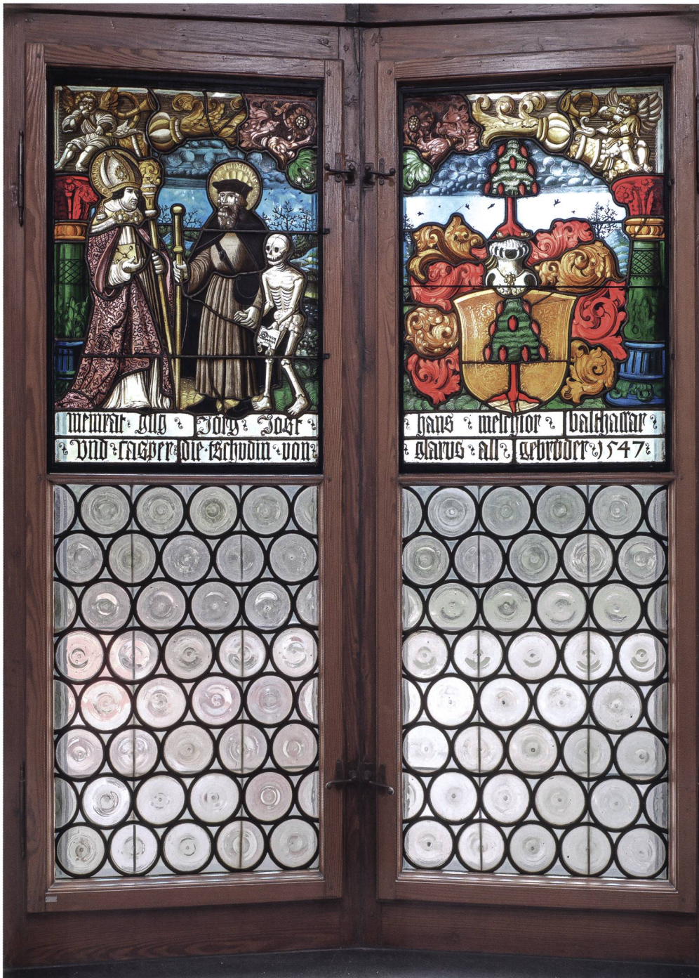
Abb. 4 Fenster im südwestlichen Treppenturm mit Doppelscheibenstiftung der Gebrüder Tschudi von 1547 in das Kloster Magdenau SG, Glasmaler unbekannt. Schweizerisches Nationalmuseum, IN 67.71/72.

Die Kommission hat in den Historischen Zimmern bewusst abwechselnd ältere Butzen- und jüngere Wabenverglasung eingesetzt, und für die Gläser wurde conse-