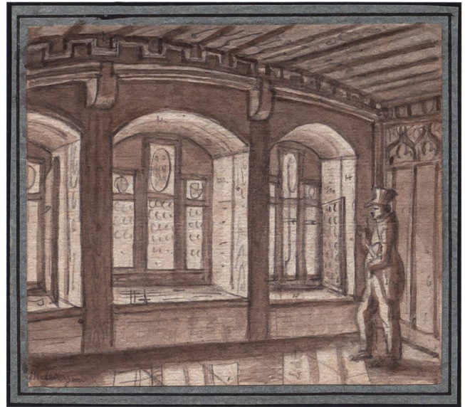
Abb. 7 Ludwig Vogel, Innenansicht der Trink- und Ratsstube in Mellingen, um 1830. Bleistift aquarelliert, 9,5 × 11,2 cm. Schweizerisches Nationalmuseum, LM 27522.

Von der unteren Kapelle gelangten die Besuchenden über eine Treppe in einen Vorraum und von diesem in die ehemalige Trink- und Ratsstube aus Mellingen. Unter den «Glasgemälden mit den Wappen des Reiches» sind die Standesscheiben mit den Wappen der alten eidgenössischen Orte und des doppelköpfigen Reichsadlers überhöht von der Reichskrone zu verstehen. Neun solche Standes- oder Kantonsscheiben zieren seit 1898 die drei Staffelfenster im Holzvertäfelten Historischen Zimmer. 1888 hatte die Eidgenossenschaft die Decke, Teile der Täfelung, Türe und Portal auf Empfehlung von Johann Rudolf Rahn für das Landesmuseum angekauft. 13 Der Zürcher Maler Ludwig Vogel (1788–1879) hielt auf seinen Wanderungen durch die Schweiz wiederholt bedeutende