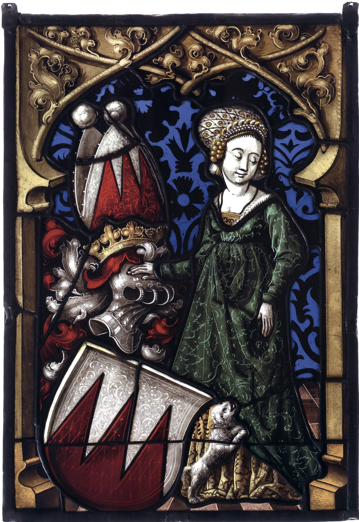
Abb. 14 Wappenscheibe der Grafen von Sulz, um 1500, ehemals im Arbeitszimmer von Johann Rudolf Rahn, Talacker, Zürich. Farbige Gläser bemalt, 36 × 24,8 cm. Schweizerisches Nationalmuseum, LM 12807.