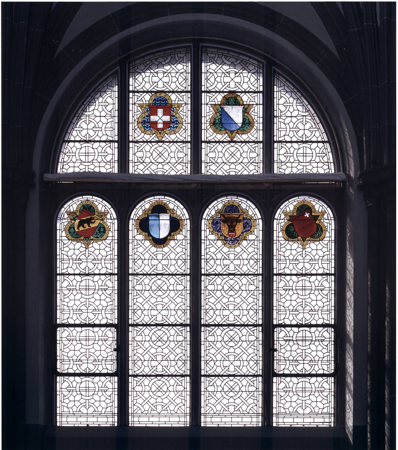
Abb. 9 Südliches Mittelfenster in der Ruhmeshalle im Landesmuseum Zürich, Wappen der Schweiz, von Zürich, Bern, Luzern, Uri und Schwyz, Entwurf Alois Balmer, diverse Glasmaler, 1896/97. Schweizerisches Nationalmuseum, DIG 5086.