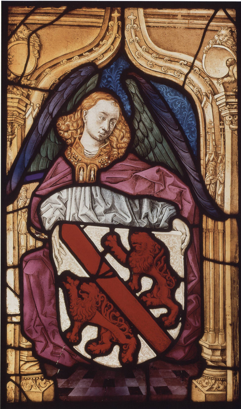
Abb. 12 Stadtscheibe von Winterthur, um 1493, Herkunft Wallfahrtskirche St. Anna, Veltheim bei Winterthur. Farbige Gläser bemalt, 77 × 46,2 cm. Schweizerisches Nationalmuseum, LM 4698.