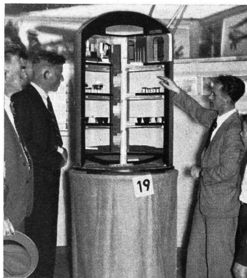
Offizielle Führung in der Berner Luftschutz-Ausstellung Erklärung des «Schindler»-Unterstandes

Zusammenfassend sei noch erwähnt, dass es mit dieser Konstruktion gelungen ist, eine Art Keller zu schaffen, der den nötigen erhöhten Schutz bietet für alle diejenigen, die unter allen Umständen auf ihren Posten ausharren müssen, dann aber auch für die werktätige Bevölkerung.