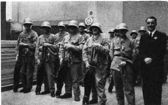
Groupe de D. A. P. de Lausanne.

La ville de Lausanne a organisé au milieu du mois d'avril ses deux premiers exercices d'obscurcissement, qui n'ont pas manqué d'apporter d'intéressantes constatations. En tout premier lieu, il faut signaler la bonne volonté que la population a manifestée à l'endroit de ces expériences nouvelles. Dans les quartiers du nord-ouest et de l'ouest de la ville, tour à tour, l'obscurcissement fut assez bien réalisé de 20 h. à 22 h. En effet, dans presque toutes les maisons, on a rencontré un réel intérêt de la