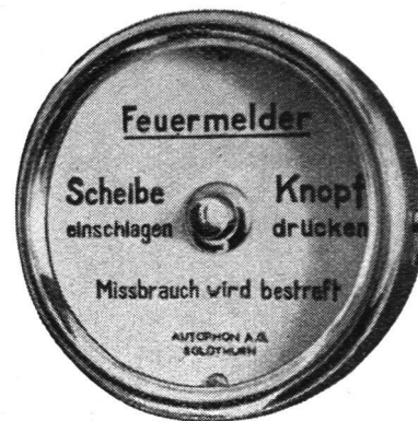
Druckknopf-Feuermelder für Innenmontage.

Zwecke der Kostenersparnis mit Alarmanlagen kombiniert werden können. Nach gründlichsten Studien unter Verwertung langjähriger Erfahrung auf dem gesamten Gebiete der Fernmeldetechnik