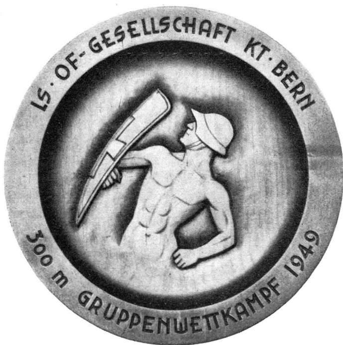
Wandteller für den ausserkantonalen Gruppenwettkampf \frac{1}{3} natürliche Grösse von P. Flück, Holzbildhauer, Brienz