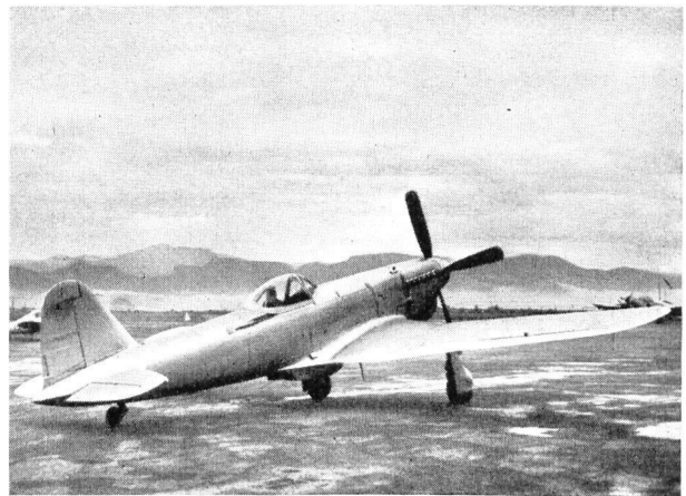
Der einsitzige Fiat-Uebungsjäger G-59 A

Als letzte und interessanteste Entwicklung in der langen Typenreihe der Fiat-Flugzeuge gilt der neueste