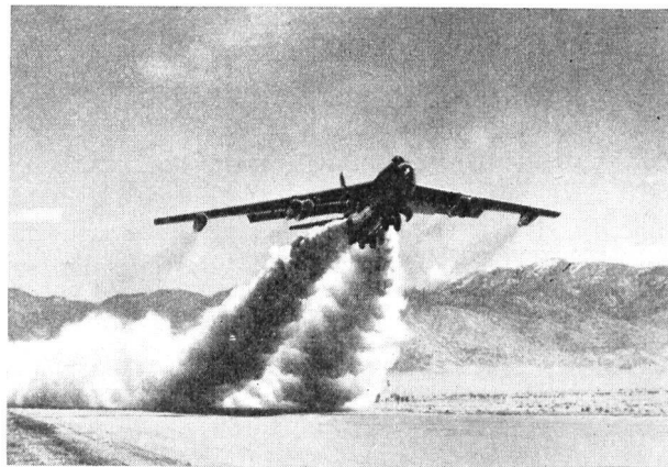
BOEING B.47 «STRATOJET»

Mit Rücksicht auf den dünnen, elastischen Flügel weist diese Type ein Tandemfahrwerk auf, das in den Rumpf eingezogen wird. Die Besatzung einer Stratojet besteht aus dem Piloten, dem Hilfspiloten und dem Navigator. Letzterer übt zugleich die Funktionen eines Bombenschützen aus.