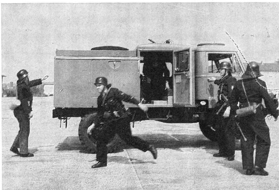
Die Bilder 10 und 11 zeigen ein Unimog-S-Vorauslöschfahrzeug des zivilen Bevölkerungsschutzes bei einem Feuerlösch-Schnellangriff.