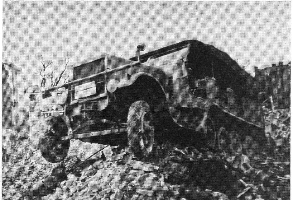
Die Bilder 6—9 zeigen Unimog-S-Rettungsfahrzeuge des zivilen Bevölkerungsschutzes auf Kolonnenübungsfahrt in weglosem Gelände.