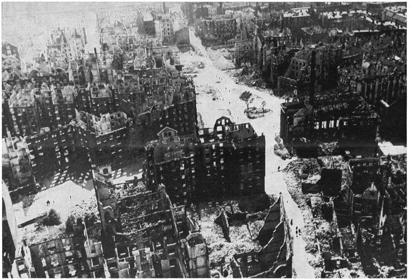
Bild 1. Zerstörter Innenstadtteil von Hamburg nach dem ersten schweren Nachtangriff vom 24. Juli 1943.