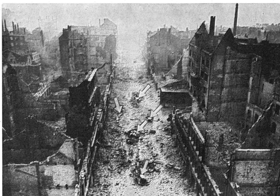
Bild 4 Von Trümmern eingeschlossene und durch Feuer vernichtete 12 Feuerlöschfahrzeuge während der Luftangriffe im Zentrum von Hamburg.