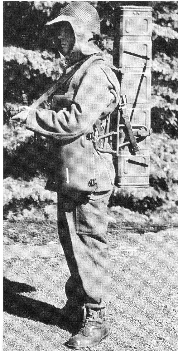
Das gesamte Bantam-System ist leicht von einem Mann zu tragen. Mit Transport- und Abschussbehälter, Erhöhungsstütze, Kabel und Kommandogeber wiegt es 19 kg. Die persönliche Ausrüstung mit Maschinenpistole beträgt etwa 7 kg.

Nach den aus Schweden erhältlichen Angaben handelt es sich um eine ausgereifte und gründlich erprobte Entwicklung, die in ihrer Robustheit und Einfachheit der Bedienung für die Verhältnisse der Schweizer Milizarmee wie geschaffen scheint.