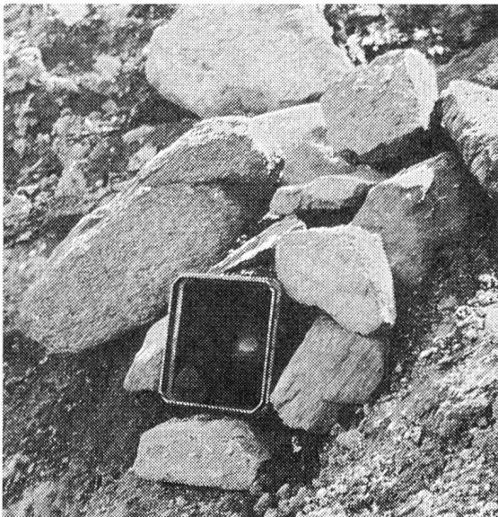
Um die Raketen gegen Splitter bei Artilleriebeschuss zu schützen, werden sie ohne irgendwelche besonderen Vorkehrungen im Boden eingegraben.

Aus der Bantam wurde so eine sehr kleine und sehr leichte Rakete in einem kombinierten, gleichzeitig als Abschusseinrichtung dienenden Raketenbehälter. Sie wird nach dem Prinzip optischer Zieldeckung mittels eines Kommandogebers vom Boden oder von einem Fahrzeug aus gelenkt. Die Lenksignale werden per Draht übertragen. Die Rakete hat einen Gefechtskopf mit Hohlladung. Für Uebungsschiessen verfügt sie über einen Kopf mit Ladung zur Trefferanzeige oder einen blind geladenen Kopf.