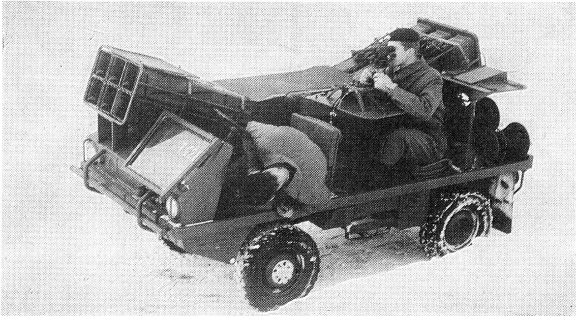
Der leichte, zu einem hocheffektiven Panzerkämpfer verwandelte Mannschaftsgeländewagen Puch-Haflinger. Bei Feuerbereitschaft aus dem Marsch können in etwa fünf Sekunden je 6 Raketen nach vorn oder nach hinten abgefeuert werden.