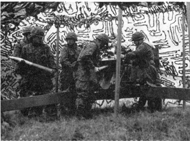
Artilleriestellung der Nordpartei im Wienerwald.