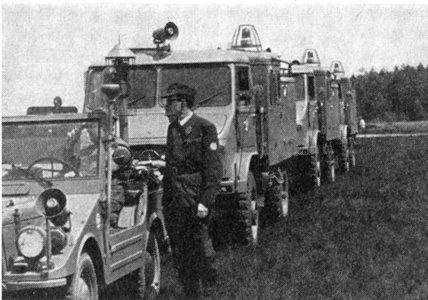
Fernmeldezug des Luftschutz-Hilfsdienstes der Bundesrepublik Deutschland.