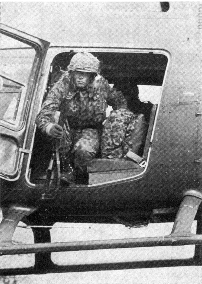
Dicht über dem Boden verlassen die Kampfgruppen den Helikopter. Jeder Helikopter kann eine Kampfgruppe mit Ausrüstung transportieren

ausländische Presse war nebst Berichterstattern aus dem Westen mit Militärreportern aus Rumänien, Jugoslawien und der Tschechoslowakei gut vertreten. Die Manöver wurden am Freitagnachmittag, dem 14. November, in Amstetten mit Zehntausenden von Zuschauern durch einen drei Stunden dauernden Vorbeimarsch der Manöververbände abgeschlossen.