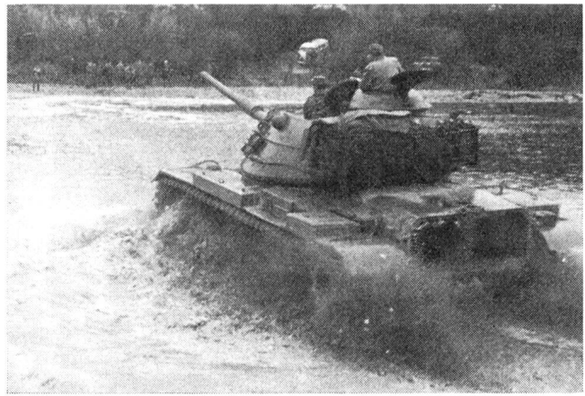
Am dritten Operationstag durchfuhren zwei zur Verstärkung von Blau herangeführte Panzerbataillone die 80 cm hohe Ybbs, um im Gegenstoss die Panzerkräfte der orangen 9. Division zum Stillstand zu bringen. Mittels Kampfpanzer vom Typ M-60 A1, amerikanischer Herkunft