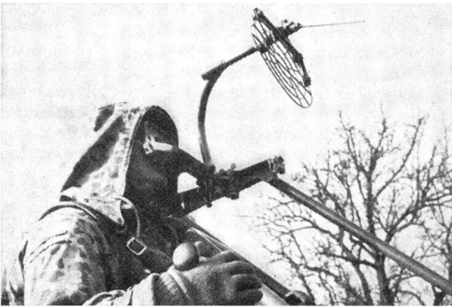
Ungenügend ist die Bewaffnung mit Fliegerabwehrwaffen. Hier ein Kanonier an der Flakkanone 20 mm M-58, der sogenannten Oerlikon-Kanone