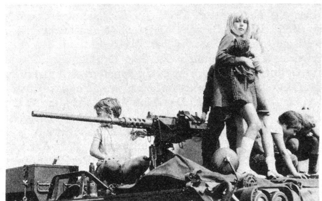
Die Jungen wollen es genau wissen und untersuchten jedes Detail