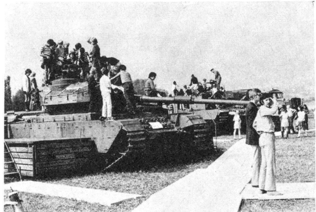
Grosses Interesse fanden vor allem bei der Jugend die Panzer