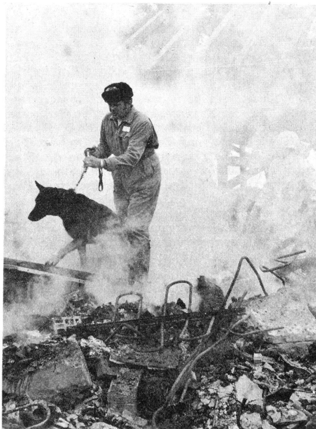
Ein Katastrophenhund im Einsatz