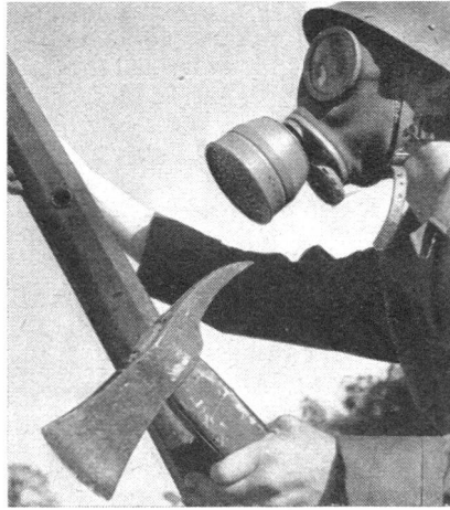
Angehörige eines schwedischen Industriebetriebes im Einsatz als Beobachter (links) und als Feuerwehrmann (rechts) an einer Uebung ihres Betriebsschutzes.