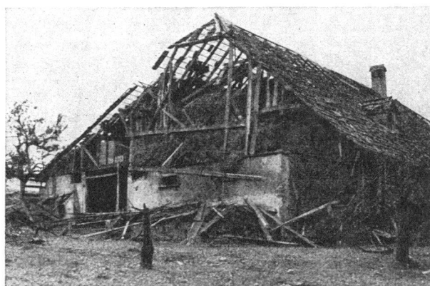
Wirkungen eines Sprengbombeneinschlages bei Riggisberg (Kt. Bern, im Jahre 1943).

Auch kleine Ortschaften in der am Kriege unbeteiligten Schweiz blieben nicht verschont