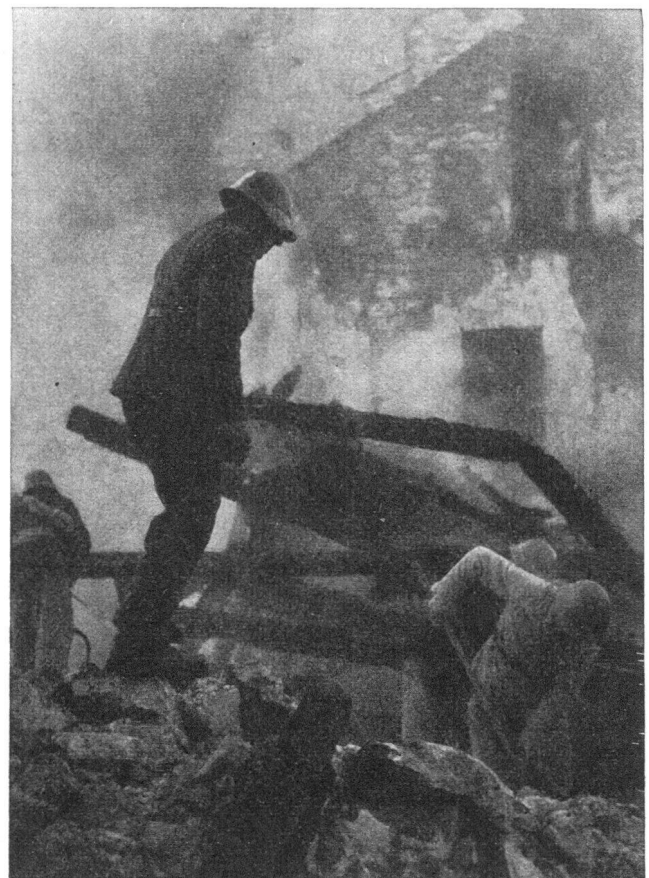
Befreiung von Verschütteten