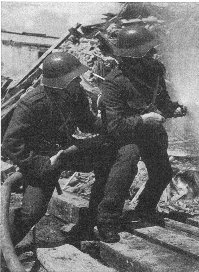
Im Kampf gegen das Feuer

Die Luftschutztruppe ist nun zahlenmässig nicht so stark, dass sie allerorten eingesetzt werden kann. Nach siedlungsmässigen, verkehrs- und wirtschaftspolitischen und militärischen Gesichtspunkten sind ein grosser Teil der Luftschutz-Bataillone oder -Kompagnien den wichtigsten und grössten Städten als örtliche Truppen zugeteilt. Eine mobile Reserve kann da und dort zur Verstärkung der Abwehr eingesetzt werden. Aber viele Ortschaften von 15 000 und weniger Einwohnern haben keine Luftschutztruppe in der Nähe stationiert. Schon darum muss eine zivile Schutzorganisation als Ergänzung zur Truppe geschaffen werden. Aber auch in den grossen Städten wird die zivile Schutzorganisation nötig sein. Sie kann viele Entstehungsbrände und Einzelherde und die nicht zu grossen Brände in den ausgedehnten Aussenquartieren mit eher lockerer Bebauung übernehmen. Die Luftschutztruppe wird dann an den meistgefährdeten Stellen mit geschlossener Ueberbauung eingesetzt (Stadtkern, Industriequar-