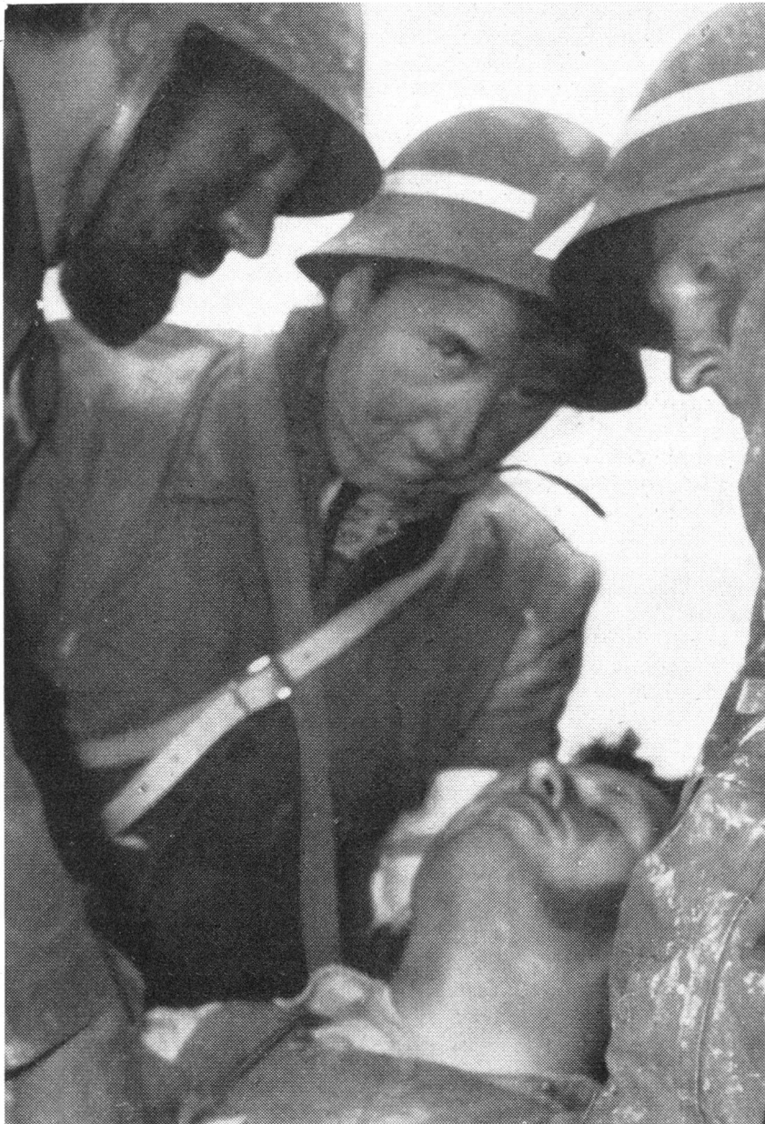
Einen Eindruck von der Realität und vom Ernst, mit dem die schwedische Zivilverteidigung ihre Uebungen durchführt, vermittelt dieses Bild vom Einsatz des Sanitätsdienstes.