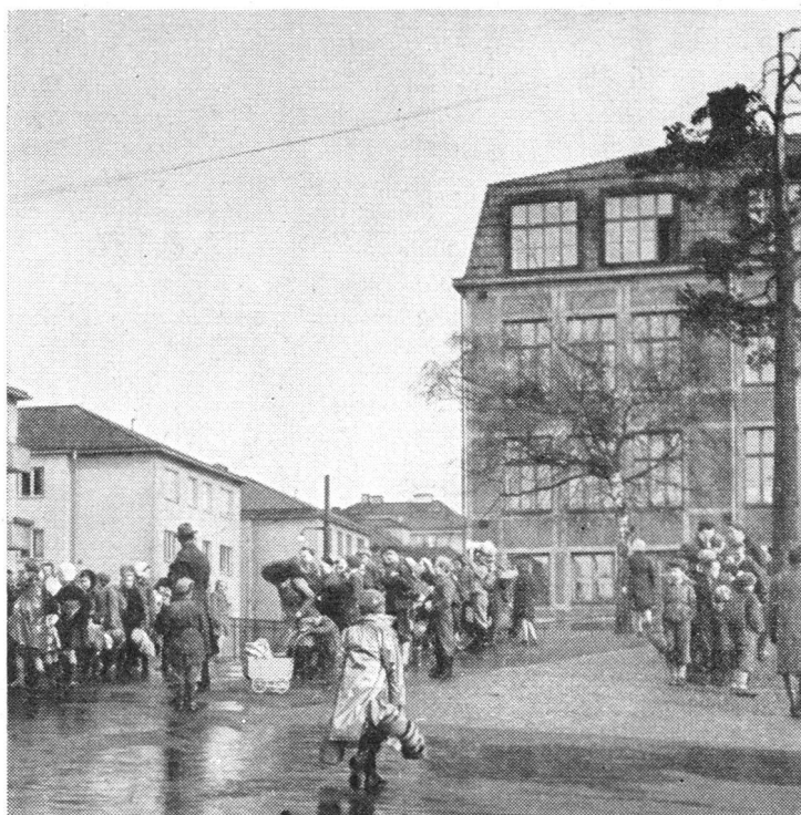
Uebungen, in denen die einzelnen Zweige des Zivilschutzes besonders geprüft werden, finden im Turnus jedes Jahr in verschiedenen Landesteilen statt. Hier sind die Kinder im Rahmen einer Evakuierungsübung zum Abtransport in ihre Ausweichquartiere versammelt.

kommt wie den militärischen Anstrengungen. Die militärischen Vorbereitungen allein werden als nutzlos erachtet, wenn die innere Front, der Schutz der Zivilbevölkerung, vernachlässigt würde. Es wird daher als erste Aufgabe des Zivilschutzes betrachtet, durch die Rettung von Menschenleben, von Einrichtungen