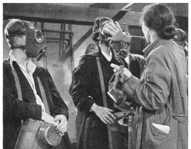
Das Verpassen der schwedischen Volksgasmasken gehört mit zur Instruktion, wie sie im Heimschutz vermittelt wird.