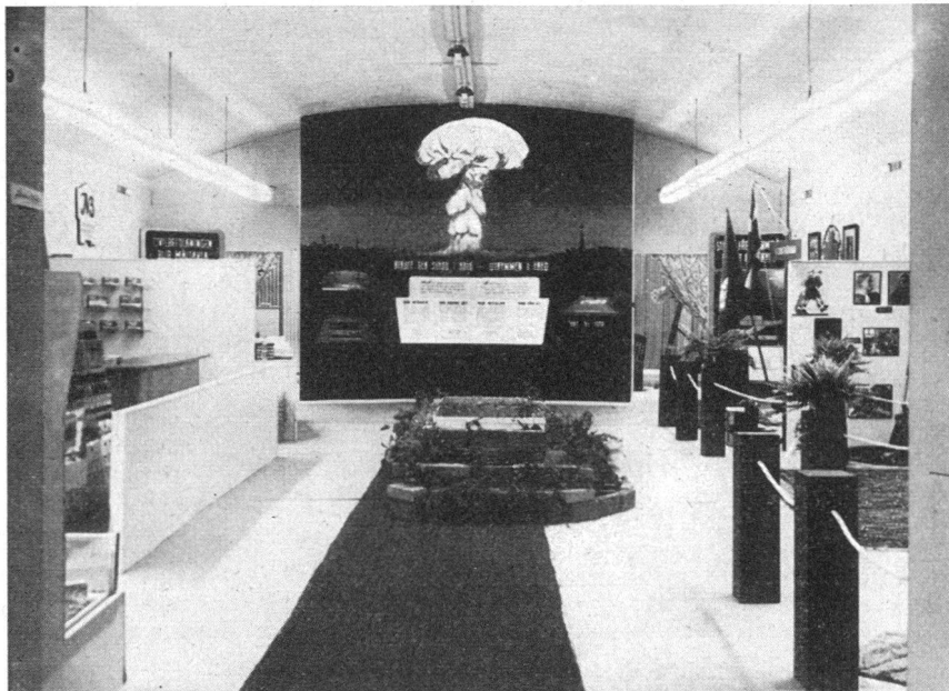
Die schwedische Zivilverteidigung leistet auf dem Gebiete der Aufklärung der Bevölkerung durch Radio und Presse, durch Demonstrationen, Vorträge und Ausstellungen einen gewaltigen Einsatz. Unser Bild zeigt einen Ausschnitt einer Wanderausstellung, die sich mit dem Schutz gegen die Atomwaffen befasst und die Notwendigkeit eines gut gerüsteten Zivilschutzes unterstreicht.

Der Stand der schwedischen Zivilverteidigung wird von den verantwortlichen Behörden noch nicht als genügend betrachtet. Es sind zurzeit Untersuchungen und Diskussionen im Gange, welche die heutige Organisation und ihre Zweckmäßigkeit betreffen. Der im Vergleich mit anderen