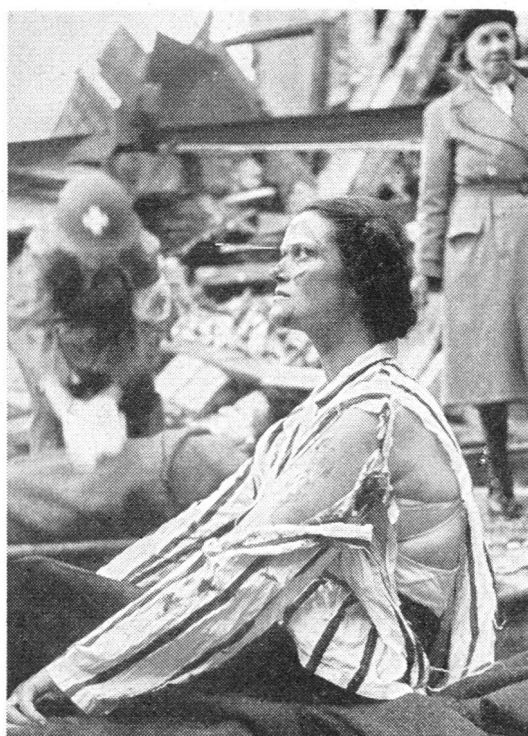
Der realistischen Ausbildung des Sanitätsdienstes wird besondere Beachtung geschenkt, wobei nichts unterlassen wird, die Figuranten mit Attrappen und Schminkmitteln herzurichten.