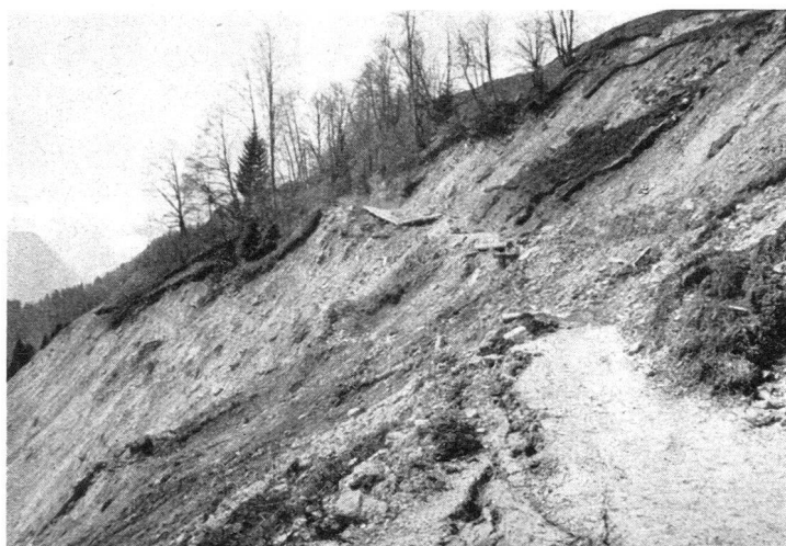
Zerstörtes Alpsträsschen Notdürftige Instandstellungen, die immer wieder beschädigt werden.

Gänge befindlichen behördlichen Massnahmen zur Konsolidierung des Rutschgebietes noch besonders hervorheben und ihnen den gebührenden Erfolg wünschen. Eine Gefährdung der Unterlieger ist nämlich bereits vor Jahren behauptet worden und seither glücklicherweise nicht eingetreten. Inzwischen sind umfangreiche Schutzbauten durchgeführt worden und weitere werden folgen, wobei allerdings bemerkt werden muss, dass ihre bisherige Wirkung noch ungenügend ist, und dass auch an eine mögliche ausserordentliche Verschärfung der Lage zufolge der gegenwärtig sich häufig wiederholenden starken Platzregen zu denken ist.