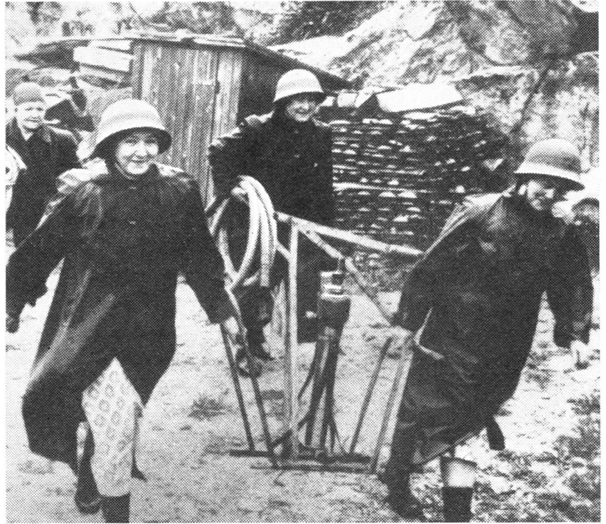
Weibliche Feuerwehr in Schweden

Zur handlichen Notausrüstung gehören Kleinkleinradio, Reiseapotheke und Taschenlampe.