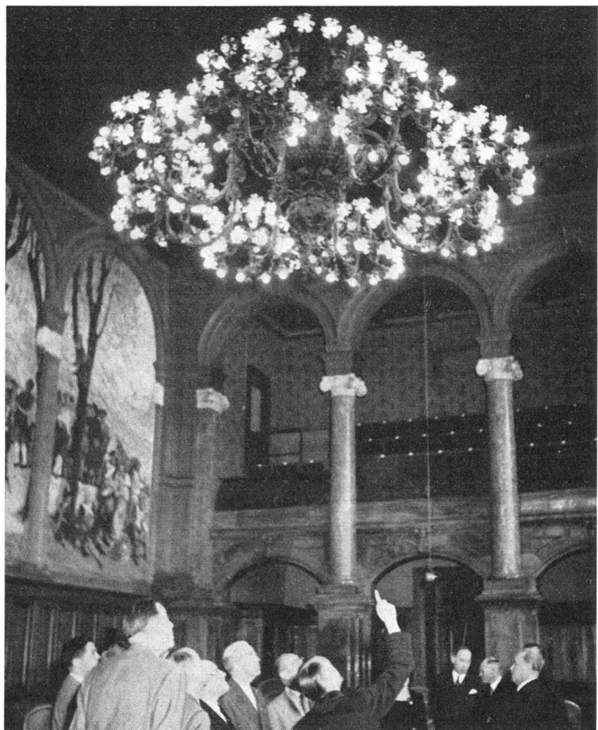
Licht leuchtet aus 214 Lampen im Sitzungssaal des Ständerates, wo die Gestaltung des neuen Verfassungsartikels über den Zivilschutz durch einstimmigen Beschluss ein bedeutendes Stück vorwärtsgetrieben wurde.

Der Kommissionsvorschlag dürfte aller Voraussicht nach reale Aussicht haben, bei der kommenden Abstimmung vom Souverän sanktioniert zu werden. Die Zeitverhältnisse fördern